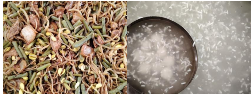
泌阳县春水镇孟冲小学校 4-19 13:26 来自 分享按钮

2024年04月25日用餐: 应到人数63人, 实到人数61人。菜品: 花菜胡萝卜香菇炒肉 , 蒸蜜薯, 银耳莲子粥。消耗白糖1.60kg, 银耳莲子粥1.90kg, 花菜7.70kg, 香菇2.30kg, 肉4.20kg, 胡萝卜5.30kg, 红薯13.70kg, 油0.50升 @免费午餐