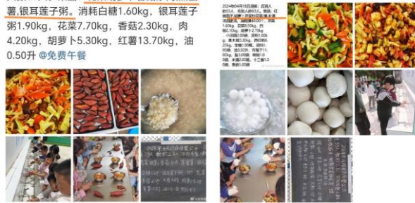
泌阳县春水镇孟冲小学校 4-17 16:25 来自 分享按钮

2024年04月17日用餐: 应到人数63人, 实到人数63人。菜品: 蒸米 , 西红柿炒蛋 , 红椒炒黄瓜 , 紫菜蛋花汤。消耗红椒2.90kg, 鸡蛋4.60kg, 紫菜1.00袋, 西红柿10.30kg, 大米5.00kg, 黄瓜9.90kg, 香蕉16.40kg, 油1.00升 @免费午餐