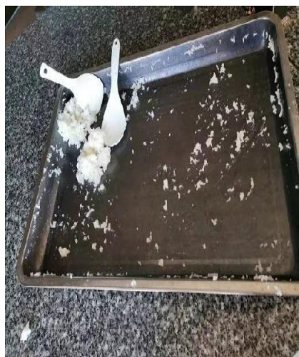
2022年11月24日 倒饭倒菜情况