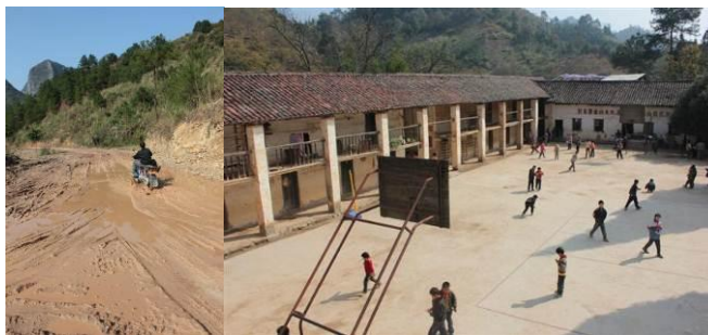
图 1 下雨后通往学校的泥路 图 2 学校操场左边的楼已成危房