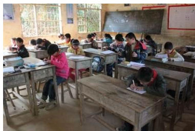
图 7 学生教室

学生的餐具由厨工统一清洗后消毒，卫生良好。学生大多在教室就餐，教室由于房屋较老，卫生一般。冰箱中有前几日的留样。