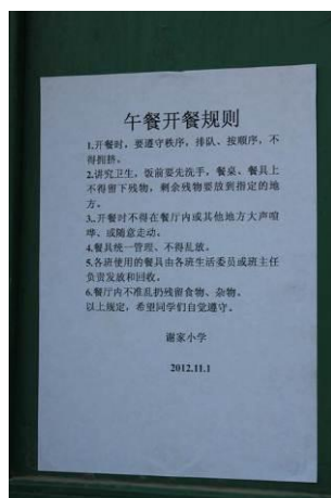
图 11 校内张贴的开餐规则