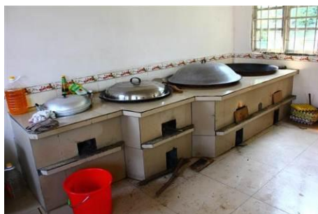
图 6 灶台