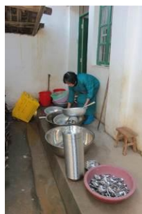
图 4 厨工衣着较整洁