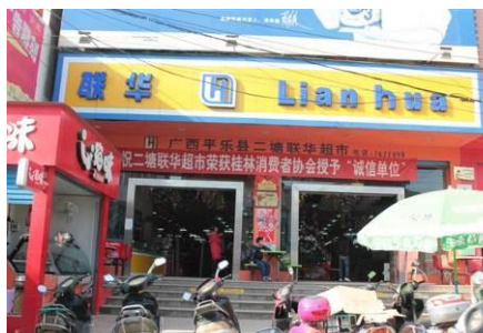
图 12 给学校送货的超市

有时为 0.8 元，大蒜头标价为 3.5 元每斤，学校采购的老蒜价格为 4 元。调查人员询问了超市的值班经理，她说超市要负责送货和开发票，大多数价格是比较超市略低或持平的。