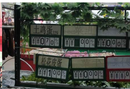
图 13 超市里的部分菜价

今天开餐情况：实到人数215人，午餐是猪肉拌大白菜、老蒜。买大白菜65斤x1.0=65元老蒜2斤计币8元，调和油1瓶63元，猪肉18.1斤x10.5=190元。合计开支326元。到今日至今，结余现金1738.70-326=1412.70元，米结余168斤，鸡蛋结余456个。@小小挑山工 @免费午餐 @liz惠子 12月5日14:36 来自新浪微博