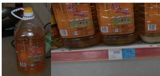
图 15 学校调和油采购价与超市零售价一样