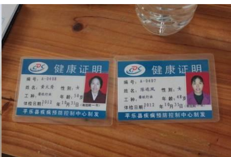
图 5 健康证