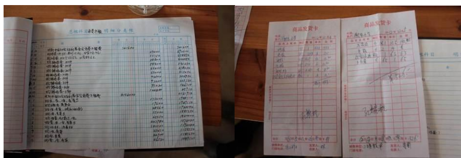
图 16 总账及部分票据