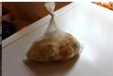
图 8 留样