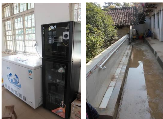
图 9 装了一部分餐具的消毒柜 图 10 学生洗手的洗手池