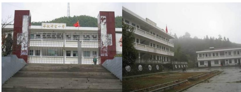
图 1 学校外景