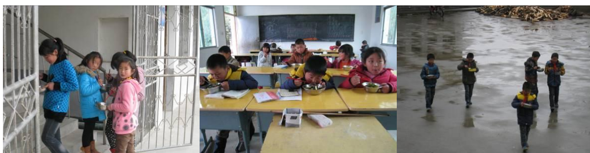
图 8 学生用餐组图