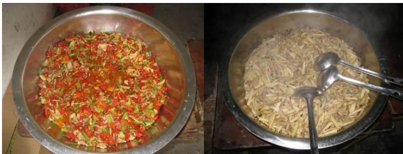
图 9 当日菜品