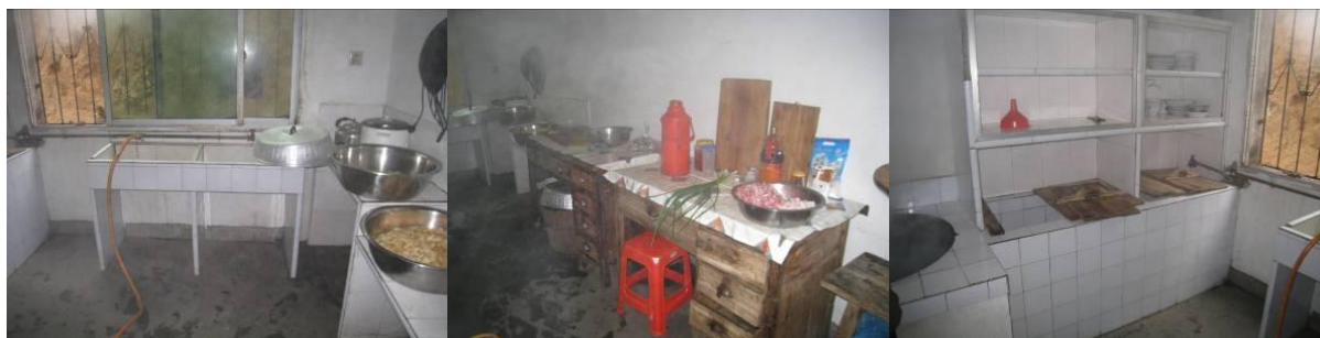
图 5 厨房图片组图