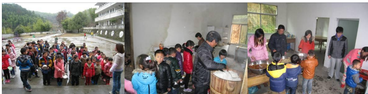
图 7 学生领餐组图