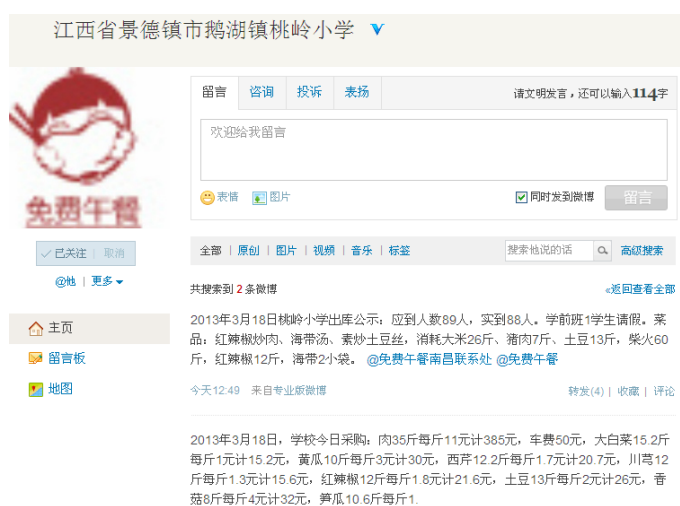
图 3 就餐人数的微博截图

调查人员算了一下当日就餐人数: 学生 77 人+厨工 2 人+老师 10 人=89 人。与微博公示相符。