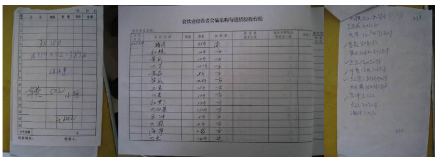
图 10 调查当日的采购凭证组图