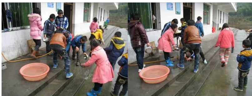
图 6 学生餐前洗手组图