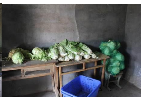
图 7 储存的蔬菜