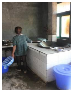
图 4 厨师穿着比较干净

调查当日由于天气较热,厨师没有穿工作服,但厨师本身穿着比较干净。校长说现在在做饭洗碗用的水都由厨师走 20 分钟挑过来,天热时挑完水再做好饭会比较晚,希望能多请一个厨师。