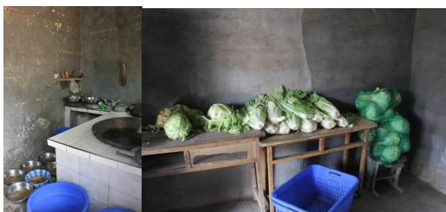
图 6 厨房的工作台和灶台

学校的厨房和教室在同一栋平房中,厨房面积比较小,储存餐具和蔬菜在隔壁的屋子,墙面都是水泥墙面,比较干净。