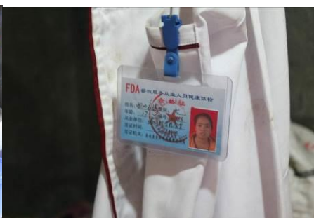
图 5 健康证