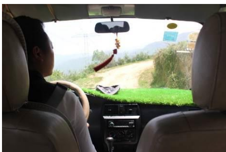
图 1 调查人员乘坐的面包车, 路况很差沿途很颠簸。

调查人员 5 月 15 日从美姑县城出发, 在县城边有前往学校的面包车。由于中午乘车人少, 调查人员包车前往学校 (70 元, 约半小时)。往学校的路况很差。从学校出来后调查人员走小路回到大路边, 沿路走一段后搭到一辆面包车 (10 元) 回到县城, 结束对塔千村小的探访。