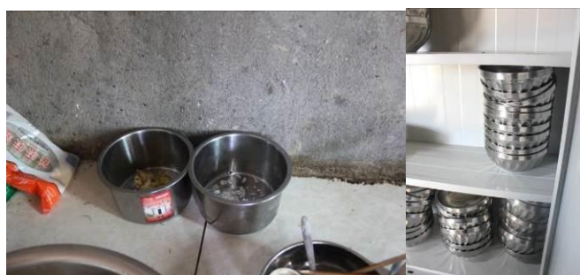
图 9 菜品留样和存放餐具的碗柜