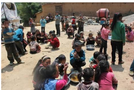
图 8 学生围在操场上吃饭