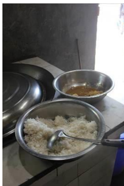
图 10 没吃完的米饭

学校老师和学生吃的饭菜一样,会提前留出来一些给老师吃。调查当天留出来的米饭比较多没有吃完。学生剩下的饭菜也较多。老师说这是因为调查当天没有肉菜,学生吃得比较少。有肉菜的时候米饭就会吃得比较干净。