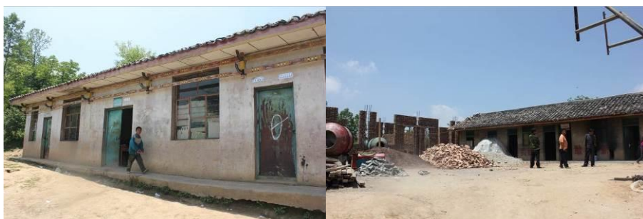
图 2 村委的房子现在用作学前班上课

塔千村小位于四川省凉山州美姑县巴普镇,离县城直线距离很近。学校现在有一年级,三年级,四年级共 84 名学生。老师 3 人,其中一人为代课老师,厨师 1 人,门卫 1 人。学校现在只有一排平房作为教室和厨房,学前班借用村里的屋子在上课。操场一边正在修两间新的教室,预计下学期可以使用。