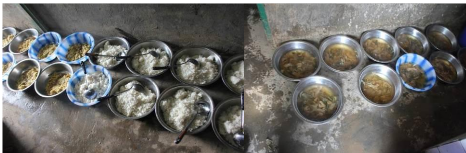
图 11 学生的饭菜和酸菜汤