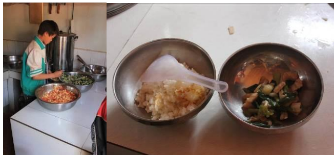
图 12 饭菜组图

当天菜谱为蒜苗炒肉和番茄炒蛋和酸菜汤。由于没有提前留出来，调查人员没能尝到饭菜的味道，但看当天的菜品外观还是比较好的。