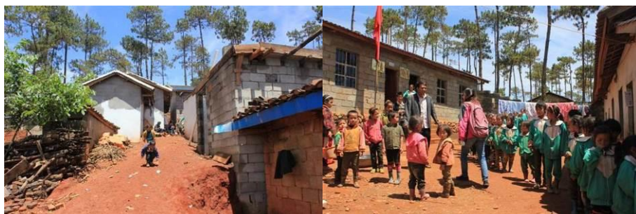
图 2 学校外景和操场，学校没有大门

“故哲”为彝语音译，“故”即爱、爱心之意，“哲”即匹哲、向上之意，“故哲”则是传播爱的意思。故哲小学位于西昌市太和县樟木乡麻柳村六组，建立于 2011 年，只有学前班和一年级。故哲小学由当地的两位村民自发建立，两间教室也是他们自己出钱建的，现在是彝族爱心社项目重点实施对象。学校基础设施比较简陋，现在正在考虑扩建。