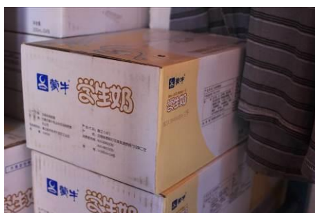
图 10 老师宿舍里的牛奶

学校有几个老师会先吃，校长有时等学生吃完了再吃。饭菜和学生的一样。关于浪费调查人员注意到有一部分学生也不是吃不完，但是习惯剩一点倒掉。在老师办公室调查人员看到有一些蒙牛的学生奶，经询问校长说是有营养午餐的中心校送过来的，还没有给学生发。当天经过执行工作人员方丹的协调，学校已经把牛奶退回，并在微博上公布了结果。