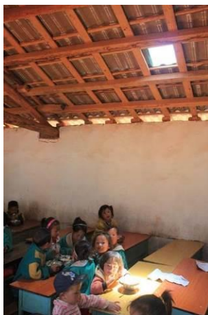
图 3 教室内的采光靠屋顶上的小窗