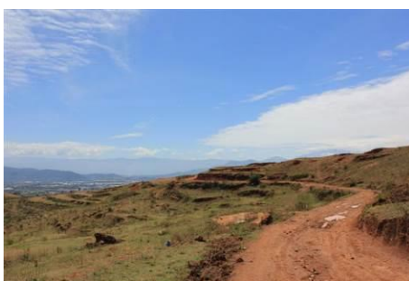
图 1 连接学校和水泥路的土路

调查人员 5 月 7 日从雅安出发, 乘坐大巴前往西昌, 当天住宿西昌西客站旁。5 月 8 日前往金新小学探访后宿青年旅舍。5 月 10 日上午调查人员从市内乘公交 14 路达到名店街 (1 元), 走到大成乘坐太和方向的公交 (2 元)。达到后换乘面包车 (包车 40 元, 约 20 分钟) 到通向学校土路的路口, 而后走路十几分钟到学校。全程约两个半小时。调查完毕后调查人员走回到水泥路, 搭到一辆三轮车到太和, 换乘公交车回到市内, 结束本次调查。