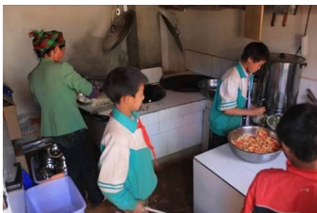
图 6 厨师和帮忙打菜的学生

调查当天温度比较高,厨师嫌热没有穿工作服,但自身穿着比较干净,而且本地妇女有裹头的习惯代替了帽子。据校长说厨师的健康证还没有办下来。