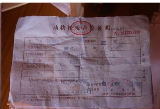
图 15 猪肉检疫合格证明