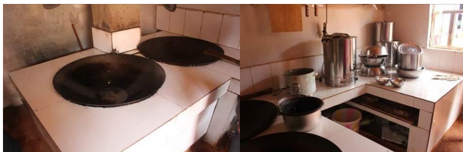
图 7 灶台和工作台

学校厨房条件比较简陋,苍蝇比较多。由于学校操场地面没有铺水泥,洗碗洗菜又直接在操场上,有泥土带进厨房使地面较脏。灶台和工作台比较整洁。