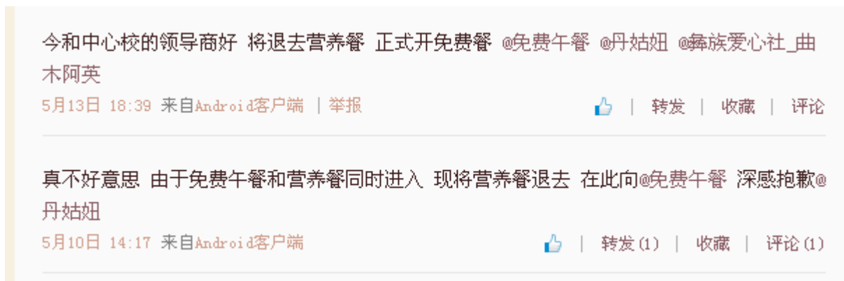
图 11 学校关于牛奶的微博