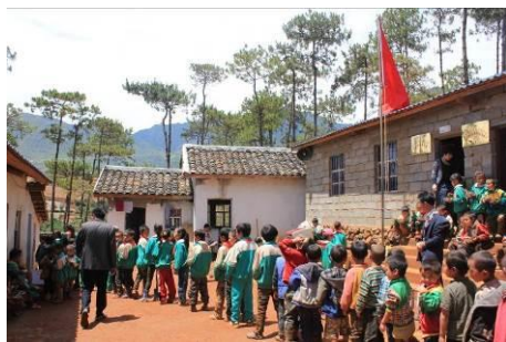
图 8 孩子们会自觉排队