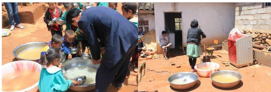
图 9 操场上洗碗的地方，脏水会直接倒在地上顺着山坡流走