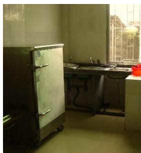
图 8 厨房一角