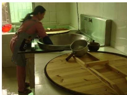
图 7 厨师正在搞卫生