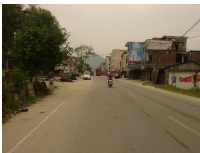
图 1 小三江镇

广州到连山, 车费 90 元。连山到小三江, 车费 15 元。早上 7:30, 连山往佛山的班车途经小三江, 调查者 9 月 18 日准点出发, 从连山赶往小三江。