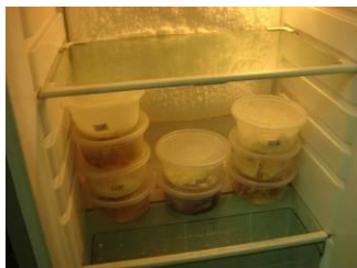
图 10 自觉排队