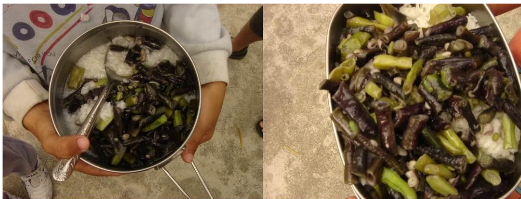
图 3 自费午餐