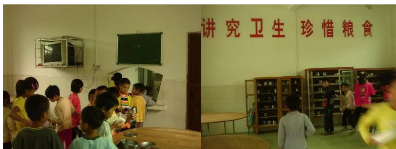
图 9 孩子打饭的情况