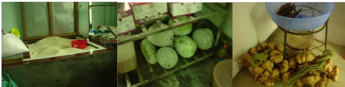
图 12 仓库食材