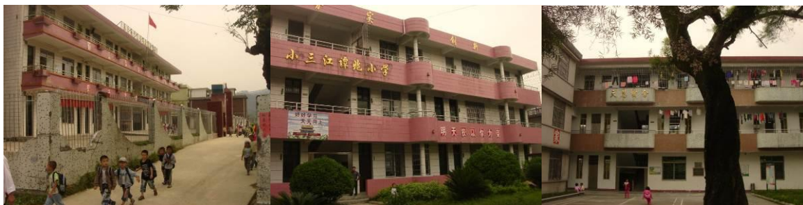
图 1 小三江完小

小三江完小位于广东省清远市连山县小三江镇。该校 1~6 年级共 572 人,学前班 118 人。其中,住宿生 116 人,校长 3 人,老师 33 人,厨工 3 人。中国社会福利基金会的免费午餐基金从 2011 年 5 月起,向该校住宿生及老师和厨工提供免费午餐及相应的运作费用,小三江完小也因此成为广东省第一所免费午餐基金受助学校。