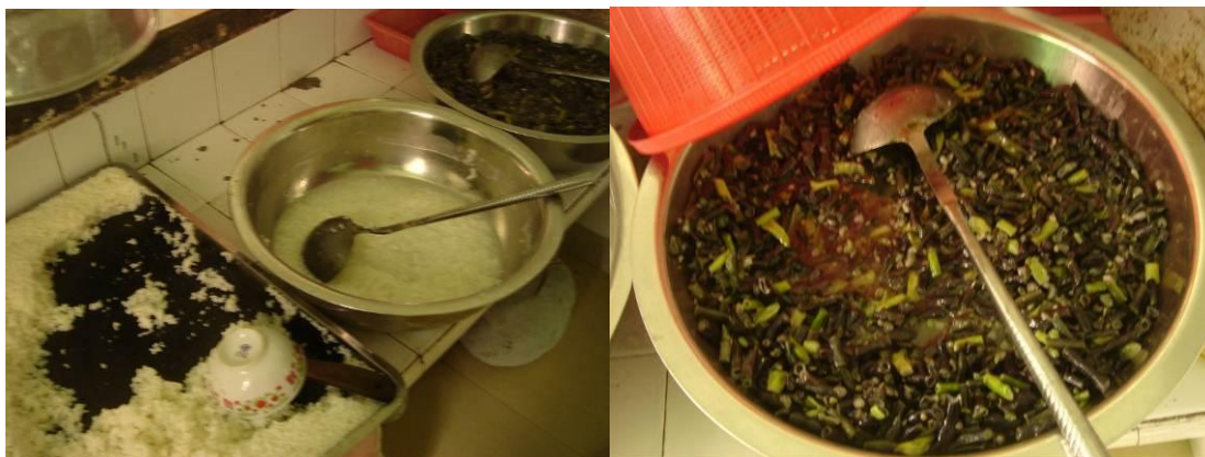
图 11 当日供应