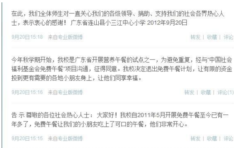
图 5 退出的微博剪图