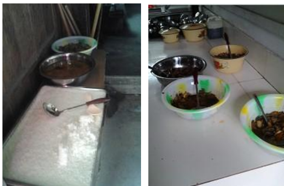
图 7 做好的菜品

天水池村小学菜品质量一般，午餐是：洋葱炒肉和汤菜。能保证每天菜里都有肉，米饭能满足需要，分量不够的话可以再去添加。个人认为如果能多加一个菜，就更好了。