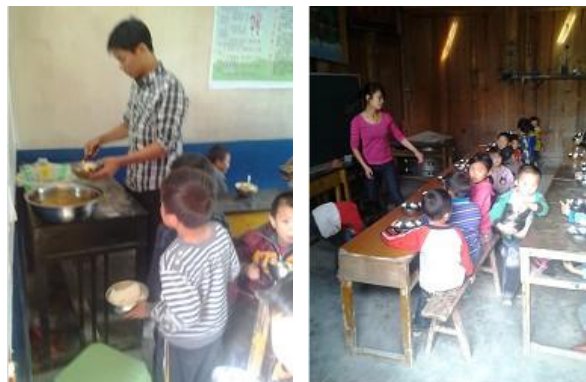
图 6 老师给孩子们盛饭