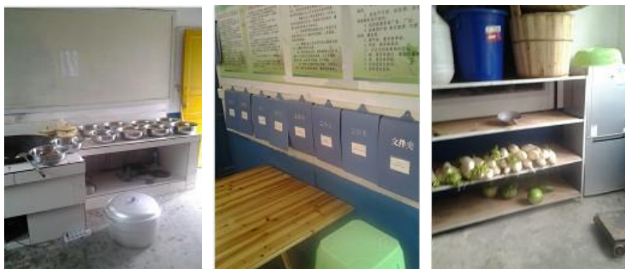
图 4 厨房状况组图