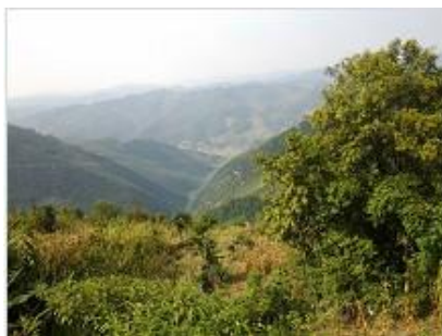
图 1 学校周边环境

调查者 9 月 17 日夜到达习水县, 第二天早上搭乘习水县一三岔河镇的班车到三岔河, 然后乘摩托车 20 分钟, 大约 11 点半到达天水池村小学。这段 20 分钟的路全是石子路, 路况较差, 很颠簸, 周围全是山。