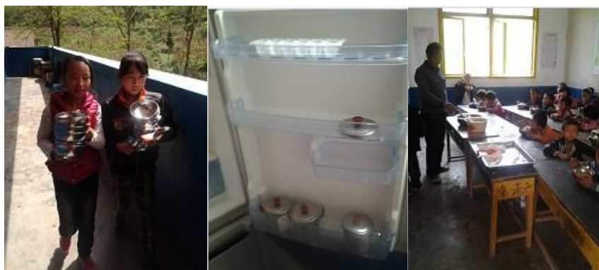
图 5 学生用餐状况组图

开餐后, 学生们没有洗手环节, 而是直接去厨房拿碗筷端饭菜。饭后, 碗筷统一放在大锅里由厨工进行清洗, 菜品进行了留样。