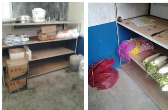
图 8 储藏室内景组图

由于国家实施营养餐，账务由镇上三岔河中学统一管理。三岔河中学统一采购大米、油和肉，每次采购完校长就会把这些东西统一拿到学校，学校只负责买平时的蔬菜，蔬菜有时候在村民那里买些，大部分时间在镇上采购。每个月校长拿着票据去三岔河中学那里报账，免费午餐的拨款由三岔河中学管理统一做账。