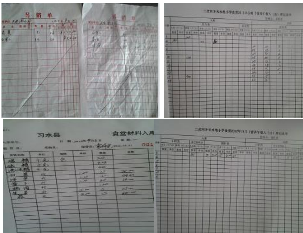
图 9 账目组图

从 2011 年 12 月至今，免费午餐给天水池村小学的拨款共有三次，分别为：第一次鸡蛋测试 4884 元，第二次 22481 元，第二次钱没有用完，六月份又拨款 9772 元，这 9772 元也许是用于学校购买厨房设备的拨款，学校也不清楚是什么款项，所以请财务部门核查清楚。该校于 2012 年 4 月成功申请了希望厨房，给学校配备了冰箱、消毒柜、脱皮机、豆浆机，餐具。所以请财务部门核查一下这 9772 是什么款项。