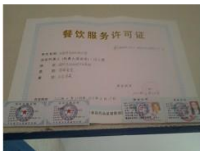
图 2 厨师们的健康证

调查者进入厨房后发现厨师的自身卫生状况很好,全部穿着白色工作服做饭,都有健康证。