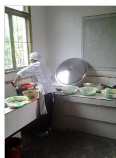
图 3 身着工作服的厨师