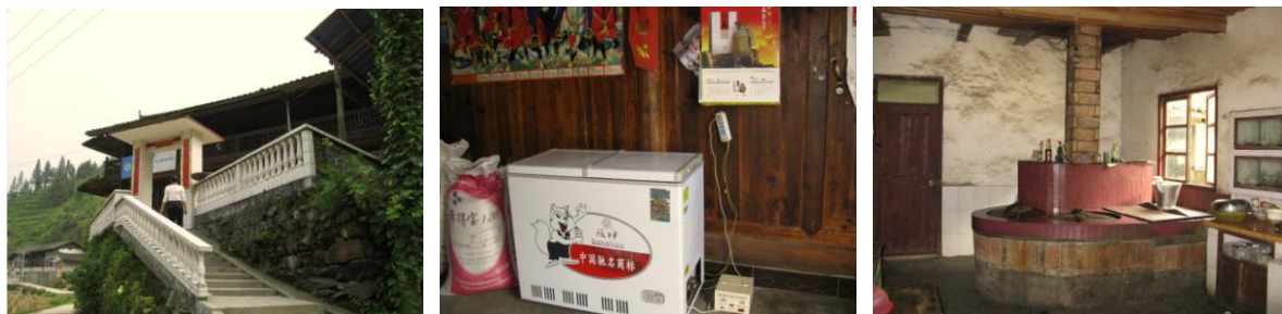
图 4 厨师家厨房组图