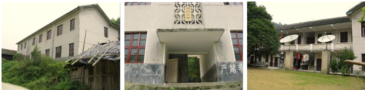
图 2 龙山小学外景组图

该校虽有水泥路直达校门口,却因地处深山,公共交通极其不便。一个月有四次赶集,赶集日在中午有不定时往来于碧涌的小面的。非赶集日一天有一趟对开班车往来于芷江县。