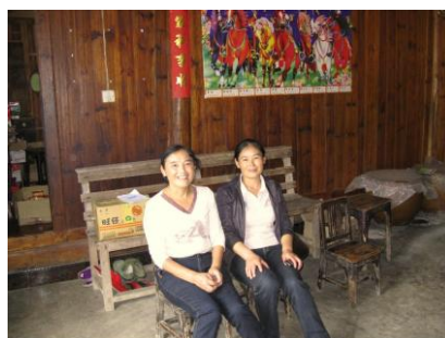
图 5 老师与厨师在厨师家的合照