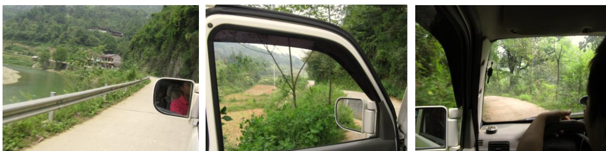
图 1 从碧涌往龙山小学路况组图