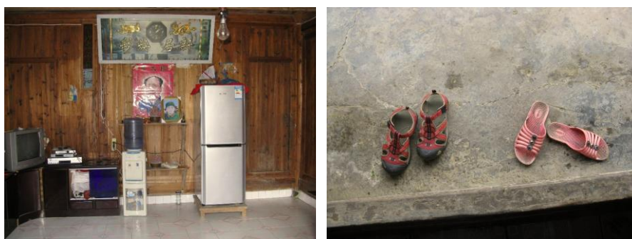
图 3 老师家组图

由于龙山小学自今年 9 月 11 日起执行免费午餐是借用厨师家的厨房,因此,调查人员进屋后直奔厨房查看灶台,地面,墙身,水池的卫生,情况让调查人员很满意,厨房内干净卫生,空气通爽,厨具也摆放整齐。