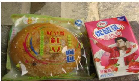
图 9 调查人员在龙山校看到的牛奶和面包

该校学前部小班的课室设在一楼, 学前部大班随小学部二年级在二楼同一个课室上课。调查人员到校后, 跟随老师上二楼查看学校为开餐新购置的电器, 无意间发现楼梯扶手摆放了 1 盒牛奶和 1 个面包。就此情况, 老师解释这是给在校装修的师傅的 (该校阅读室及全校门窗正在做翻新工程), 调查人员问牛奶面包是哪里来的, 老师说是从镇上买的。