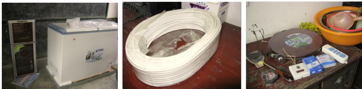
图 14 电器等组图

免费午餐基金的很多受助学校都借用厨师家的厨房,该校与别不同的情况是,厨师家的厨房干净卫生、且明亮通风,符合免费午餐基金关于开餐及食品安全的要求,所以在厨师愿意提供场地的前提下,调查者建议尊重学校老师及厨师的决定,维持借用现状。