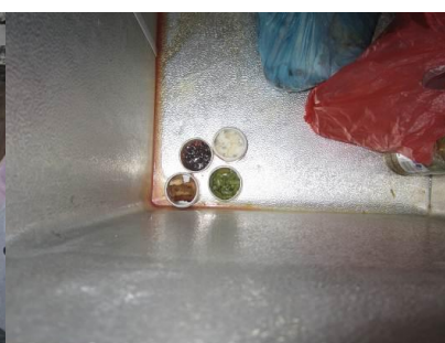
图 5 留样没单独存放