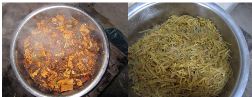
图 12-13 当天的菜

调查当天菜谱是：肉炒豆腐干皮、炒土豆丝、紫菜蛋花汤，煮鸡蛋与当天微博公示一样。调查员交 10 元钱后与学生同餐，味道很好。