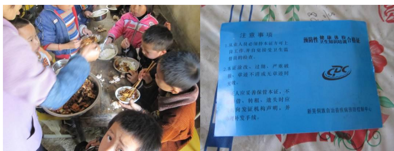
图 10 一道道上菜