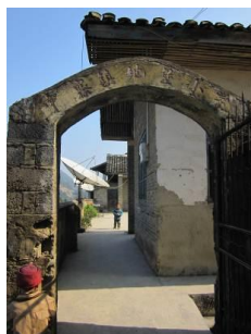
图 1 地堡村小

调查人员 2012 年 11 月 11 日从湖南长沙坐 7 个小时长途汽车到新晃县, 11 月 13 日上午 11: 00 到达地堡小学。