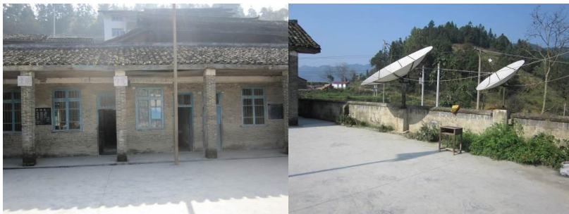
图 2 - 3 学校内景

中寨地堡村小有二个年级, 其中: 学前班38名; 一、二年级30名; 共计68名学生。在册公办教师2名; 厨师1名; 合计: 71名师生。