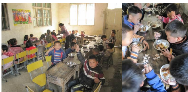
图 6-9 消毒柜、学生排队打饭、就餐