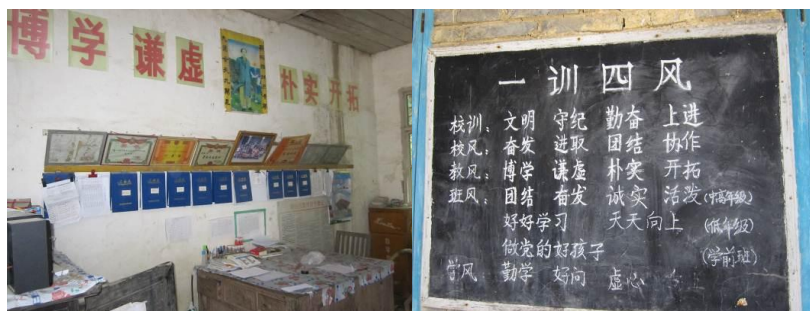
图 21-22 墙上的奖状和宣传板报