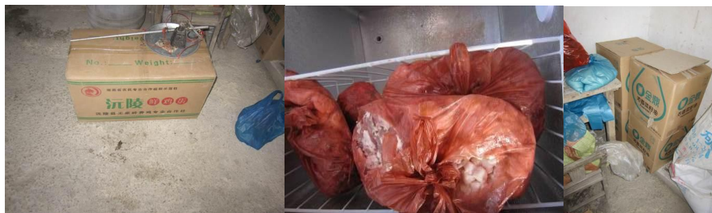
图 14-16 库存的蛋、肉、油