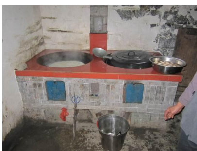
图 4 厨房内景