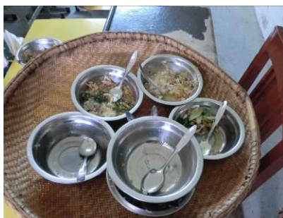
图 9.学前班学生剩饭