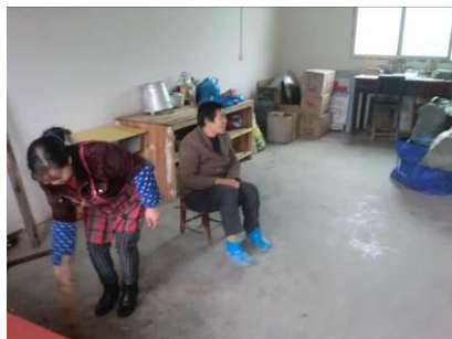
图 3. 厨师在打扫卫生

调查者走进厨房, 看见厨师正在打扫卫生, 准备做饭。厨师虽然没有穿工服, 但是穿有围裙。