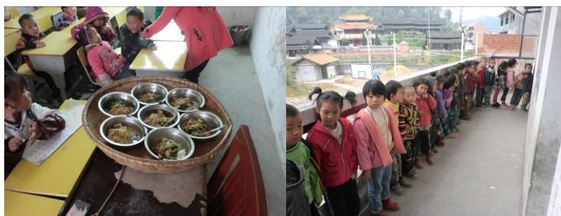
图 5.学前班孩子等待吃饭

开餐后, 学校负责人并未组织安排学生洗手, 菜品留样未保存 48 小时。学生就餐排队, 学前班由老师把午饭端到教室分发, 一、二年级在排队等厨师打饭, 餐具由厨师清洗, 洗完消毒。