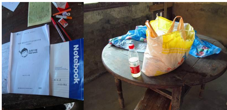
图 4 桌上的操作手册和剩饭

老师的讲台上放着《免费午餐操作手册》，这些都给人留下了积极的印象。但是对于 30 人左右的村小来说，当天的剩饭有些多，访问当地村民时，也有人反映说厨师每天拎一袋子剩饭回家喂猪，可见平时可能也存在浪费现象。