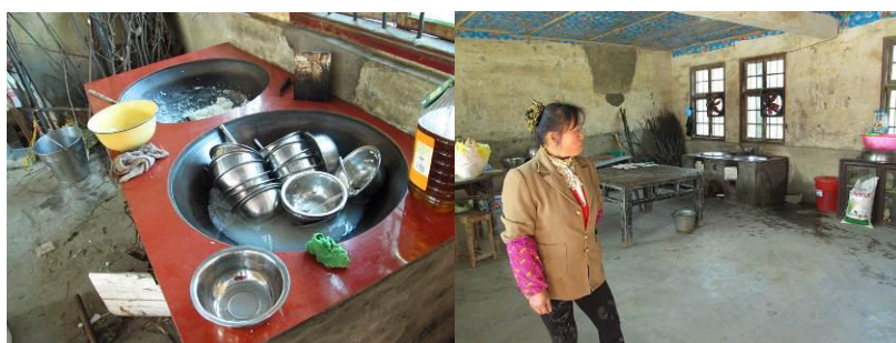
图 2 操作台和厨师

资+学前班 12 个孩子交的每学期 400 元学费+免费午餐的每月 600 元厨师工资。