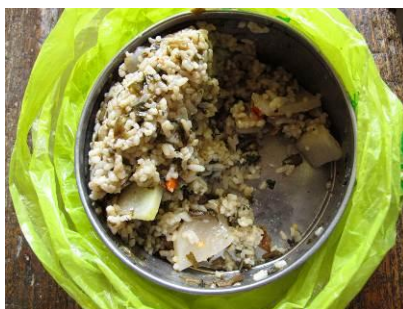
图 6 学生自己带的饭