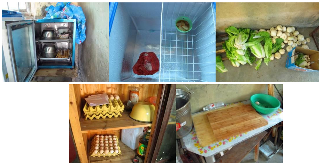
图 3 厨房内景组图

走进厨房，发现整体卫生情况尚可，除了正在清洗的餐具，还有一部分放在消毒柜里。冰柜内只有一块冻肉和一小碗食品留样，厨师解释说刚好吃完肉准备买新的了。角落里堆放着白菜、萝卜，储物柜里有鸡蛋和油盐酱醋，案板有两个，生熟分开。整体情况基本符合村小一级卫生标准。