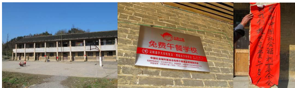
图 1 学校外景组图