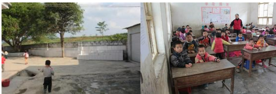
图 7 洗手池和学生教室