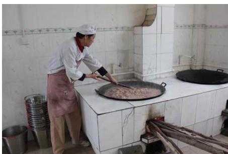
图 4 厨工穿有工作服及围裙

调查时有个别厨工没有穿工作服,但大多穿了工作服并有帽子围裙,衣着比较干净。调查人员没有看到厨工的健康证。