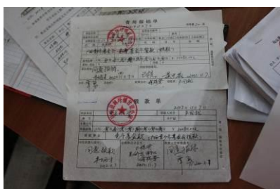
图 15 报账领钱所用的票据