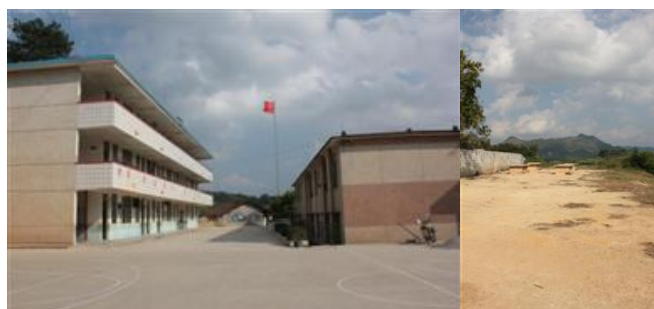
图 2 学校操场及教学楼，右图教学楼后面的操场没有硬化，厕所建在坡下