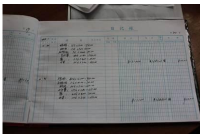
图 13 总账

甘豆小学有较详细的流水账及总账，流水账在总账上有记录，也有为报账用的采购验收明细，每日一张表，定期去中心校报账领钱。由于中心校规定每天每人必须有 3 元的伙食，学校做账时用调料费把差额补齐。调查人员看到每天学校的调料费一般是几块钱。