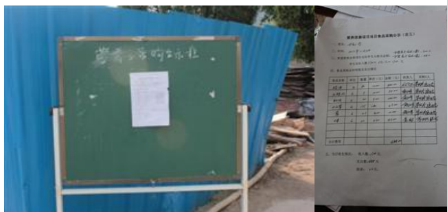
图 11 公示贴在大门旁边图 12 公示内容