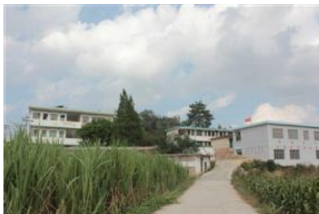
图 1 学校外景 右侧新教学楼还没验收，学校现在没有大门

甘豆小学属于南宁马山县林圩镇，位于南宁北部。学校设有学前班及一至六年级，有学生 535 人，老师 37 人。学生全部走读，由于规定不让用私营校车，住得较远的学生由家长接送。学校有两栋教学楼（一栋已成危楼），两栋老师宿舍（一栋为平房），现新建了一栋教学楼，还没有交付使用。学校现有免费午餐及营养午餐，免费午餐负责学前班及老师共 168 人的午餐。学校由九阳资助了厨房和蒸饭车、豆浆机等厨具。