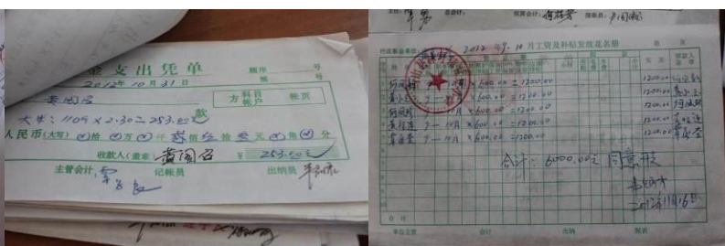
图 16 采购及工资收据