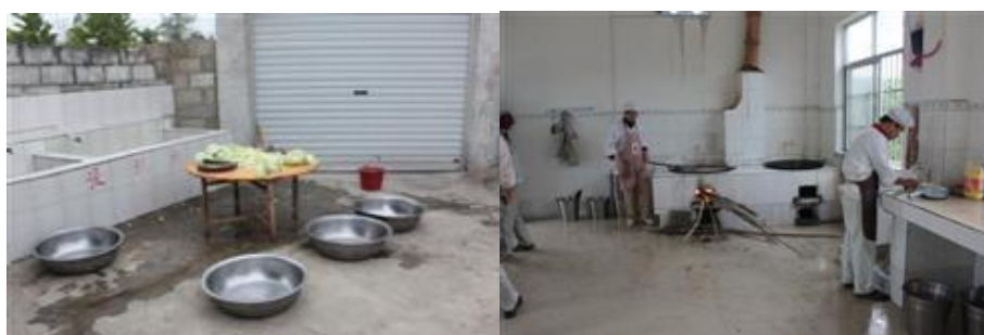
图 5 青菜在厨房外加工图

厨房是由九阳赞助的九阳希望厨房,卫生条件较好,洗菜在厨房外的洗菜池,做米饭用蒸饭车。烧柴时产生的黑灰使地面不太干净,但做完饭后厨工会进行清洗。