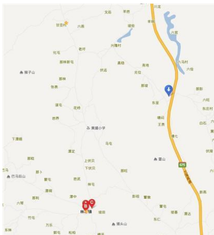
图 1 图中蓝色标志是东七村, 上方黄色五角星是甘豆村, 下方是林圩镇

调查人员 11 月 19 日从哈尔滨出发, 11 月 21 日到达南宁, 11 月 22 日上午从所住旅馆坐公交前往北大客运站(1 元), 得知去林圩的车在安吉客运站才有, 遂打的前往(30 元)。在南宁安吉客运站乘坐前往林圩的中巴(35 元), 下车后在林圩换乘小巴(3 元)前往甘豆小学, 小学离下车的路边很近。调查人员中午十二点到达学校, 学校师生已经吃完饭。下午结束调查后调查人员乘坐学校老师的车到达马山县(学校有部分老师住在马山县城, 也可在路边乘过路小巴前往马山, 据老师说镇上没有住宿的地方), 晚上住马山县。第二天上午调查人员乘学校老师的车再次前往甘豆小学, 随后前往东七村小学, 结束对甘豆小学的调查。