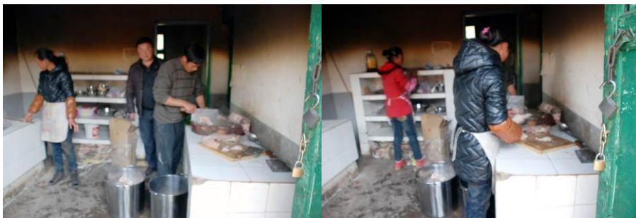
图 7 厨师共三位, 两女一男, 较干净