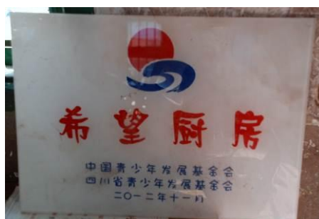
图 3 该校厨房是青基会捐献的希望厨房