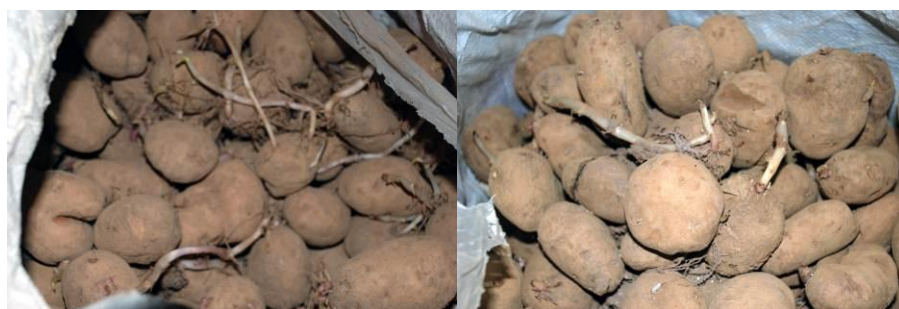
图 13 土豆发芽了, 但当地人会继续食用