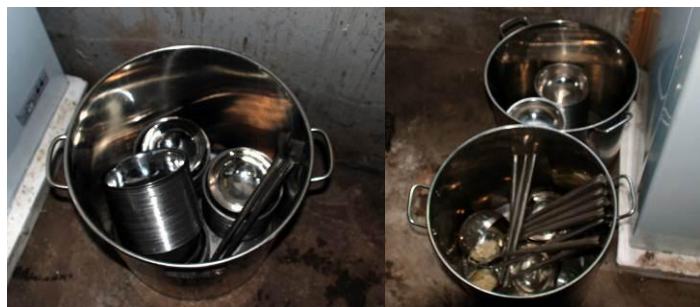
图 11 学校的消毒柜尚未启用, 不过学生的餐具存放得也还干净整齐。