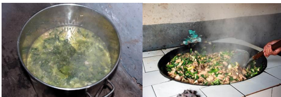
图 14 学生当天的午餐菜品，当天是周一，学校规定吃肉（周一和周三吃肉），蒜薹炒肉几乎都是肉，但平时都吃素。