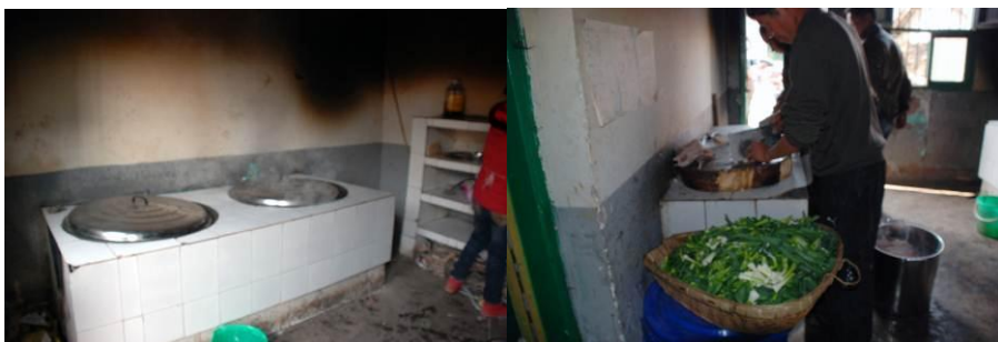
图 8 灶 台