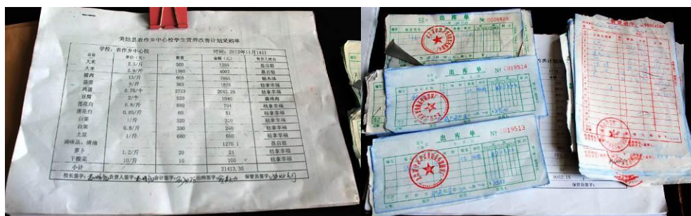
图 15 学校的帐目