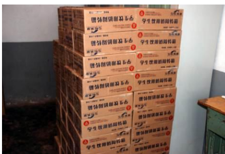
图 5 该校存放着学生奶, 校方称是发给还没有免费午餐的村小的