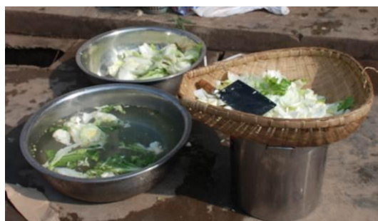
图 10 学校没有洗菜池, 洗菜在操场上进行