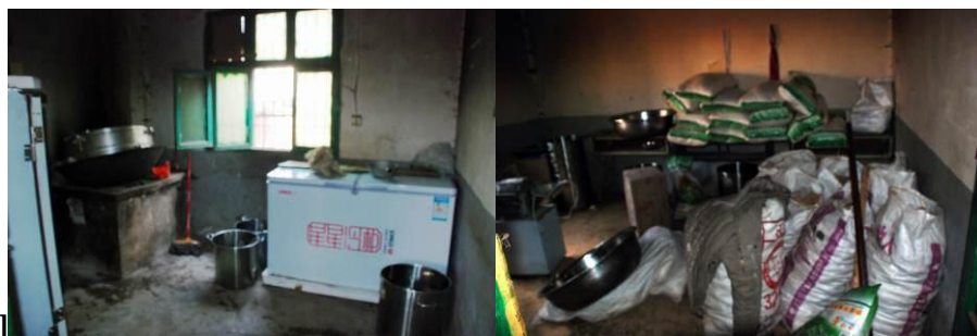
图 12 储物间还算清洁整齐