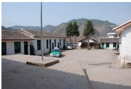
图 1 学校外观

农作乡中心小学是美姑县农作乡的乡中心校。全校有277名小学生,56名学前班儿童,共333人,学生和教师几乎都是彝族。该校从2012年10月中旬开始实行免费午餐之前,学生每天只吃两顿饭。学生全是走读生,来校路程最远的要走两个多小时。学校一般在上午10点才上课,下午4点放学。