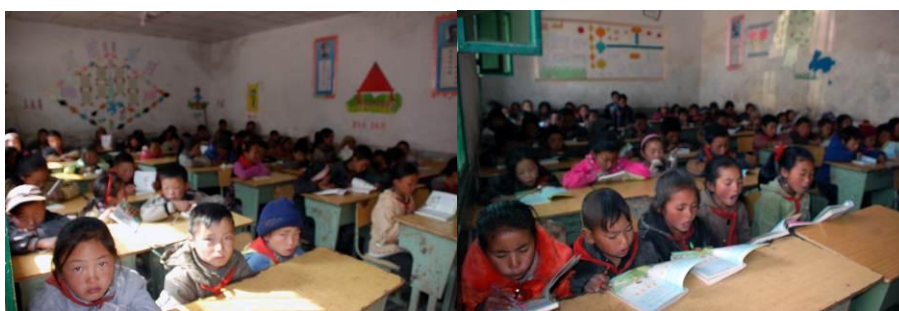
图 4 低年级学生人数众多, 只能容纳三、四十人的教室要坐五、六十人或更多, 孩子们挤在狭小的空间里学习, 有的教室都放不下老师的讲桌