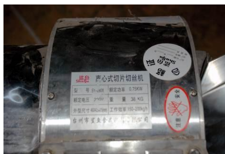
图 6 学校还不会使用的切丝机, 希望厨房捐的有些机器没有说明书, 学校厨师不会使用