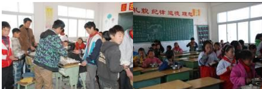
图 6 孩子们在排队打饭