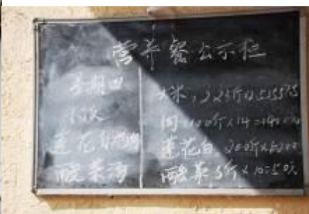
图 14 每天公示午餐种类和金额