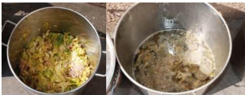
图 15 当天的菜品