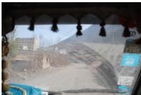
图 1 去基伟村小的途中

调查者于3月1日晚从长沙飞抵成都,宿双流大通商务酒店,2日从石羊客运站出发前往西昌,宿西昌惠安宾馆,3日从西昌汽车东站往美姑,宿免午美姑办公室。7日10点左右在美姑县城农村客运站坐车前往巴普镇基伟村小,10:30左右到学校。