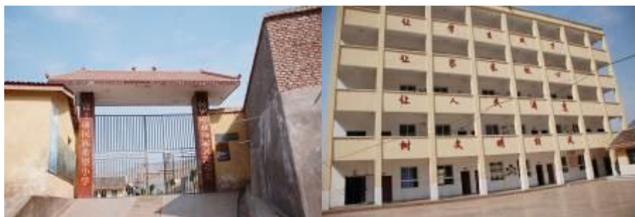
图 2 学校外观

巴普镇基伟村小是由富士康捐资兴建的希望小学，该校孩子们在 2012 年 11 月实行免费午餐之前一般每天只吃两顿，没有午餐吃。全校有 747 名小学生，分六个年级，十三个班，未开设学前班。老师 52 人，学生和老师绝大部分是彝族。学校有寄宿生 415 人，其他是走读生。