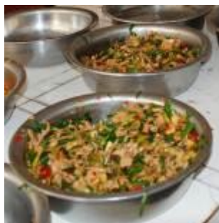
图 13 老师当天加菜

学校老师一般和学生同吃,但老师有时会加菜。校方领导向调查者发誓说这种加菜的现象极少。