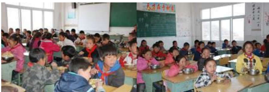
图 12 孩子们在教室用餐