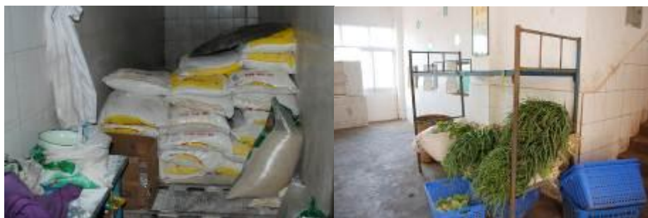
图 9 储物间