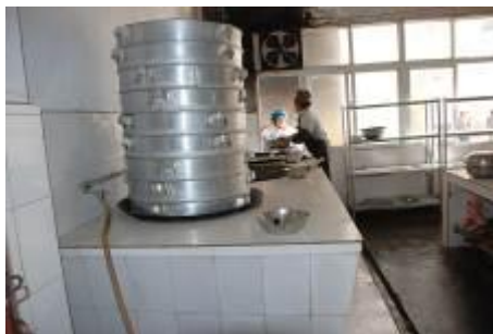
图 7 厨师都着工作服