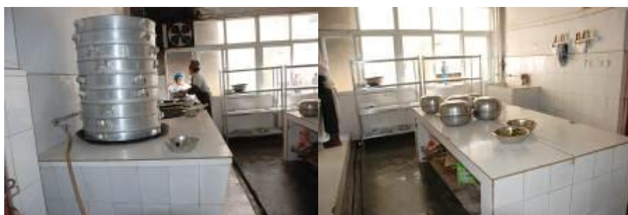
图 8 灶台和工作台