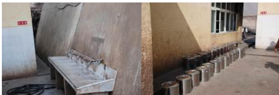
图 10 洗碗池