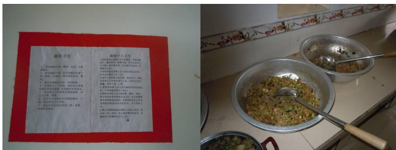
图八 厨房内张贴的卫生要求及当天孩子们打饭剩下的菜品 (左下角处即为蒜苗炒猪皮)

老师介绍说, 因为学生大多不吃猪肉皮, 所以学校每次给学生做菜时都将猪肉皮剥下后炒给老师吃。调查人员从这个细节可以看出, 学校在安排学生菜品时考虑还是比较周到。