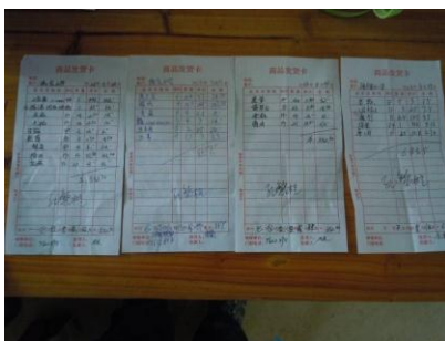
图十一 联华超市的送货清单

该校的日常食材统一从离学校 8 公里之外的平乐二塘镇联华超市定点采购。校长介绍,该校根据当日用餐计划,每日采购一次食材,大米、食用油等每周采购一次。调查人员通过对该校一周以来的采购支出进行分析,发现部分食材采购价偏高。据校长介绍,该校的免费午餐餐费一直由二塘镇中心校托管,故该校平时的食材均系赊购,每周同供应商结算一次,并由供应商开出正规税票之后向中心校财务室报账,由于开具税票会产生约 7% 的税费,供应商将税费加至食材采购价上,故部分菜品价格出现偏高的情况。校长同时告诉调查人员,该校正在向教育局申请独立对公账号,待批准后免费午餐的餐费拨款届时可直接拨到该校独立对公账号上,方能解决采购税费的问题。调查人员发现学校尚未与供应商签订供货协议。