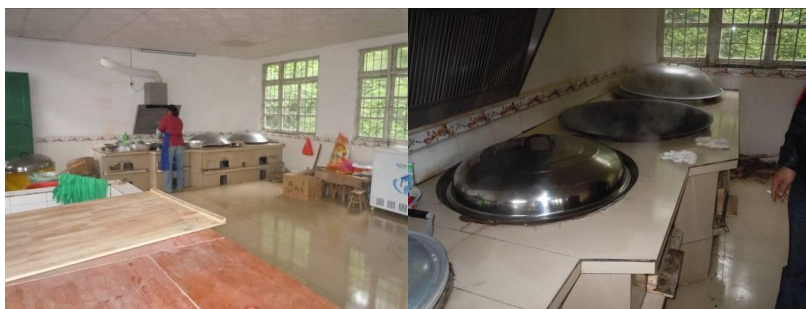
图六 厨房全景及灶台