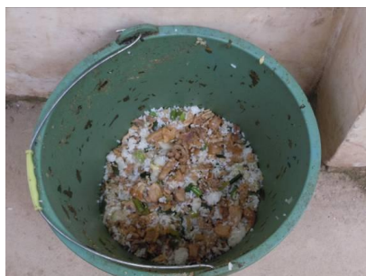
图十 当天午餐结束后可见的学生剩饭菜