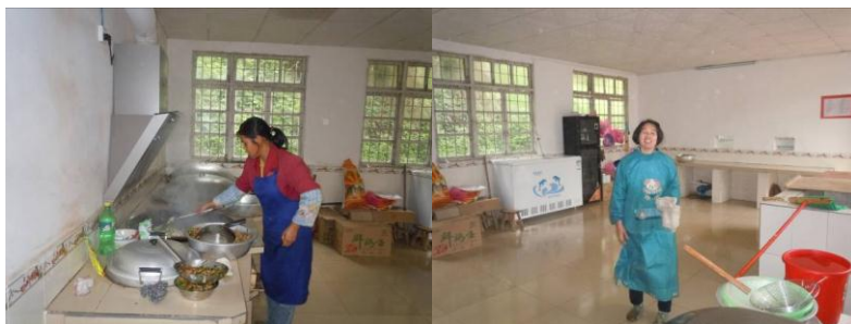
图四 现场见到的两位厨师大姐

调查人员当天在厨房见到厨师两名,均未着工作装,但系有围裙和袖套;头发较长的厨师未将头发束起盘好。两名厨师均有健康证,但未在厨房上墙公示。