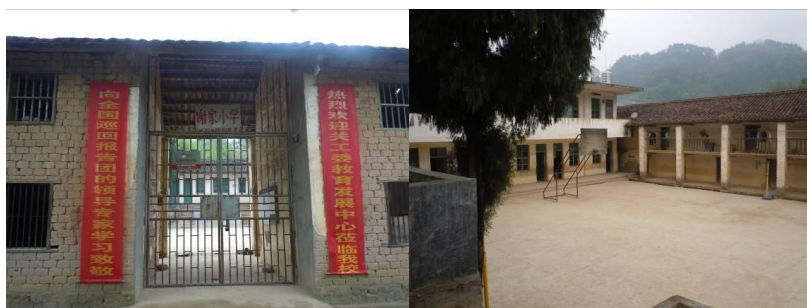
图二 谢家小学校门及校园内环境

谢家小学位于广西桂林市平乐县二塘镇谢家村，距离二塘镇约 8 公里，距离平乐县城约 35 公里。学校所在地属于山区，当地居民以种植柿子以及柿子加工作为主要经济来源，居民住家相对较分散，生活水平尚可。该校目前有 5 个教学班(包含 1 个学前班)，全校学生总人数 207 人，教职工 11 人，全校纳入免费午餐计划共计 218 人，自 2012 年 12 月启动并开餐。