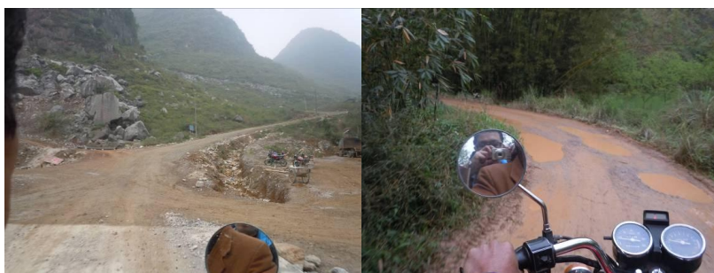
图一 前往谢家小学的乡村公路及调查人员所乘坐的摩托车

调查人员 2013 年 3 月 9 日乘火车到达桂林市。3 月 14 日, 调查人员结束对上一所学校的调查后在桂林阳朔葡萄镇乘坐过路车到达平乐二塘镇 (20 元), 入住二塘镇帝豪宾馆 (70 元)。3 月 15 日上午, 调查人员从二塘镇中学路口乘坐摩托车到达谢家小学 (20 元)。