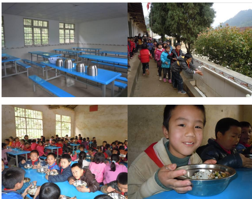
图七 餐厅全貌、排队洗手的孩子们以及就餐现场

学生餐具卫生状况良好,均经过消毒柜高温消毒。该校设有两个学生餐厅,高年级的学生在一个餐厅就餐,低年级的学生在另一个餐厅就餐。餐厅卫生条件良好,餐桌及板凳干净,地面未见明显垃圾。中午开餐时间到,同学们在老师带领下有序排队洗手,领取餐具,打饭,之后回到餐厅就餐,就餐过程秩序良好。