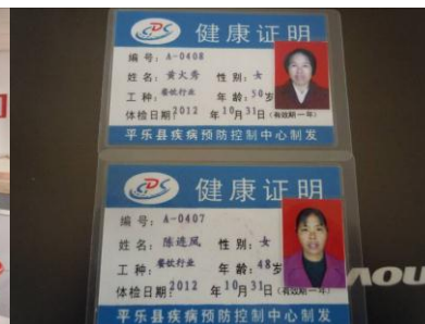
图五 两位厨师的健康证