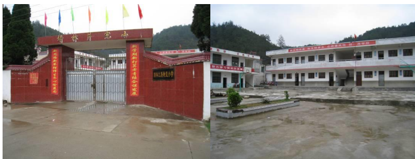
图 1 学校外景