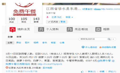
图 3 就餐人数的微博截图

调查人员算了一下当日就餐人数: 学生 121 人+厨工 2 人+老师 6 人+调查人员 1 人=125 人。与微博公示相符。