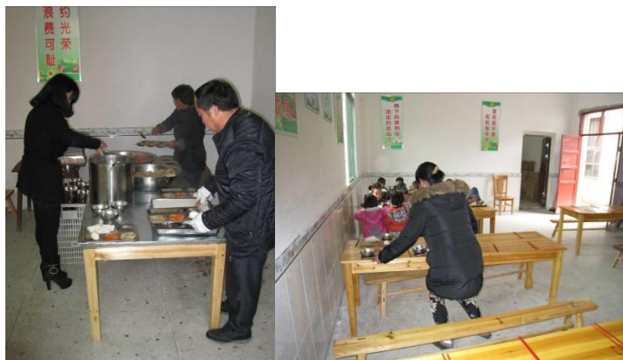
图 4 厨房图片组图

调查人员上午 11 点左右到达该校, 见到了该校的厨师正在备餐, 据调查者当日目测, 厨师自身穿着比较干净整洁, 但是都未穿工作服。