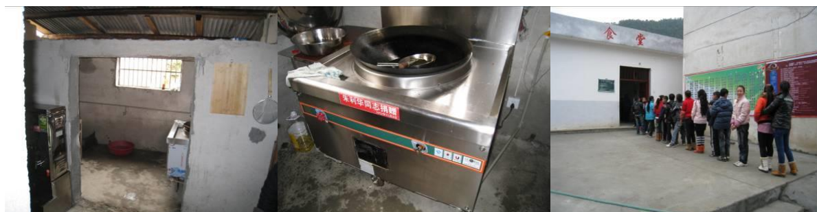
图 5 厨房图片组图