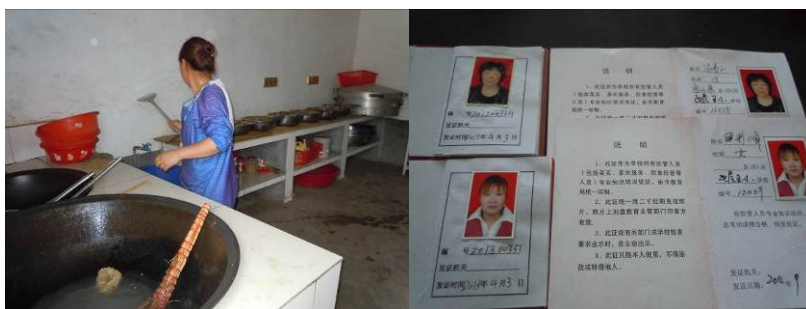
图四 调查人员现场见到的厨师及厨师健康证

调查人员当天现场见到厨师 2 名，女性，年龄约 40 岁，持健康证上岗。厨师未着工装，但有系围腰及袖套，目测厨师自身着装比较干净，操作也相对规范。