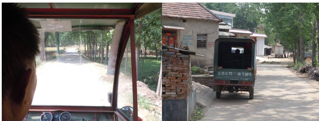
图一 前往刺坡岭小学的乡村公路及调查人员所乘坐的车辆

调查人员于5月16日上午从鲁山县新汽车站出发,乘坐前往瓦屋乡的中巴客车到达瓦屋乡(8元),在瓦屋乡集市对当地的蔬菜、肉类等价格行情做了简单了解后,换乘三轮摩托车前往刺坡岭小学(25元)。结束对该校的调查后,调查人员搭乘学校校长的面包车返回瓦屋乡,再换乘中巴客车回到鲁山县城(8元)。