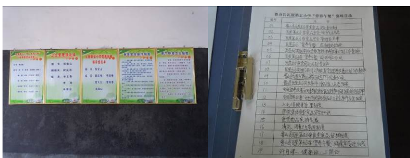
图七 相对完善的食品安全管理制度