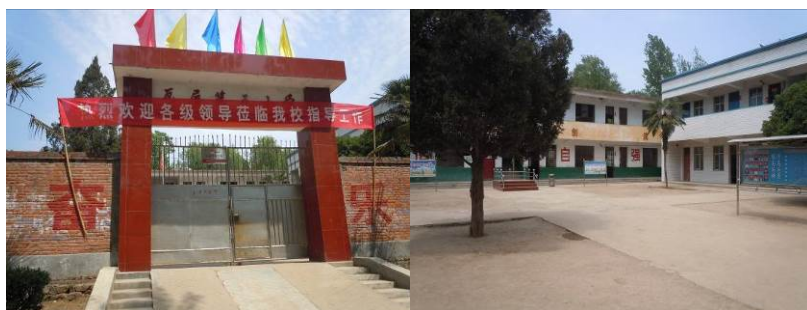
图二 刺坡岭小学大门及校园环境

需要说明是, 调查人员进校当天 (5 月 16 日), 正好碰上学校正在准备迎接河南省、市、县三级教育部门对该校营养餐执行情况进行检查, 学校提前获知消息, 午餐各项工作准备充分, 故调查人员当日对该校的突查情况仅供参考。