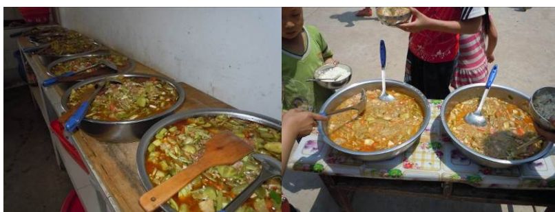
图八 学生当日菜品

该校当日的菜谱为：米饭、大杂烩菜（学校微博公示为炒菜）。当日同师生一同用餐，个人感觉菜品味道尚可。调查人员当天看到厨师加工烹调时是将所有的食材全部一锅烩，类似煮出来的感觉，调查人员认为，该校长期只有一个独菜的做法值商榷。