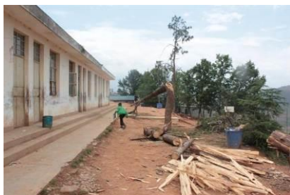
图 3 学校外景, 树是刮大风时吹断的

四川省凉山州西昌市川兴镇金新小学, 创办于 2003 年 8 月 20 日, 是一所义务教育阶段的民办小学。学校原只有几间老旧平房做教室和学生宿舍, 现在新修建了一间厨房及食堂和几间教室。调查人员到学校时厨房已修好还没投入使用, 教室打好了地基预计秋季学期可以使用。学校现有学生 499 人, 其中住校生 126 人, 住宿条件非常简陋。教职工 21 人, 其中老师 15 人 (3 人为支教老师), 保安 1 人, 厨师 5 人。