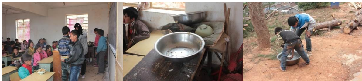
图 8 学生在教室分饭吃饭,秩序较好,当天学生饭菜吃得很干净 图 9 饭后学生在盆里洗碗

就餐时由学生会去厨房把饭菜端过来,并打来水洗手洗碗,但调查人员当天注意到有部分学生没有洗手。就餐时由学生在教室分饭,教室卫生一般,吃完后学生自己洗碗。餐具由学生自己拿回家用开水消毒,调查人员询问学生时表示有按要求消毒,校长说可能有同学会没消毒。