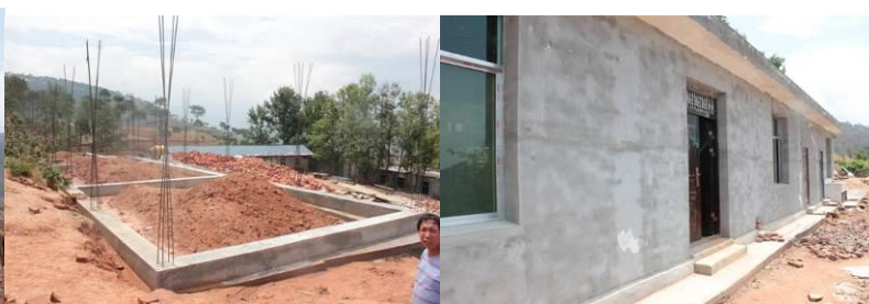
图 4 正在修的教室和刚修好的厨房