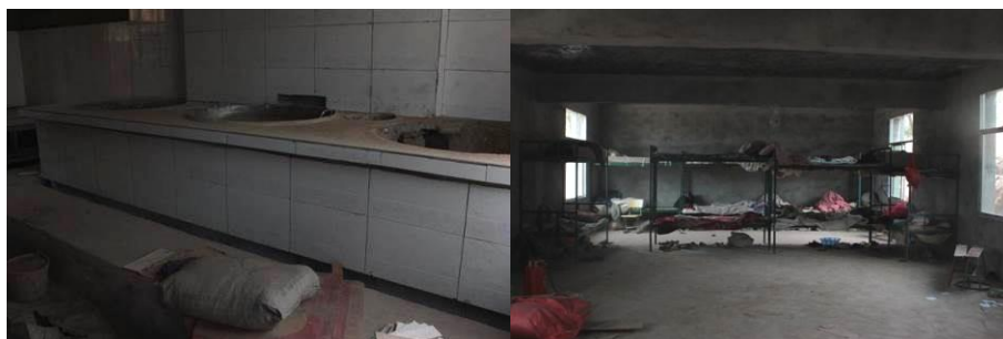
图 7 新厨房的灶台和餐厅,调查时餐厅被暂时作为学生宿舍