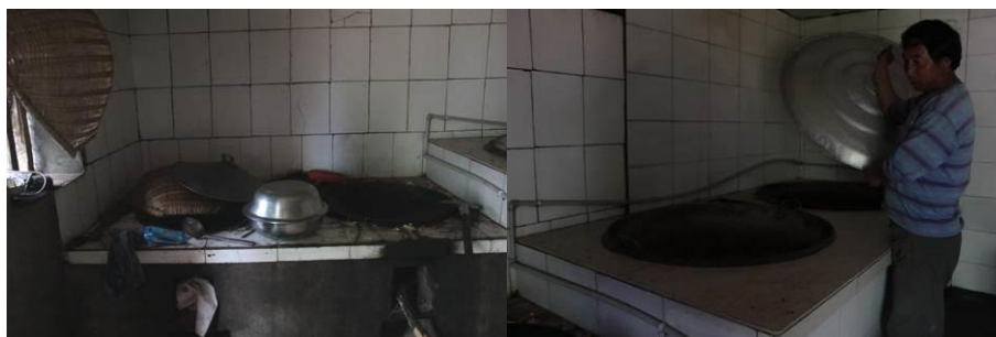
图 6 老厨房的工作台和灶台

学校的新厨房刚盖好还没投入使用,老厨房离厕所比较近苍蝇较多,卫生堪忧。调查人员了解到现在新厨房已经开始使用,卫生情况应该有所改善。