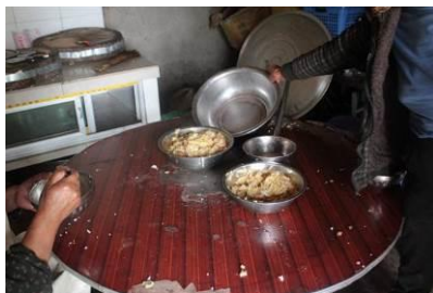
图 10 在厨房给老师留的菜

老师和学生吃的饭菜一样,一些教职工会在厨房先吃。当天调查人员在学校看到学校组织排队和制止浪费方面做得都比较好。