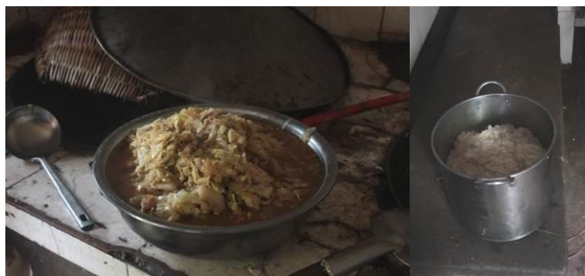
图 11 学生的饭菜

当天菜谱为莲花白炒肉和米饭,菜品单调,味道也一般。据校长说当天做饭的厨师技术比较差,平时做饭的味道会好一点,品种也会多一点。调查人员询问了部分学生,并查看了学校微博,证实了校长的说法。