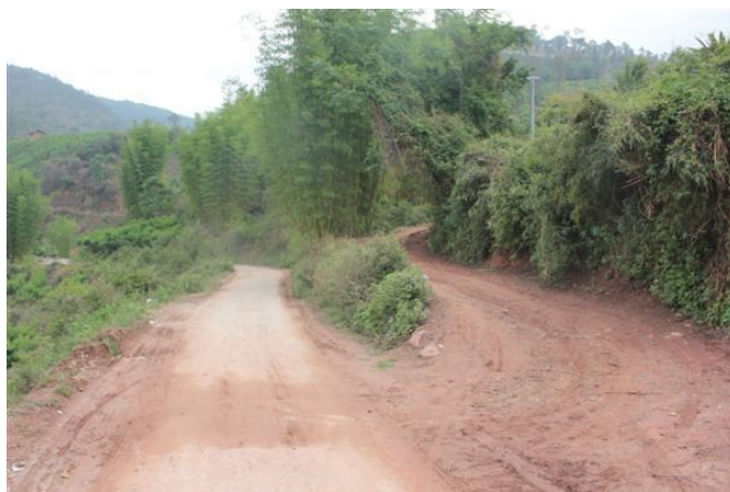
图 1 下出租车处 左边的水泥路是通向省道的村道, 沿右边土路步行 20 分钟到达学校

从学校出来后走回到水泥路上, 搭到一辆载客的三轮车回到川兴镇 (2 元), 乘坐公交车前往青年旅舍, 结束对金新小学的探访。