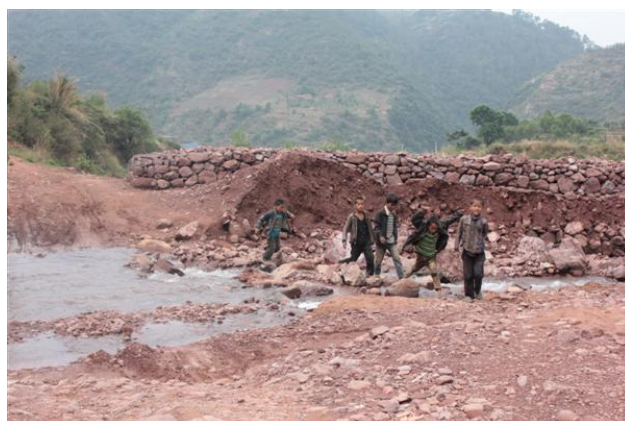
图 2 途中经过的溪流