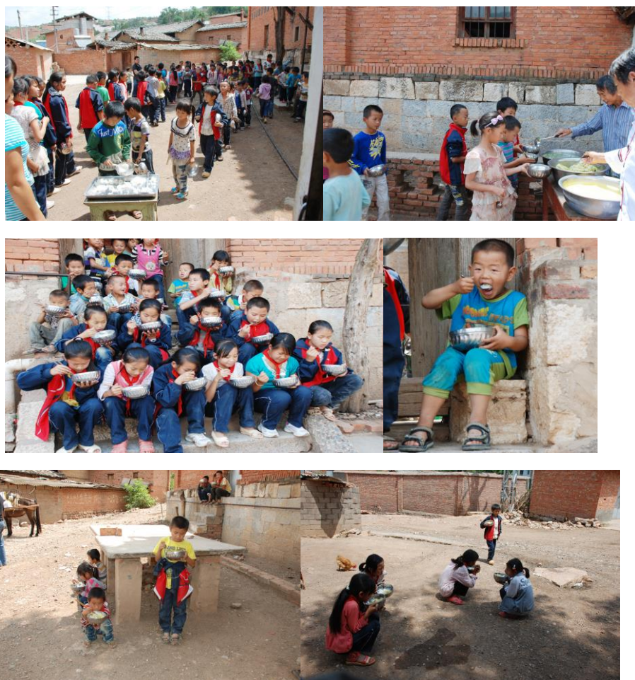
图 10 学校没有餐厅，孩子们就地而餐