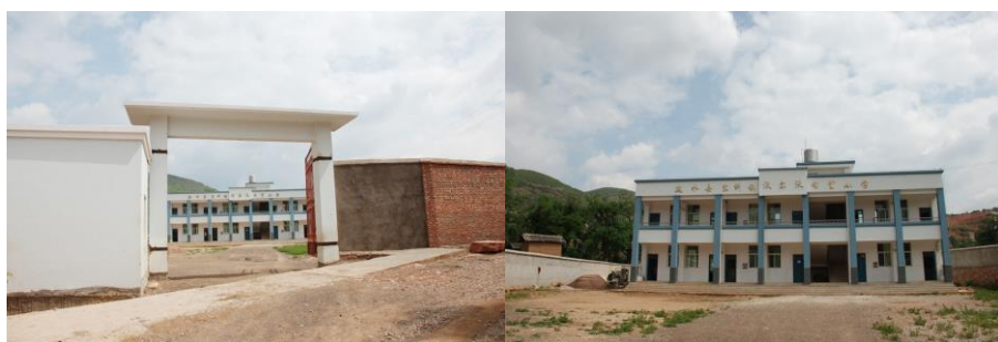
图 2 新校区学校外景