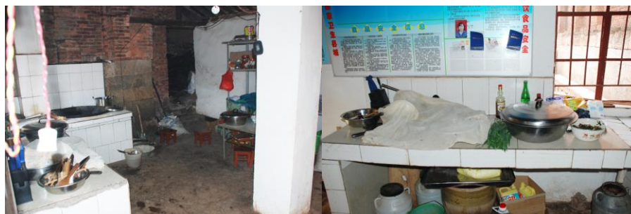
图 7 灶台和工作台

厨房里灶台和工作台卫生尚可，但稍显凌乱，地面因比较粗糙，不好拖地，所以不很干净。