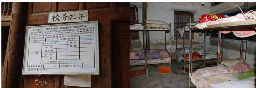
图 11 学校有每月总帐的公示