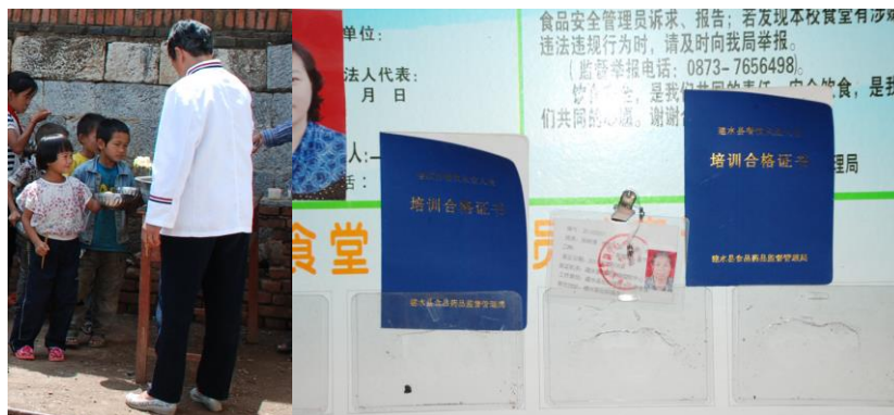
图 6 厨师个人卫生还好