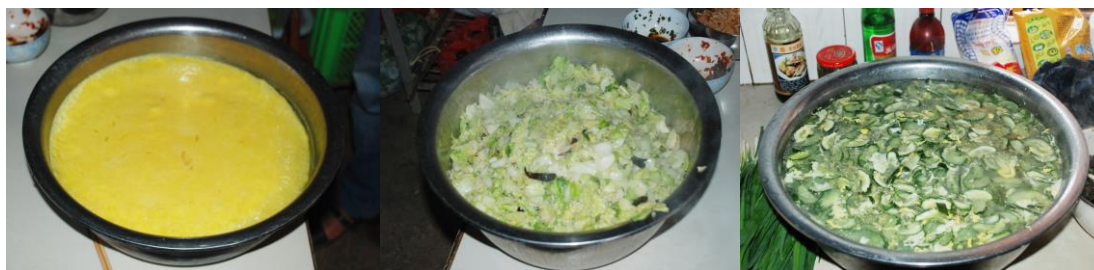
图 14 学生当天的午餐菜品