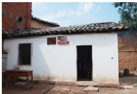
图 5 在老校区旁临时搭建的厨房