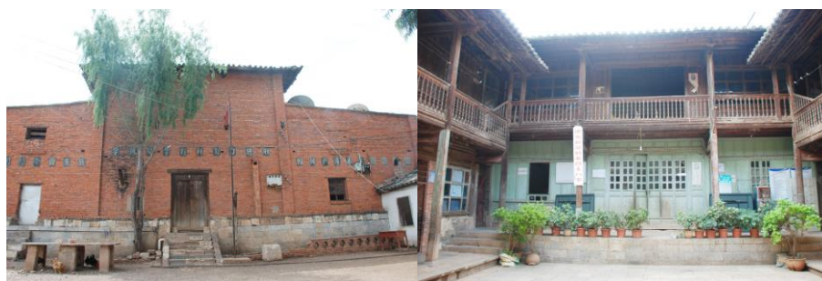
图 1 老校区,现在学生老师还在里住宿

白土小学是岔科乡白土村的村小。始建于 1922 年,新校区由沃尔沃(中国)有限公司捐资于 2011 年 12 月建成。学校分学前班和一至四年级五个班。有 87 名小学生,33 名学前班儿童。学生大部分寄宿。最远的学生要走三个多小时才能到校。