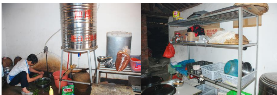
图 8 没有洗水池