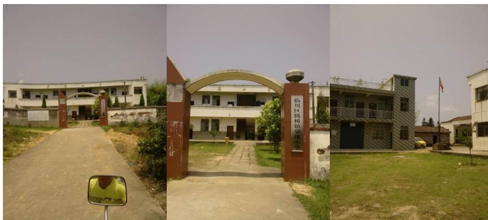
图 4 校园