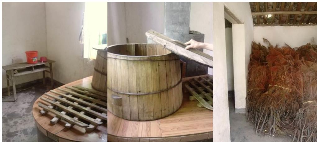
图 6 厨房

校长回应问题不大。据校长介绍,干柴是自己捡的,而厨师每月工资 700 元,由中心校承担。