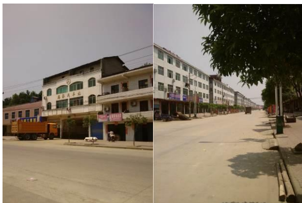
图 3 腾桥镇