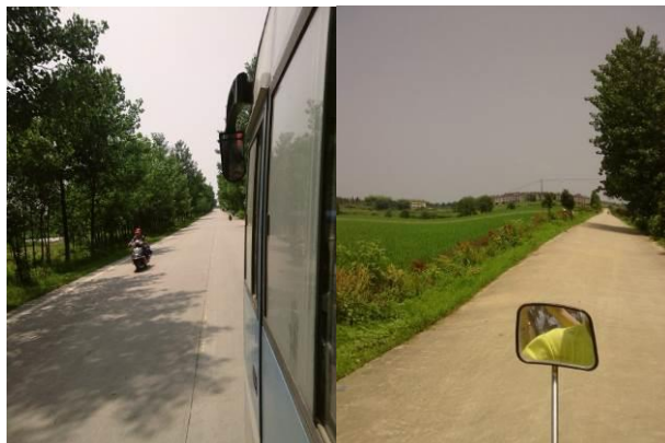
图 1 路况