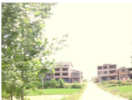
图 2 民居