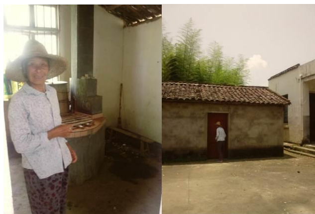
图 7 厨师