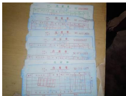
图九 部分原始单据

该校日常采购由上级中心校统一采购并配送至该校, 配送周期为 2 天一次, 采购价格与当地行情价格基本一致, 但调查人员发现当地的行情价格普遍较高, 如猪肉的采购价格一直在 15 元/ 斤左右, 较其他地区偏高 3 元左右。调查人员查看了该校的库存食材, 均较新鲜, 库存量基本正常。该校采购的原始单据保存不完整, 部分采购没有供应商凭证。