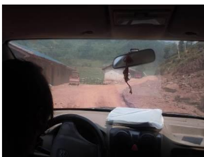
图一 乃拖乡至巴千村小学的路况

6月17日上午,调查人员自美姑县客运站乘坐前往侯播(乃拖乡)的客车到达乃拖乡,换乘面包车到达巴千村小学。结束对该校的调查后,调查人员再次乘坐面包车回到乃拖乡,换乘客车回到美姑县城。