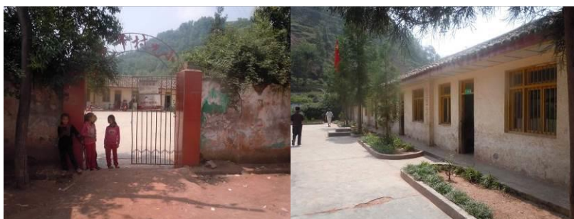
图二 巴千村小学大门及校园环境

巴千村小学位于四川省凉山彝族自治州东部的美姑县候播片区乃拖乡巴千村, 距离乃拖乡约 4 公里, 距离美姑县城约 46 公里。该校所在地为少数民族彝族聚居地区, 属于典型的山区, 当地居民生活水平低下, 主要以种植土豆、玉米、荞麦等基本农作物维持生活, 无其他经济收入来源。该校系国家营养改善计划覆盖学校, 现有 6 个教学班, 在校学生 212 人(均系彝族), 教职工 10 人, 全校纳入午餐计划共计 209 人, 自 2013 年 3 月起开餐。