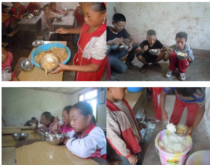
图六 就餐现场组图