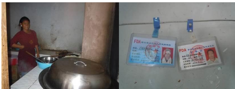
图四 其中一名炊事员及健康证

调查人员当天在厨房见到 2 名炊事员, 一男一女, 均持健康证上岗, 其中一人着工作围裙, 另一人未着装。调查人员目测厨师自身着装相对干净, 操作相对规范。