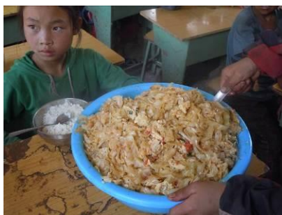
图八 学生当日菜品