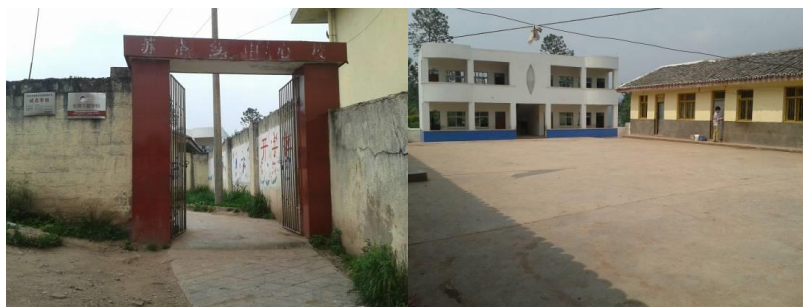
图二 学校大门及校园环境

苏洛乡中心校位于四川省凉山彝族自治州东部的美姑县苏洛乡, 距离美姑县城约 59 公里。该校位于半山腰, 所在地属彝族聚居地区, 当地居民生活水平极低, 除了种植玉米、土豆、荞麦等基本农作物维持生活外, 几乎无其他经济来源。苏洛乡中心校系国家营养改善计划覆盖学校, 全校共有 6 个年级, 7 个教学班, 在校学生 296 人 (均系彝族学生), 教职工 11 人, 全校纳入免费午餐计划共计 307 人, 其中免费午餐基金全额餐费拨款人数 11 人, 自 2013 年 3 月起正式开餐。