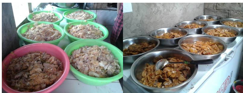
图八 学生当日菜品

学校当日的菜品为：米饭、土豆片炒肉、炒莲花白、青菜汤，菜品口感尚可，量足，学生餐后无明显浪费，但菜品在加工过程及成品出锅后卫生状况欠佳。