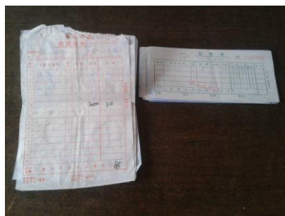
图十 采购原始凭证

该校实行定点采购，但采购周期不固定，采购价格与当地的行情基本一致，但调查人员发现，当地的猪肉及其他蔬菜价格行情普遍较高，如猪肉行情价一直在 15 元/斤左右。根据调查人员对今日出库食材的观察，食材均较新鲜。调查人员在现场见到了食材采购相关凭证，保存完整，但部分凭证无经手人签字。调查人员到校当天因该校上一次采购食材刚好消耗完，故没能查看到食材库存，但查看了大米及食用油、鸡蛋等库存，根据账目记录情况基本正常。