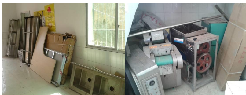
图十二 存放于卫生院楼道的“希望厨房”设备

调查人员认为, 该片区包括该校在内的 3 所中心校在申请免费午餐基金支持的同时向其他组织机构重复申请厨房配套的做法应引起免费午餐基金重视。