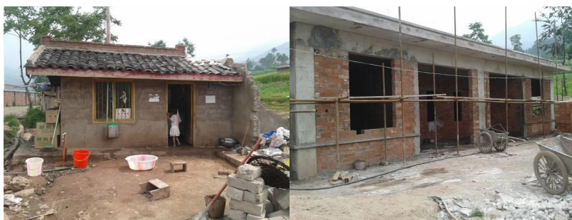
图五 现有厨房外景及新厨房外景

该校厨房位于校园外面,为临时用房,面积狭窄,不足 10 平方,厨房环境卫生状况较差,物品摆放凌乱,消毒柜、冰箱的卫生状况令人堪忧。校长介绍,该校新建的厨房主体结构已完工,将在下学期开学前验收并投入使用。