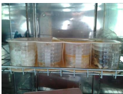
图七 位于厨房消毒柜内的食品留样盒(里面的菜品已变质腐败)

该校对午餐相关工作相对比较重视,建立了相应的制度规范午餐运行,但制度落实和执行方面明显欠缺。在该校厨房,调查人员看到有用于食品留样的取样盒,令调查人员不解的是食品留样盒被放置在没有冷藏效果的消毒柜内,且容器内的食物已经变质腐败。调查人员详细向校方及厨师介绍了食品留样工作的重要性及操作要求,校长表示将立即做好该项工作。开餐前,校长亲自试餐,各班老师积极组织学生分餐并现场监督用餐。该校严格执行了师生同餐要求,日常用餐与学生完全一致。