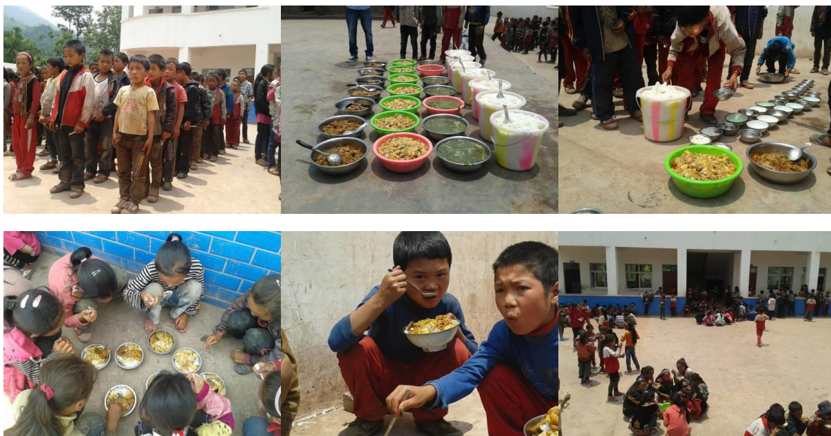
图六 就餐现场组图