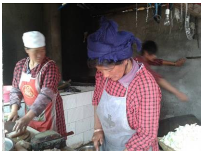
图四 现场见到的炊事员(健康证佩戴在胸前,其中一人无健康证)

调查人员现场见到三名炊事员,均着工作围裙上岗,其中两人持健康证,一人健康证据称正在办理中。目测炊事员个人卫生尚可,未见明显不规范操作。