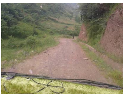
图一 前往苏洛乡中心校的路况(返程方向)

6月18日早上,调查人员从美姑县城乘坐客运面包车到达牛牛坝乡,再转乘过路面包车到达乃拖乡,因乃拖乡至苏洛乡平时很少有车上去,调查人员遂包车前往学校。该校位于半山腰,自乃拖乡至苏洛乡为泥石路,路况相对较差。结束对该校调查后,调查人员再次包车返回牛牛坝乡,转乘客车回到美姑县城。