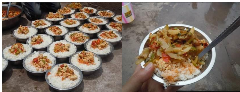
图八 学生当日菜品

学校当日的菜品为:米饭、炒土豆丝,番茄炒蛋,菜品口感尚可,量足,但部分学生餐后浪费明显。据调查人员观察及与个别学生交谈了解到,造成部分学生浪费明显的原因主要是老师在分餐时未根据孩子的实际情况分餐,而是统一分的一样多,造成部分年龄较小的孩子吃不完。该校日常菜谱安排为每周两次肉(周二及周四),两次鸡蛋(周一及周五),一次全素菜(周三),菜谱安排合理。