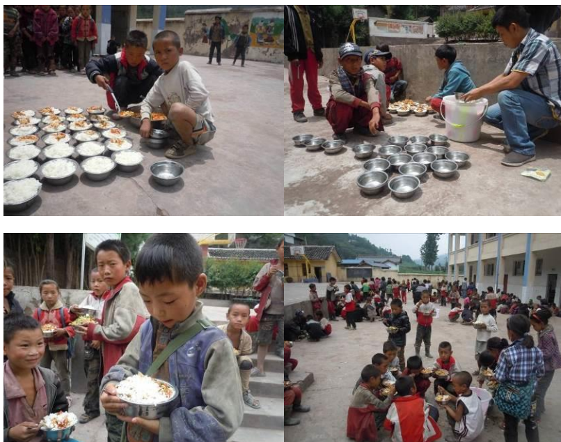
图六 就餐现场组图

该校未执行餐前洗手,学生餐具部分放置在厨房未通电的消毒柜内,部分放置在教师寝室,未消毒;开餐前分餐及就餐均在操场进行,秩序尚可,餐后学生自行清洗餐具并放回原处。