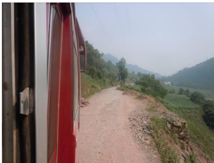
图一 牛牛坝乡至采红乡的路况

6月21日上午,调查人员自美姑县城出发,乘坐客运面包车到达牛牛坝乡,因时间较早,遂徒步约两小时后搭乘过路面包车走了一段,再搭乘到一辆过路私车到达采红乡中心校。因该校当日放假,调查人员6月24日再次乘车前往该校,全程约1小时。结束对该校的调查后,调查人员乘坐候播至美姑县城的客运班车返回美姑县城。