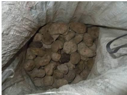
图十 库存已霉变的土豆

该校实行定点采购, 采购周期为 2 天一次, 采购价格与当地的行情基本一致, 但调查人员发现, 当地的猪肉及其他蔬菜价格行情普遍较高。根据调查人员对今日出库食材的观察, 食材均较新鲜。调查人员现场未见到相关采购凭证, 已现场建议学校日常采购必须坚持索取凭证。调查人员现场查看了该校库存, 发现其中一个口袋里的土豆为陈年土豆, 已霉变, 大约 30 斤, 调查人员详细询问了该校负责采购的老师, 老师称系不久前该校一学生从家里带来卖给学校, 厨师称尚未将该袋土豆用于日常食材。其余食材库存正常。