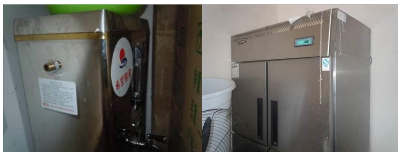
图十二 “希望厨房”配送设备

调查人员认为, 该片区包括该校在内的 3 所中心校在申请免费午餐基金支持的同时向其他组织机构重复申请厨房配套的做法应引起免费午餐基金重视。