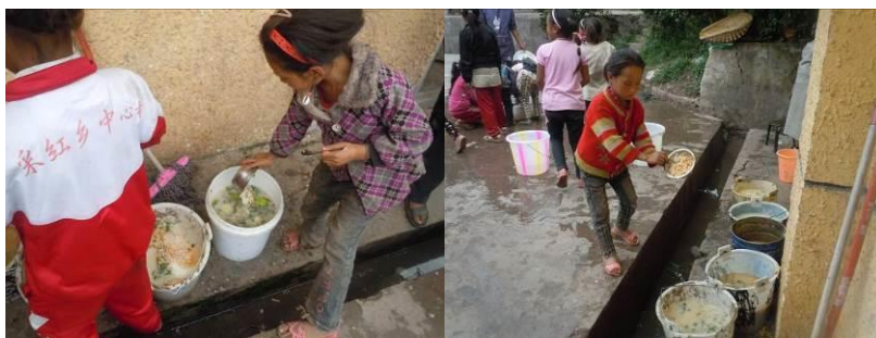
图九 正在往泔水桶倾倒剩饭菜的孩子