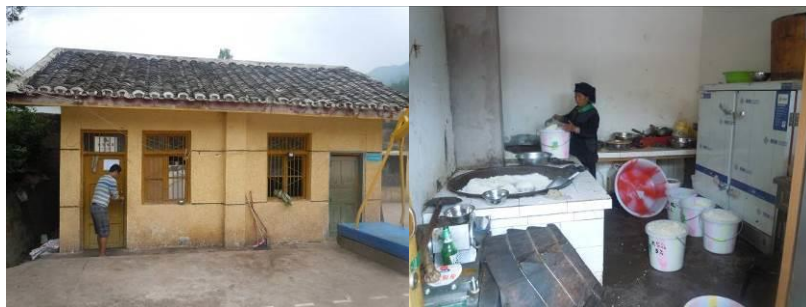
图五 厨房外景及厨房内情况

该校厨房为临时用房,面积较窄,不足 10 平方,厨房环境卫生状况欠佳,物品摆放凌乱。校长介绍,该校最迟将在下学期启动新厨房的建设。