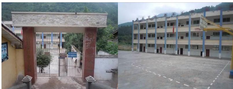
图二 学校大门及校园环境

采红乡中心校位于四川省凉山彝族自治州东部的美姑县采红乡, 距离美姑县城约 35 公里。该校所在地属彝族聚居地区, 当地居民生活水平极低, 除了种植玉米、土豆、荞麦等农作物外, 几乎无其他经济来源。采红乡中心校系国家营养改善计划覆盖学校, 全校共有 6 个年级, 7 个教学班, 在校学生 289 人 (均系彝族学生), 教职工 12 人, 全校纳入免费午餐计划共计 301 人, 其中免费午餐基金全额餐费拨款人数 12 人。该校自 2013 年 3 月起正式开餐。