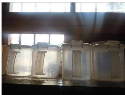
图七 空着的食品留样容器

该校对午餐相关工作相对比较重视,建立了相应的制度规范午餐运行,但制度落实和执行方面相对欠缺。在该校厨房,调查人员看到有用于食品留样的取样容器,但卫生状况不佳,也未见到留样食品,更无相关记录表。调查人员详细向校方及厨师介绍了食品留样工作的重要性及操作要求,校长表示将立即做好该项工作。该校严格执行了师生同餐要求,日常用餐与学生完全一致。