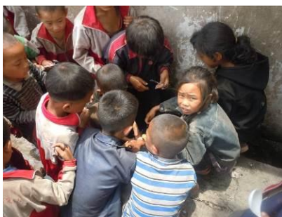
图六 簇拥着一个水龙头洗手的孩子们

堆在墙角。就餐前,调查人员现场提出学生餐具的卫生问题,两名炊事员才在校长的指挥下为孩子们重新清洗餐具,调查人员大胆推测,该校学生餐具的日常卫生状况令人担忧。