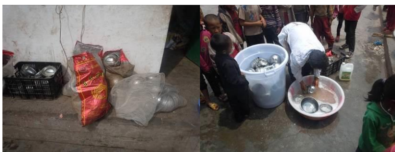
图七 该校餐具的存放环境