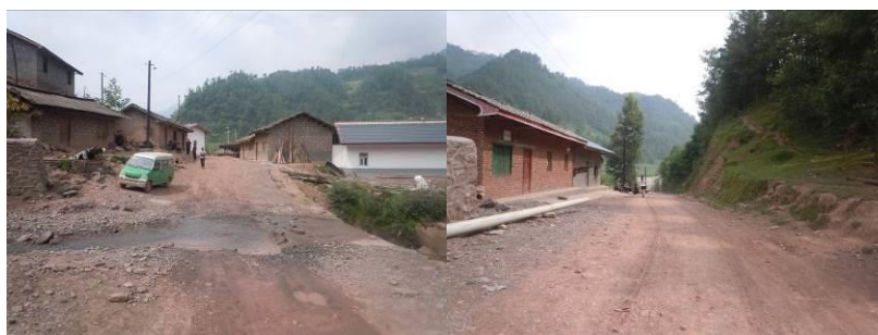
图一 乃拖乡至板诺洛村小学的路况

6月18日,调查人员自美姑县城乘坐客运面包车经牛牛坝乡转车到达乃拖乡,因时间较早,调查人员遂徒步前往板诺洛村小学,徒步约一半左右搭乘到一辆面包车到达该校。结束对该校的调查后,调查人员乘坐过路面包车直达美姑县城。