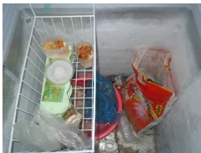
图九 日常菜品留样

该校各项食品安全管理制度基本都有,但落实和执行比较欠缺。调查人员在学校储藏室冰柜见到了该校的日常食品留样和记录表,但食品取样均被混合放在一起,留样记录表登记也不规范。该校严格执行了师生同餐制度,学校全体教师在学生就餐前提前就餐,饭菜与学生餐完全一致。