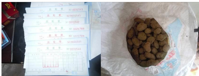
图十一 部分原始采购凭证及储藏室口袋里的陈年土豆