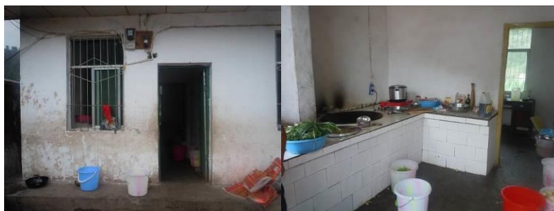
图五 厨房外景及内部情况

该校厨房面积不大, 环境卫生欠佳, 厨房物品摆放凌乱。调查人员发现该校厨房及周边苍蝇异常的多, 校长称这个他们也没有办法避免, 想了很多办法都没法有效控制, 调查人员向校方建议务必加强厨房环境卫生管理, 该校紧挨河边, 用水相对方便, 建议夏天多冲洗厨房地面, 或者配置灭蝇灯, 校方承诺会想办法改善厨房及周边环境卫生条件。