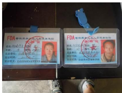
图四 炊事员健康证