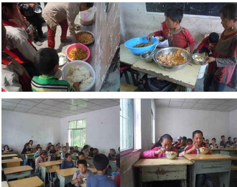
图十 当天的学生菜品及就餐现场情况

该校当日的菜谱为: 米饭、炒土豆片、莲花白豆腐混合炒、白菜汤, 学校微博当日未公示菜谱。调查人员当日同孩子们一起用餐, 自我感觉口味一般, 但分量充足, 孩子们餐后未见明显浪费。