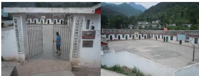
图二 板诺洛村小学大门及校园环境

板诺洛村小学位于四川省凉山彝族自治州东部的美姑县乃拖乡板诺洛村,距离乃拖乡约 6 公里,距离美姑县城约 48 公里。学校位置所在的板诺洛村据称系“全国新农村建设示范村”,但调查人员观察,除了村里的房屋外观看上去比较漂亮外,各村民家里的情况及生活条件仍不容乐观。当地居民生活水平较低,主要以种植玉米、土豆、荞麦等基本农作物维持生活,无其他经济来源。该校属国家营养改善计划覆盖学校,现有 6 个教学班,在校学生 252 人(均系彝族),教职工 9 人,全校纳入免费午餐计划共计 262 人,自 2012 年 12 月起接受免费午餐基金资助并顺利开餐。