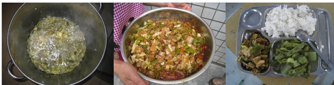
图5 该校当日午餐菜品