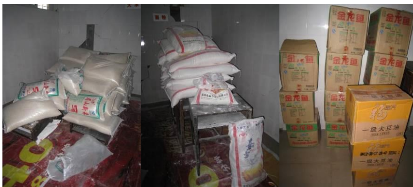
图3 该校厨房的食材存贮情况