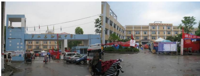
图1 学校外景和内景

芦山县初级中学是该县的12所初中之一,位于旧县城的城北。该校现有三个年级29个班,在册学生1401人,其中住校生636人;教职员工110人,食堂工作人员17人。地震后,该校于5月6日开始复课,免费午餐于5月13日在该校正式开餐。