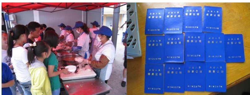
图 2 厨师及其健康证

调查人员达到 12 时达到该校,该校已经开餐,经观察,厨师着工服,且较干净。后查看了该校现厨师的健康证。