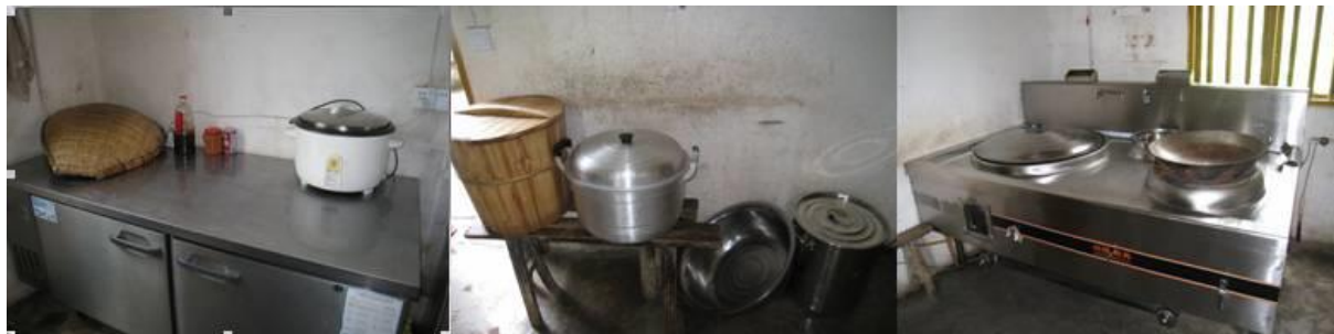
图 4 厨房组图

调查人员到校后, 查看了该校厨房, 均发现厨房卫生、和灶台都很干净, 但是厨房隔壁的储物间, 整洁程度有待改善。