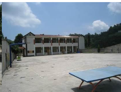
图 2 学校内景