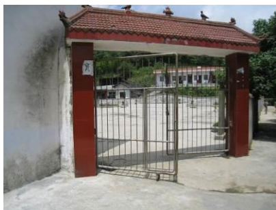
图 1 学校外景

兴文县隶属于四川省宜宾市, 位于宜宾市区东偏南方向 110 公里左右, 道路为省道, 车程约 2 小时。兴文县石海镇红鱼村的红军小学是文家村小学的主管学校, 红鱼村位于兴文县城到石海国家地质公园景区的必经之路, 也是最近距离到达文家村的中转站。红鱼村到文家村的水泥路(约 11 公里)现正在修建, 但多数路段还未完工, 路况较差, 尤其是雨后。该校现有学前班 1 个, 22 人; 小学班级 3 个, 学生 99 人, 教师 3 人。