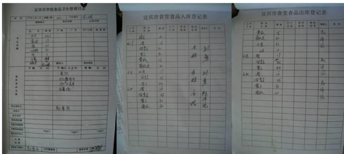
图 6 账目组图