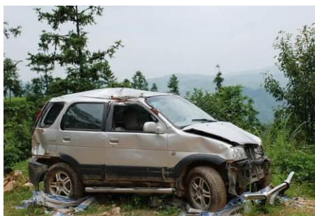
图 2 开车去鱼寨的下场

鱼寨小学属三棵镇南高村鱼寨组, 全组有 120 户, 508 人, 座落于凯里市巴拉河下游与台江县交界的大山顶上, 海拔 1280 米, 是凯里市最边远的苗寨小学, 地处偏僻, 交通闭塞。学校始建于 1965 年, 新建的水泥操场及两个新的篮球筐, 由香港慈福基金会捐建。从三棵镇到鱼寨小学坐摩托车约 1 个多小时。该校是座完小, 但因缺少教室和老师只能隔年招生。现在学校有一年级、三年级、五年级三个班。有 54 名小学生。学生全部都是走读生。最远的学生家离校约三公里路。2012 年, 7 月免费午餐进驻该校, 之前学生一般都回家吃饭, 较远的带饭在学校来吃。