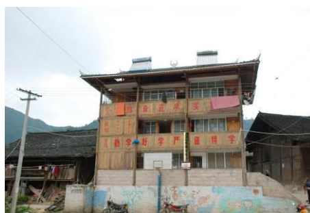
图 3 巍然屹立的鱼寨小学

鱼寨小学属三棵镇南高村鱼寨组, 全组有 120 户, 508 人, 座落于凯里市巴拉河下游与台江县交界的大山顶上, 海拔 1280 米, 是凯里市最边远的苗寨小学, 地处偏僻, 交通闭塞。学校始建于 1965 年, 新建的水泥操场及两个新的篮球筐, 由香港慈福基金会捐建。从三棵镇到鱼寨小学坐摩托车约 1 个多小时。该校是座完小, 但因缺少教室和老师只能隔年招生。现在学校有一年级、三年级、五年级三个班。有 54 名小学生。学生全部都是走读生。最远的学生家离校约三公里路。2012 年, 7 月免费午餐进驻该校, 之前学生一般都回家吃饭, 较远的带饭在学校来吃。