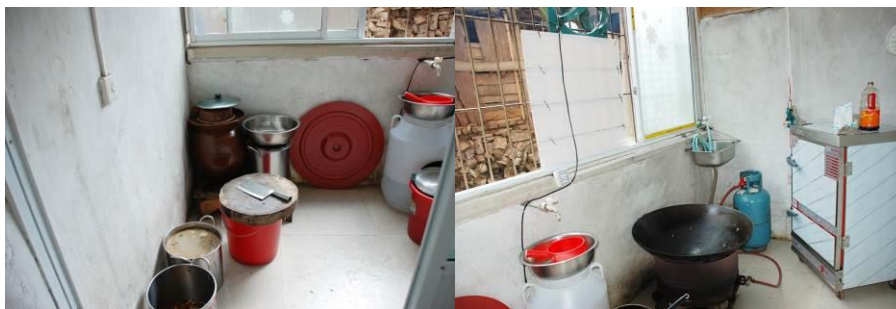
图 6 厨房