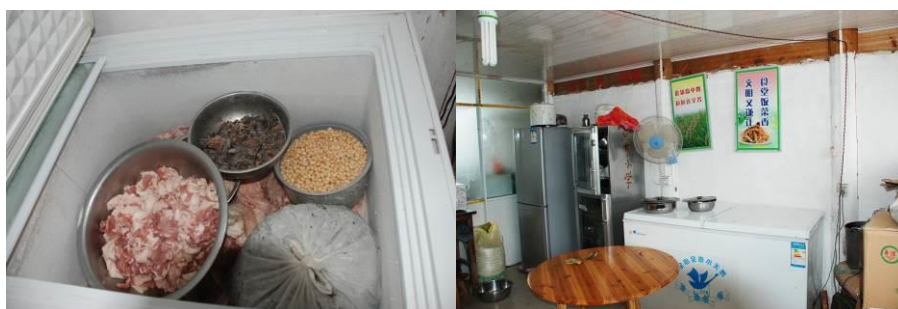
图 7 冰柜内有股臭味, 校方称头天停电了 图 8 消毒柜成了碗柜, 没插电