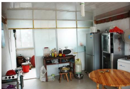
图 10 厨房偏小