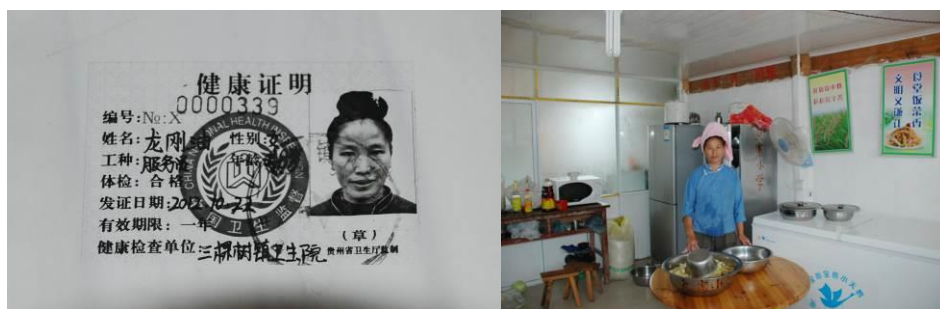
图 5 厨师个人卫生还好