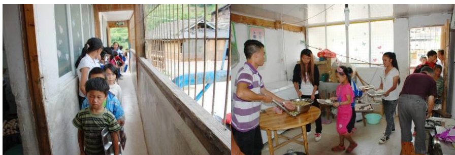
图 9 孩子们在排队打饭