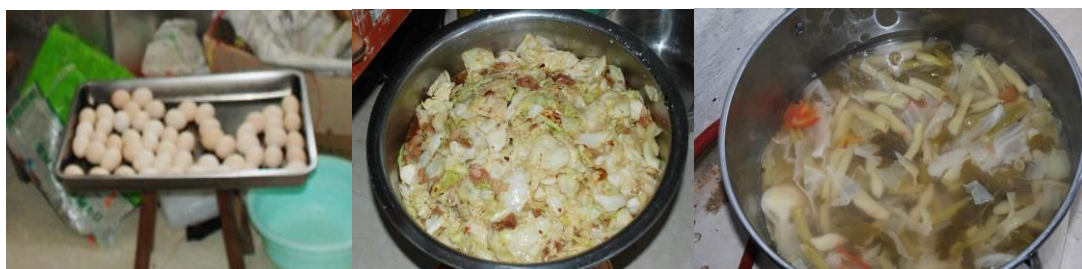
图 11 学生当天的午餐菜品