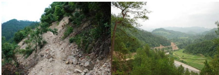
图 1 去学校的唯一一条道路遭多处山体滑坡掩埋