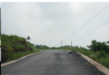
图 2 去往学校的路, 修好不到半年就烂了