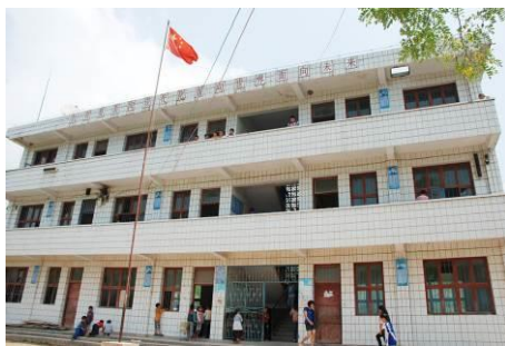
图 5 翁板小学教学楼