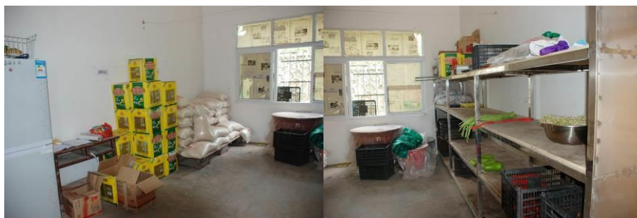
图 11 储藏室井井有条