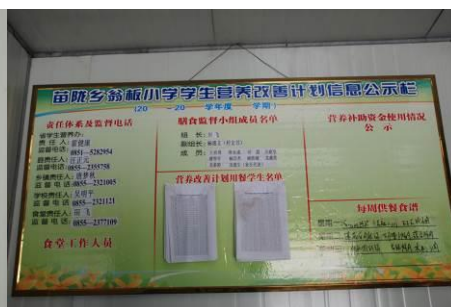
图 18 学校对午餐有公示