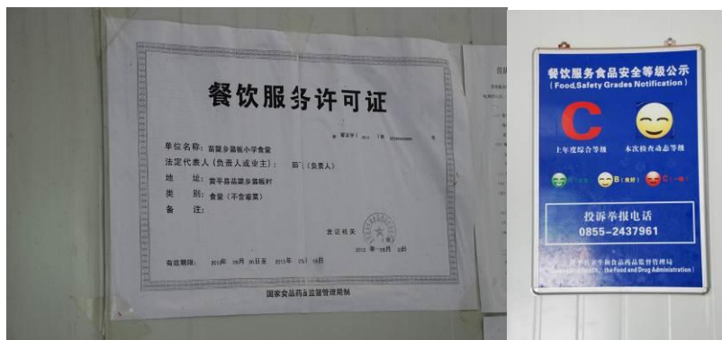
图 7 学校的餐饮许可证及餐饮等级