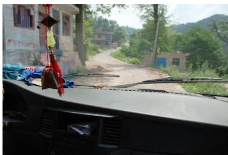
图 1 去往翁板小学的路上

调查者 6 月 27 日完成对凯里市格河小学的调查后马不停蹄的赶往凯里市再从凯里市赶到黄平县, 然后又从县城赶至离苗陇乡不远且有住宿地方的谷陇镇。28 日上午 9 点左右从旅馆附近坐上去苗陇乡翁板小学的小巴, 却等到 10: 30 才好不容易坐满客开车。约 11: 15 左右到达翁板小学。