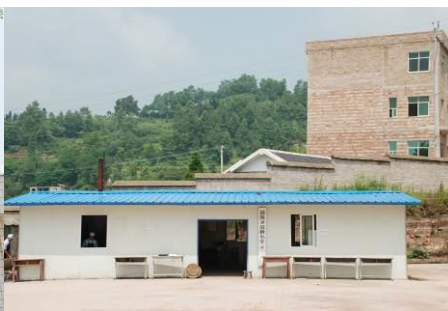
图 6 翁板小学食堂