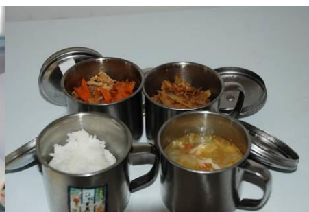
图 16 菜品有留样