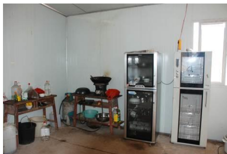
图 14 老师有个小灶, 偶尔加个菜