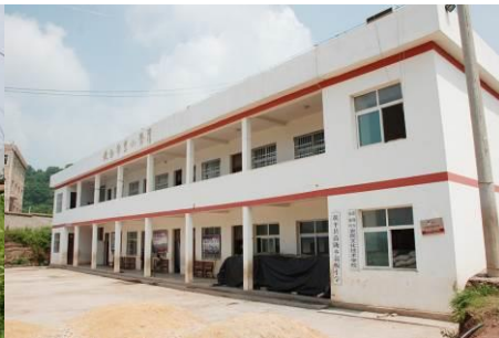
图 4 翁板小学办公楼