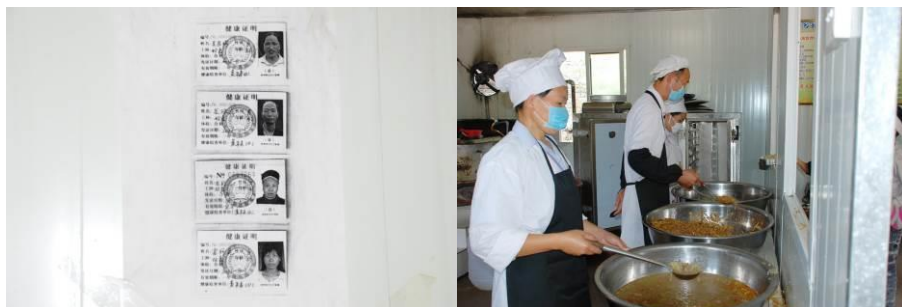
图 8 厨师个人卫生状况还好