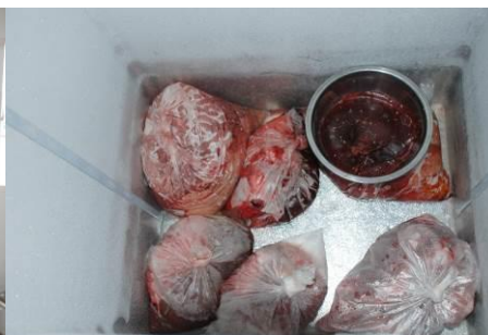
图 15 冰柜里整洁干净