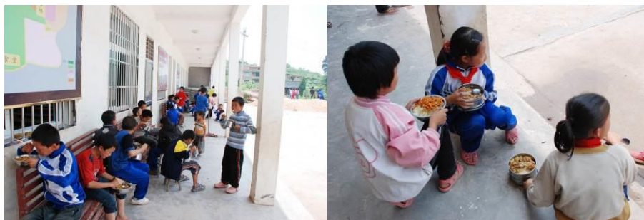
图 13 学校没有学生餐厅, 孩子们在过道、操场或教室用餐