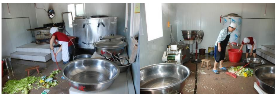
图 9 厨师正在打扫卫生