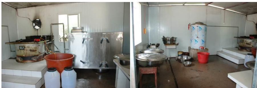
图 10 厨房卫生还行