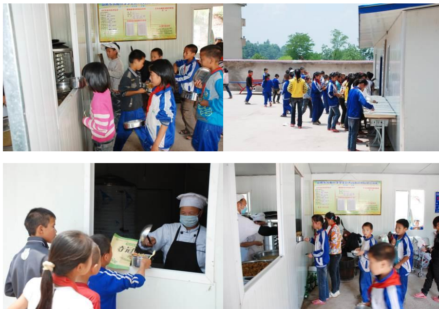
图 12 因学生人数多，学生自己打饭，分两个窗口在排队打菜