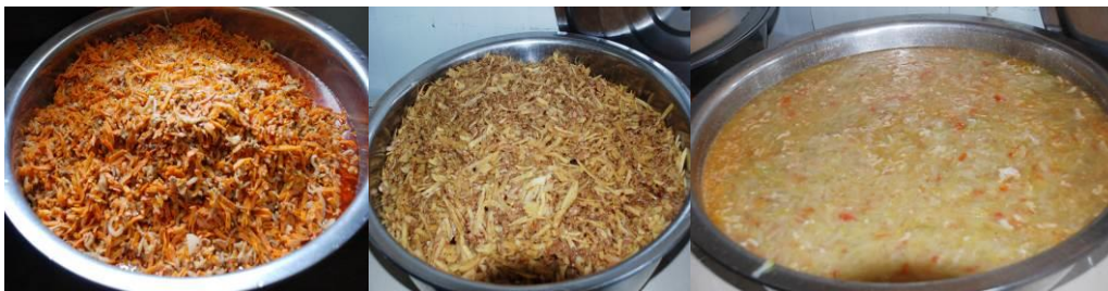
图 19 学生当天的午餐菜品