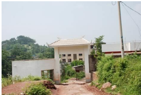
图 3 翁板小学外景

翁板小学属苗陇乡翁板村。从谷陇镇到翁板小学约 16 公里。该校是座完小。现在学校有学前班、一年级至六年级九个班。有学前班儿童 91 人,有 503 名小学生。学生都是走读生,且全部为苗族。且绝大部分来从苗陇乡。2012 年 10 月 6 日免费午餐进驻该校。