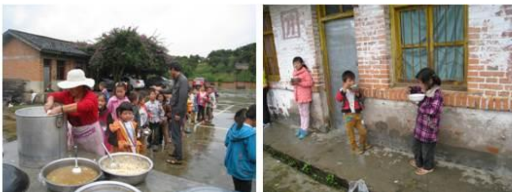
图5 学生排队盛饭、用餐组图