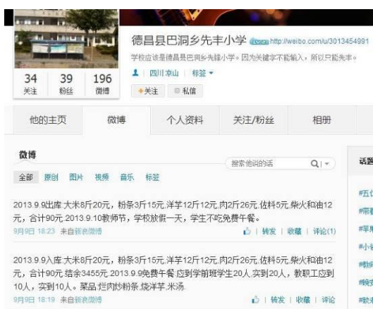
图 3 就餐人数的微博截图

调查人员算了一下当日就餐人数: 学生 107 人+厨师 1 人+老师 9 人=117 人。与该校微博公示内容一致。