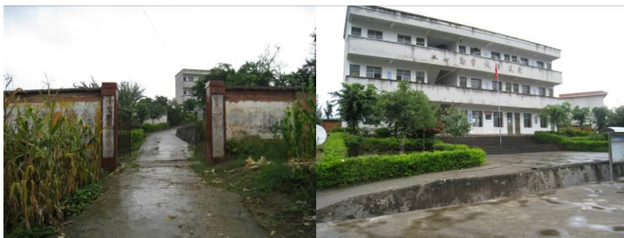
图 1 学校外景

先锋小学属于四川省凉山州德昌县巴洞乡, 德昌县位于凉山州市府所在地西昌南约 70 公里, 先锋小学所在的巴洞乡先锋村位于德昌县城南约 9 公里。西昌到德昌有高速和国道分别相通, 班车一般选择国道, 车程约 90 分钟; 德昌县城到先锋村为县乡公里, 路况一般。先锋小学位于该县乡公路旁。该校现有小学教学班 7 个, 共 88 人; 学前班 1 个, 共 20 人。该校现有教师 9 人。该校的学前班学生和教师、厨师的餐费, 以及厨师的工资由免费午餐基金会提供。小学生的餐费由国家营养改善计划提供。