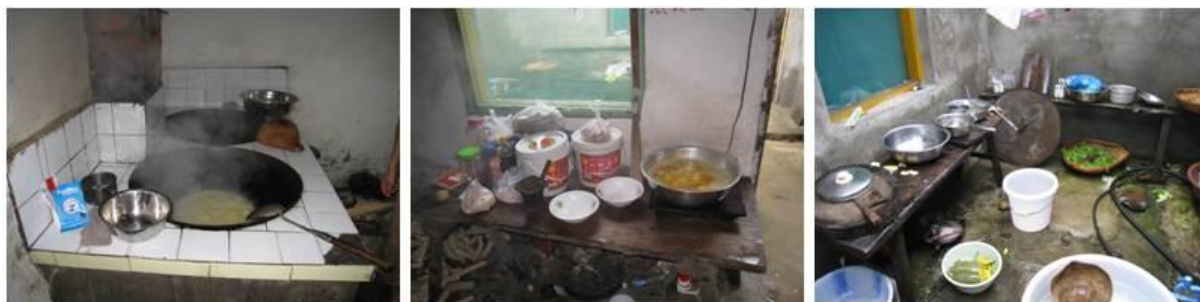
图 4 厨房组图

调查人员到校后, 查看了该校厨房, 该校的厨房非常简陋, 灶台的卫生情况尚可; 但是工作间物品摆放凌乱, 部分食材就地摆放; 厨房的地面、墙面的卫生情况均据标准的卫生条件有较大差距, 亟需改善。