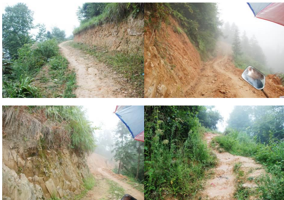
图 1 去往学校的山间小路

新晃侗族自治县位于湖南省最西部,居湖南“人头形”版图的“鼻尖”上,东连本省芷江侗族自治县,南、西、北三面分别与贵州省天柱县、三穗县、镇远县、玉屏县及万山区毗邻。全县辖 7 镇 16 乡 297 个村,总面积 1508 平方公里,居住着侗、汉、苗、回等 26 个民族,总人口 26 万,其中侗族占 80.13%。