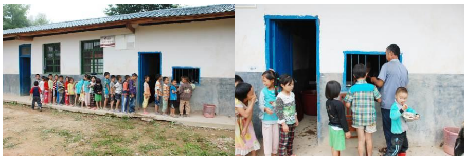
图9 学生在排队打饭