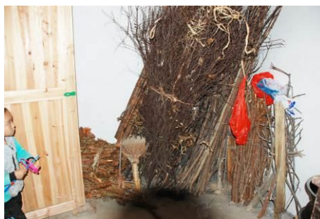
图 5 学校一般烧柴