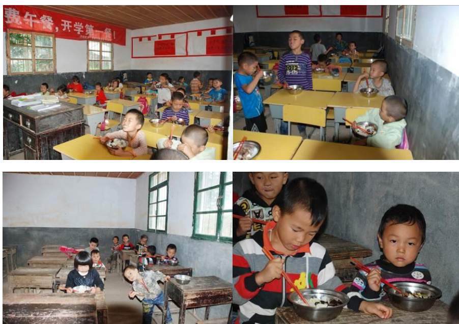
图 10 学生在教室用餐