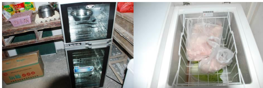
图 12 消毒柜和冰箱

该校老师与学生共用一个厨房，与学生同吃。校方没有向学生提供乳制品。学生浪费少，打饭菜也较公平。有菜品留样。