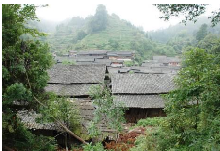
图 2 烂泥村