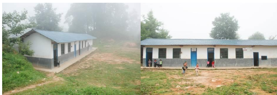
图 3 学校外景