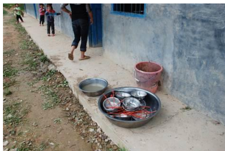
图 11 学生餐后餐具统一放置