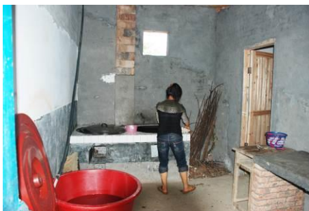
图 6 厨师正在备餐

调查者中午 11: 30 到达该校, 对该校的食堂操作间进行了突击检查, 发现一位厨师正在备餐, 没有穿工服, 也没戴帽子, 穿拖鞋, 厨师有健康证, 厨师卫生状况良好。