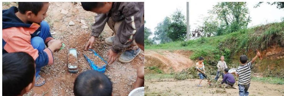
图 15 学生在操坪上玩耍