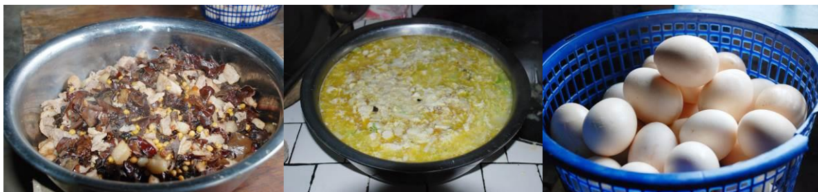
图 13 当日菜品

当天的菜品为木耳黄豆炒肉、白菜豆腐汤、鸡蛋。调查者与学生共餐，感觉菜的口味还好。