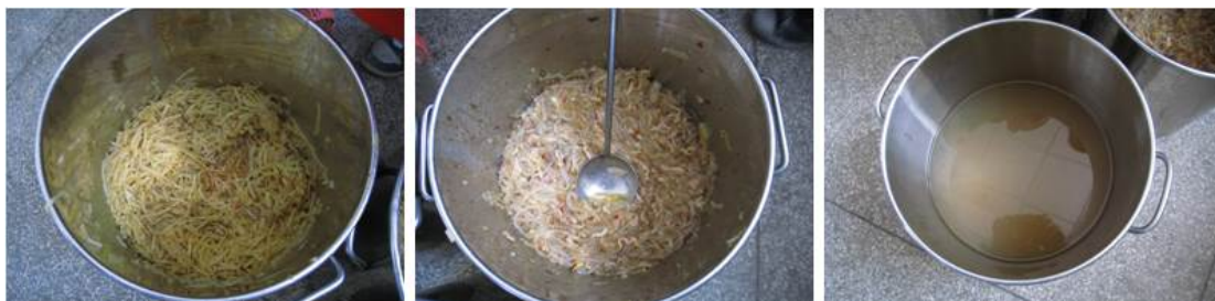
图 6 当日菜品

调查当天的菜谱为红烧洋芋、粉条炒肉和酸菜肉汤。调查人与老师共同就餐, 感觉菜品口味良好。