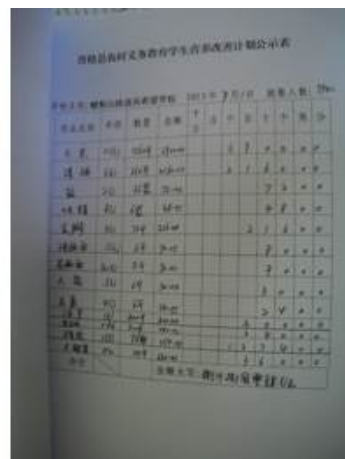
图 8 采购公示表