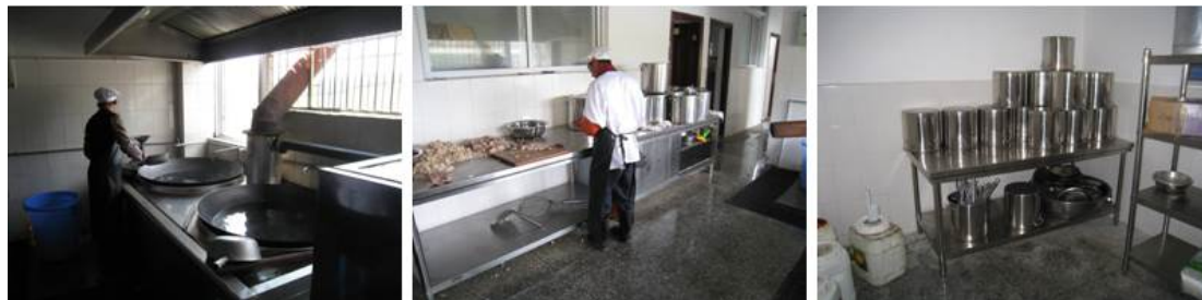
图 4 厨房组图

调查人员到校后, 查看了该校厨房, 发现该校的厨房是按照餐饮企业的标准建设的标准厨房, 厨房设有更衣间、消毒区、初加工区、加工区、储藏间等区域。其中工作台、灶台、墙面和地面都非常干净。