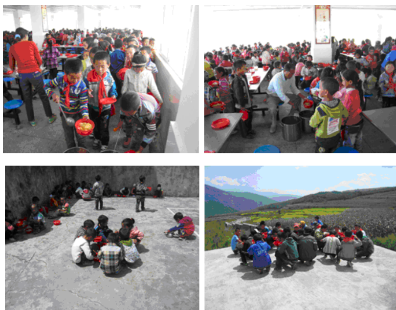
图5 学生排队盛饭、用餐组图

该校由于餐厅面积有限, 大致分为餐厅内固定区域就餐和餐厅外相对固定地点就餐两种, 后者为学前班和六年级学生。中午在开餐之前, 厨师将做好的饭菜按照班级先行分配至各餐桶中; 学生下课之后, 各班级排队到餐厅, 由值日老师或学生到领餐窗口领取盛饭菜的桶, 搬至该班级定点区域, 由值日老师或值日学生为学生分发饭菜, 也有学生自行盛菜、饭和汤的情况。用餐完毕后, 餐桶等由学生送至厨房窗口, 由厨房工作人员进行清洗、消毒。学生餐具自行进行清洗后, 自行保管。整个过程, 均有教师现场同餐、监督。