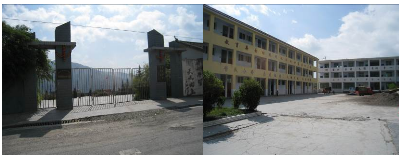
图 1 学校外景