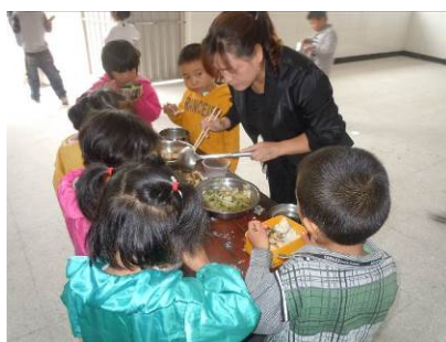
图 9 积极参与学生分餐的老师

该校执行了师生同餐制度，午餐菜品与学生餐完全一致。在该校学生就餐过程中，各班老师均积极参与相关工作，组织排队、分餐、监督用餐等。就餐结束后，未见孩子们出现明显浪费。调查人员未在该校看到孩子们饮用乳制品。