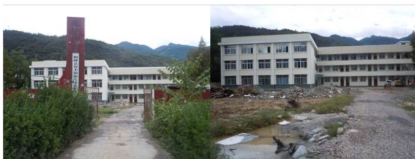
图 1 学校大门

调查人员需要说明是, 因时间关系, 未能前往庙湾小学实地了解留在该校的师生情况, 故本次调查内容及数据均以新庄民族小学现场情况为准。