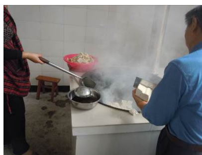
图 5 工作中的 2 名炊事员

调查人员在该校厨房见到炊事员 2 人, 没有着工作装也没有健康证, 炊事员自身着装干净, 无明显不规范操作。校长介绍, 炊事员的健康证正在统一办理中, 尚未领到证件。