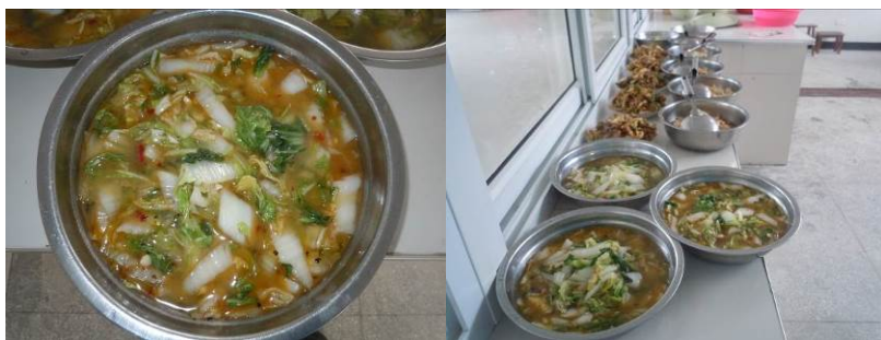
图 10 当日菜品