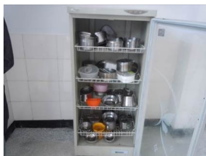
图6 断电状态的餐具消毒柜

调查人员到校时学生餐具消毒柜处于断电状态,消毒柜里的餐具未消毒,校长称消毒柜最近坏了,不能使用,正准备找人维修。就餐前学生没有洗手,校长称因本期刚刚搬回来,学校相关设施还不完善,暂不具备餐前洗手的条件。就餐在紧邻厨房的餐厅进行,就餐秩序稍差,排队意识不强。在该校厨房储藏室冰柜冷冻室里,调查人员见到了该校三餐食品留样,但没有任何标签,也没有留样记录表,调查人员现场纠正了食品留样的要求,校方表示将即刻改进。