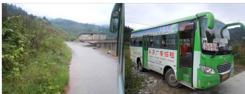
图1 县城至新庄小学的路况及公交车

2013年9月12日,调查人员自鹤峰县城景发客运站对面的公交站乘坐实验小学至新庄民族小学的公交车,经过约25分钟左右的车程到达新庄民族小学门口(2元)。结束对该校的调查后,调查人员原路乘坐公交车返回鹤峰县城。