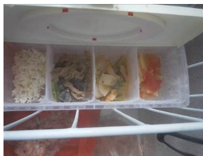
图 8 已被冻成冰的食品留样