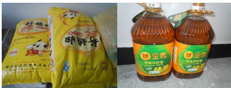
图 11 该校部分库存食材

据校长介绍,该校三餐食材均系统一采购,采购周期为每周一次,日常采购由两人负责,一人系学校食堂管理员老师(固定),另一人由值周老师轮转。日常采购均采购自鹤峰县城,采购价格与调查人员在鹤峰县城农贸市场了解到的行情基本一致,但没有索取凭证。从该校出示的上学期的采购记录台账上看,采购员仅让供应商在采购记录表上签字。调查人员查看了库存,菜品新鲜,根据该校出示的采购记录台账,调查人员认为食材库存量基本正常。