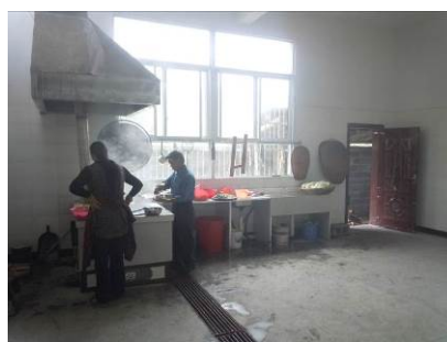
图 6 厨房全景

该校厨房为重建时新建厨房, 室内宽敞, 环境卫生状况尚可, 操作用具摆放规范。调查人员发现该厨房灶台是烧柴火的, 且位于灶台上方的排气系统工作似乎不太给力, 厨房油烟明显。