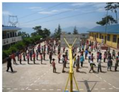
图 2 学校内景