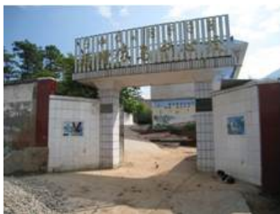
图 1 学校外景