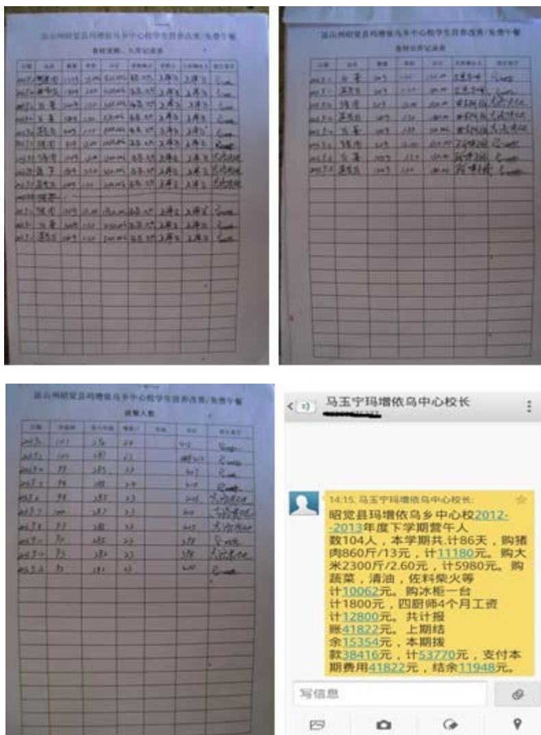
图 8 账目组图