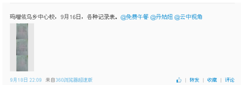
图 3 就餐人数的微博截图

调查人员现场见到厨工 2 人, 据该校马玉林校长介绍, 该校有厨师 4 人, 当天有 2 人请假。该乡中心小学现有教师 20 人。当天就餐人数为=小学部学生 280 人+教师 20 人+厨师 2 人=302 人, 与该校微博公示内容一致。