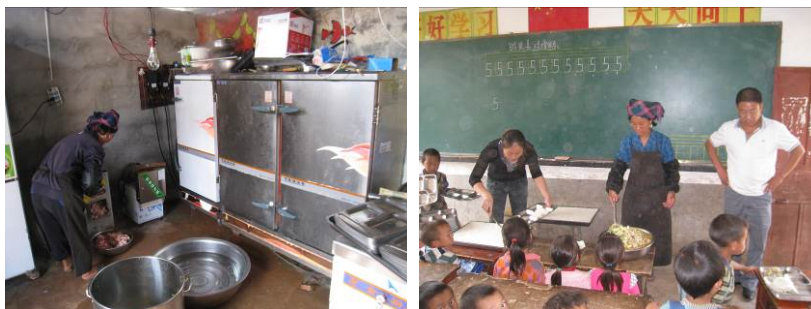
图 4 厨师工作组图

调查人员中午 11 点 10 分左右到达该校, 查看了厨房。看到厨师正在给学生准备午餐, 有健康证, 但调查人员观察, 厨师自身卫生情况一般。(下图的第二张图中系围裙者为该校其中一位厨师)。