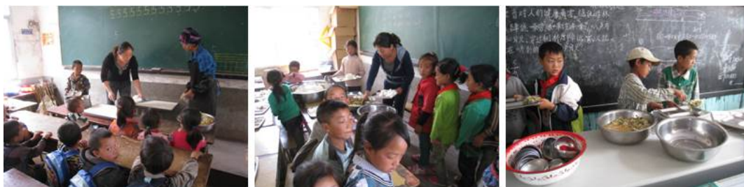
图 5 学生排队盛饭、用餐组图

该校实行的是教室分餐制。上午第三节课后(约 12 点 45 分), 学前班学生先行就餐, 就餐时, 由厨师将饭菜送至学前班教室, 厨师配合值日教师为学生分餐, 学生在教室就餐。此时段, 小学各班级, 将盛饭的桶和菜盆送至厨房, 由厨师负责装菜装饭。上午第四节后(约 13 点 30 分), 小学生在操场做完广播体操后, 到教室等待分餐。用餐完毕后, 值日学生将属于该班级的餐桶、餐盆洗涤后, 收回教室保管; 其他学生自行清洗餐具, 交回教室, 统一保管。整个过程均有值日教师或班主任监督。