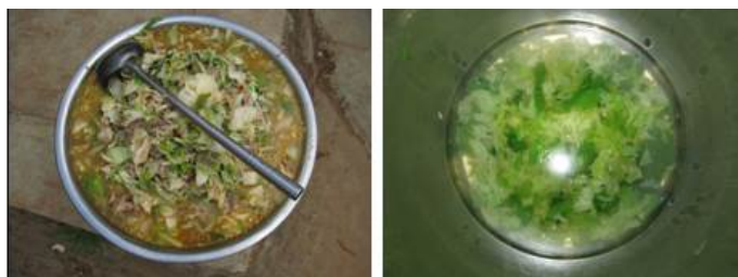
图 6 当日菜品

调查当天的菜谱为白菜炒肉和白菜汤。调查人与老师共同就餐, 感觉菜品口味良好。学生在分班级用餐, 从调查人观察, 结合询问部分学生, 饭菜的量完全能保证。该校目前正在兴建新厨房, 现使用厨房为临时建筑, 由于空间和卫生条件难以保证, 据马校长介绍, 现阶段该校每天中午一餐, 只做一个菜, 保证菜的质和量。