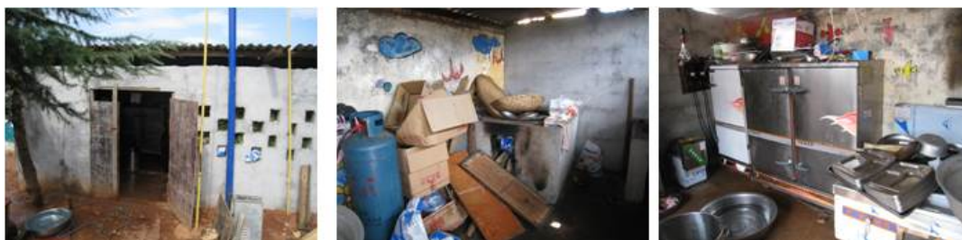
图 4 厨房组图

该校正在兴建新的厨房和餐厅, 现在使用的厨房为本学期刚刚启用的临时建筑, 整体条件和环境较差, 厨房内物品摆放凌乱, 但是工作台和砧板等设备基本符合卫生条件。经现场查看, 该校的蔬菜一般为两天采购一次, 肉和蔬菜等剩余食材在厨房清洗存放, 大米在总务处库房存放。