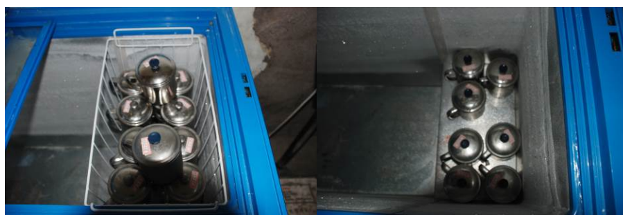
图 9 学校菜品留样

该校老师与学生共用一厨房, 与学生同吃。校方没有向学生提供乳制品。打饭菜也较公平。组织学生排队也做的较好, 也有菜品留样, 但有浪费现象。