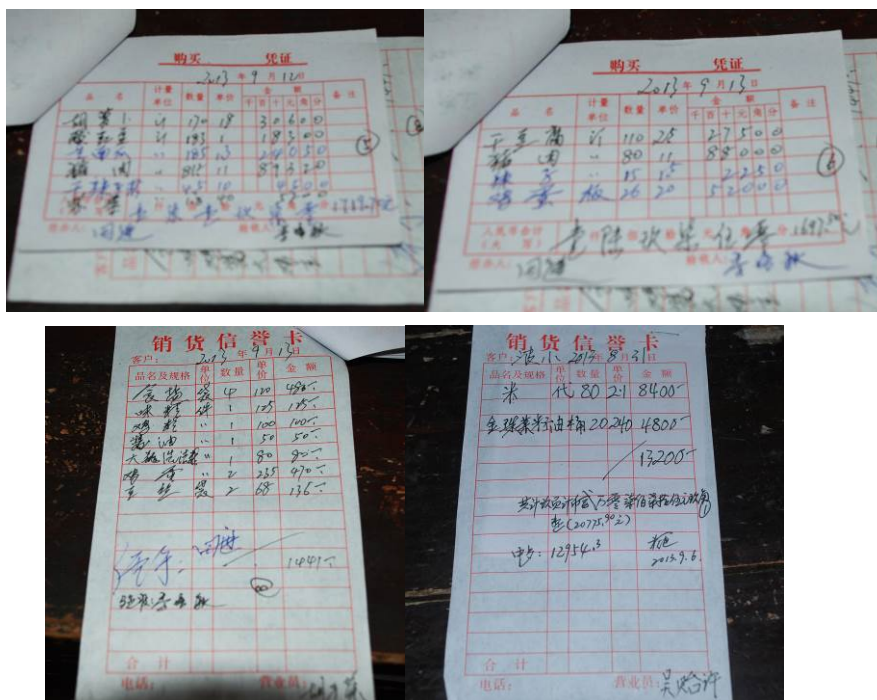
图 15 学校采购的原始凭证

该校的早、中、晚餐的资金来源分别为:寄宿生的早晚餐由自己承担。全体学生的午餐:小学生由国家营养午餐提供3元/人/天;学前班及教职工由免费午餐基金会提供3元/人/天;学校5名厨师也由免费午餐基金会提供700元/月/人。(上学期该校有6名厨师,这学期有一名厨师不做了,学校还要找厨师。)