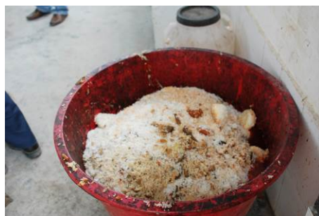
图 12 学校有专门用于给学生洗碗的热水龙头 图 13 学校两天倒掉的饭菜（包括教职工的）