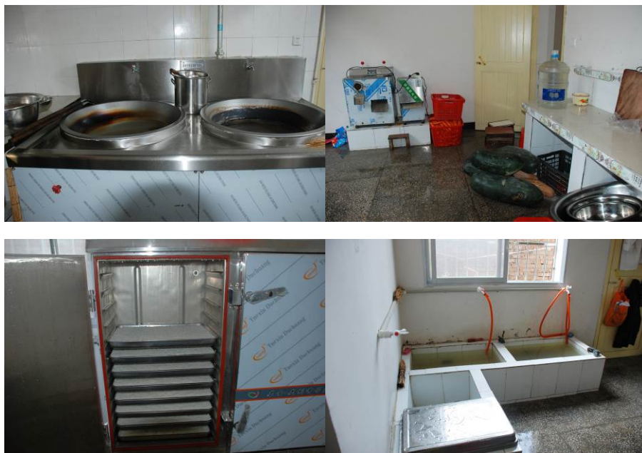
图 7 厨房卫生状况

调查者到校后, 认真查看了厨房, 发现厨房墙面、地面和灶台、工作台还干净, 砧板的卫生也不错。