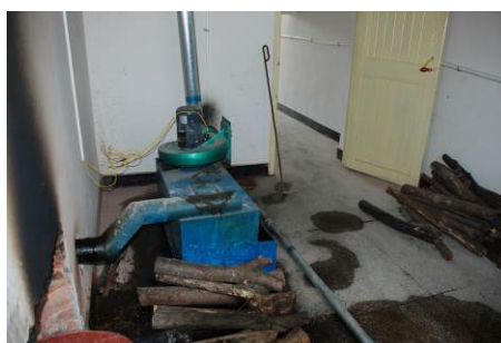
图 5 学校柴房