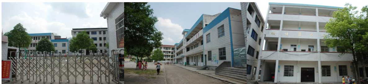
图 1 学校外景 图 2 学校教学楼和综合楼 图 3 学校教学楼之二(下面一层是食堂)