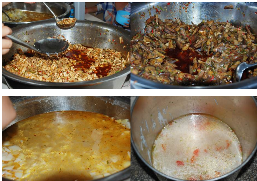
图 14 当日菜品

当天的菜品为卤豆腐炒肉、辣椒炒茄子、煮土豆片和火腿粉丝汤。与微博公示一致。调查者与学生共餐，感觉菜的口味一般（特别是茄子做的不好吃）。