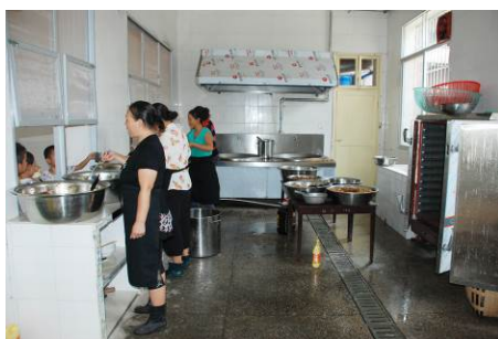
图 6 厨师正在给学生打饭

调查者中午 11: 30 多到达该校, 对该校的食堂操作间进行了突击, 发现 4 位厨师正在给学生打饭, 有的没有穿工服, 都没戴帽子, 厨师卫生状况良好。厨师有健康证。