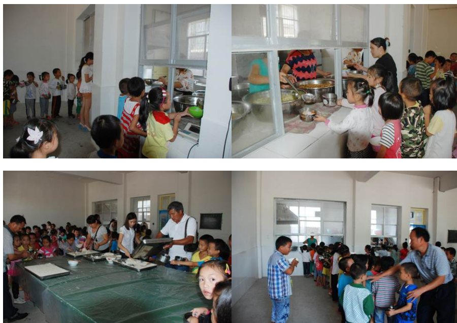
图 8 学生排队打饭

调查者观察到的情况, 结合该校杨校长介绍。中午学校分低、高年级分别下课, 学生到食堂自觉排队打饭, 然后进教室内用餐, 也有部分学生在教室外面用餐。餐具由学生自行保管。用餐完毕后, 学生自行到热水洗漱池清洗, 但没做消毒处理。