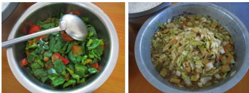
图 6 当日菜品

调查当天的菜谱为白菜豆腐炒肉和青椒炒肉。调查人与老师共同就餐,感觉菜品口味良好。调查人查看打饭过程,分发饭菜的量应该是能保证每个学生都能吃饱的。该校在早餐中为每个学生都会准备煮鸡蛋一个,查看了采购记录和库存的鸡蛋,该校能基本保证了全部学生每天都能吃到鸡蛋和肉。