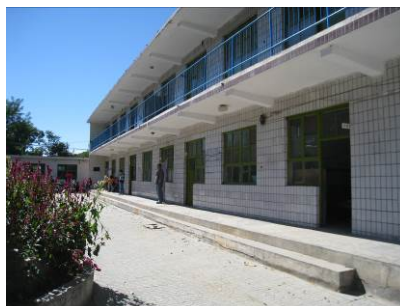
图 2 学校内景