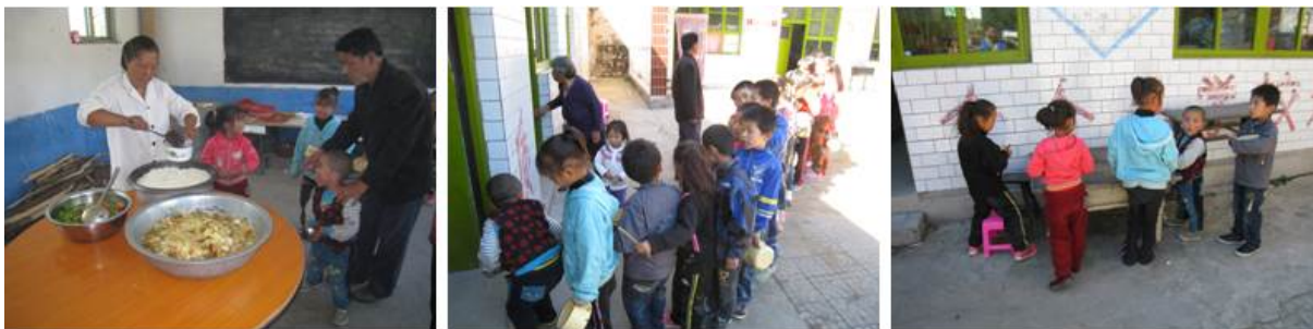
图5 学生排队盛饭、用餐组图

学生下课后, 统一到厨房内排队打饭, 盛好饭后在校园或教室分散就餐, 就餐完毕后, 学生自行清洗餐具, 自己保存餐具。据了解, 该校没有做菜品留样的相关工作。