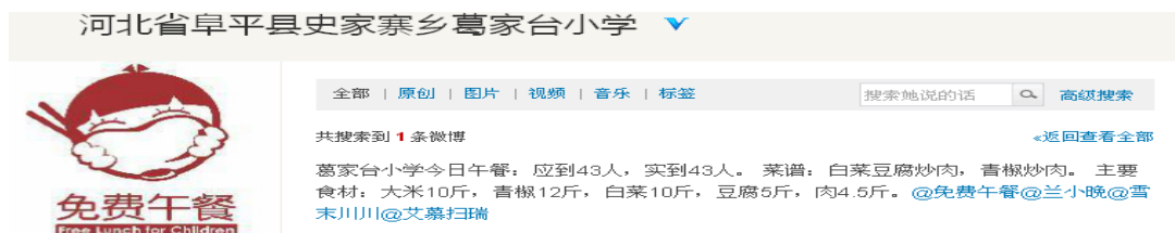
图 3 就餐人数的微博截图

调查人员现场见到厨工 1 人, 该校周校长提供了全校教师人数, 公办老师 7 人。该校当天就餐总人数为学生 35 人+教师 7 人+厨师 1 人=43 人, 与该校微博公示一致。