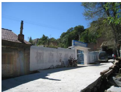
图 1 学校外景

葛家台小学位于河北省保定市阜平县史家寨乡葛家台村。阜平县位于保定市西约 110 公里, 阜平县的特点是老区、山区、贫困地区“三区合一”。一是革命老区。二是太行深山区。山场面积 326 万亩, 其中林地 126 万亩, 耕地面积 10.4 万亩, 俗称“九山半水半分田”。三是贫困地区。阜平是国家“八七扶贫攻坚计划”重点县, 是新世纪头十年国定贫困县, 新世纪第二个十年列为燕山—太行山连片特困地区、国家扶贫工作重点县。按照 2300 元国家贫线标准, 全县有贫困人口 88948 人, 贫困村 164 个。葛家台村位于县城西北方向约 45 公里, 该路段为县乡公路, 路况一般。该小学现有小学教学班 5 个, 28 人; 学前班 7 人。现有教师 7 人。