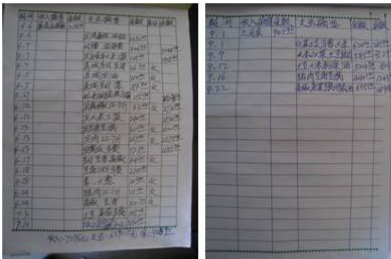
图 8 该校现金账目组图

在负责财务老师协助下，调查人查看了该校上学期和本学期的现金账，该账目一天一条记录，只载明了采购的食材名称、所用金额和结余金额，未注明食材单价、数量和经手人等重要信息。已向该校周校长提建议，进一步完善食材采购的原始凭证管理，建立食材的入库、出库管理，完善现金账的记录科目。