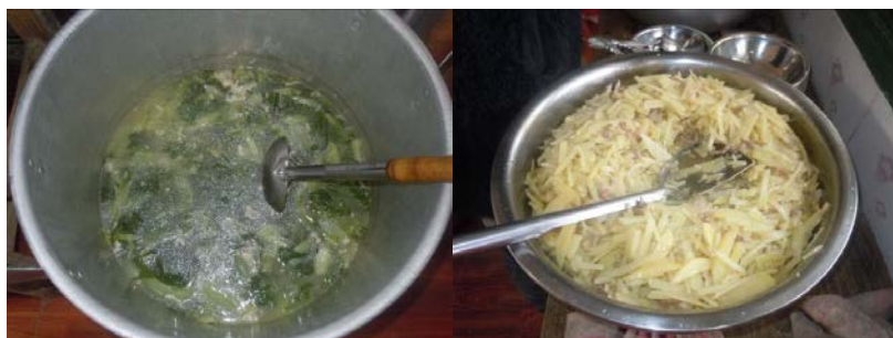
图 10 当日菜品

该校当天的菜谱为:米饭、土豆丝炒肉丝、白菜肉末汤,菜品口味尚可,量足,无明显浪费。调查人员注意到该校当天的菜品中肉的可见数量偏低,已提醒学校适当提高肉类的搭配。