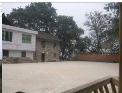
图 3 孩子们主要的活动场地