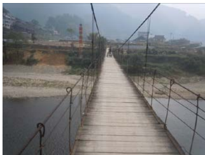
图 1 平寨民小门口的吊桥

10 月 15 日, 调查人员自凯里市东郊客车乘车点乘坐前往三棵树镇的客运班车 (3 元), 转乘摩托车到达平寨村吊桥路口 (10 元), 徒步过吊桥到达学校 (5 分钟左右)。结束对该校的调查后, 调查人员原路返回到吊桥路口, 搭乘一辆过路出租车回到凯里市新磨坊酒店门口 (15 元)。