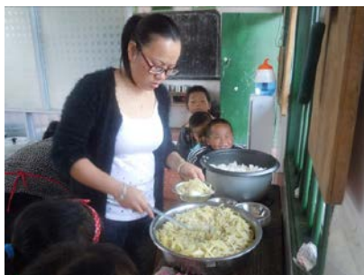
图 9 老师亲自参与分餐

该校严格坚持了师生同餐制度,调查人员当日与该校师生一起用餐,教职工饭菜与学生餐完全一致;在该校学生的就餐过程中,老师均积极维持秩序并参与分餐,保证分餐公平;就餐时老师会巡视一下教室,教育学生不要浪费;调查人员在该校未看到学生饮用乳制品。