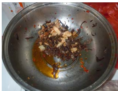
图 8 “食品留样”