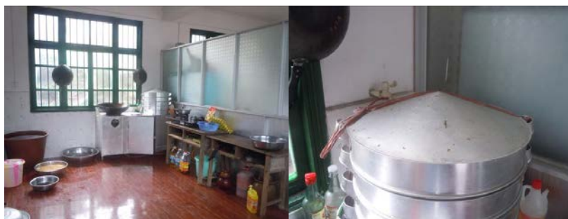
图6 厨房全景及局部情况