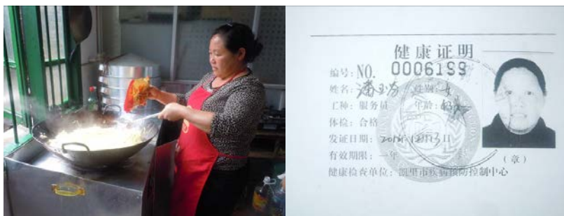
图 5 炊事员及其健康证复印件

调查人员在该校厨房见到了炊事员 1 名, 女性, 约 40 岁, 未着工作装, 只系了围腰, 持健康证上岗。调查人员目测炊事员自身着装相对干净, 未见明显不规范操作。