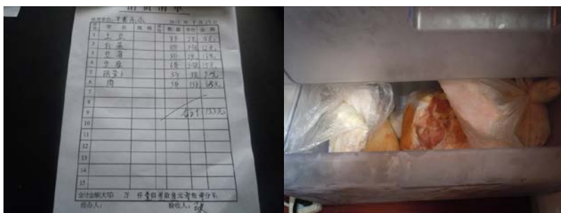
图 11 采购凭证

据该校顾校长介绍,该校日常食材采购由校长和一名老师负责,两人谁有空谁买,主要采购自凯里或者三棵树镇。校长向调查人员出示了采购凭证,凭证保存完好,根据调查人员从凯里市菜市场及摩托车师傅那里了解到的行情,调查人员认为采购价格基本正常,调查人员注意到部分采购凭证系学校自制保存,且几乎无相关责任人签字。调查人员查看了该校的库存食材,根据该校出示的采购及出库记录,认为库存量正常。调查人员在该校冰箱的冷藏室看到了部分冻肉,校长称系村寨里居民家不久前办酒席肉没用完,暂时存放在学校冰箱。