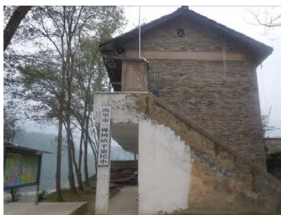
图 2 学校教学综合用房

平寨民小位于贵州省东南部的黔东南州三棵树镇平寨村，距离三棵树镇约 10 分钟车程，距离凯里市约 40 分钟车程。学校所在的村寨居民生活水平一般，主要经济来源以外出务工为主，从事农业种植的居民不多。据校长介绍，村寨周围的耕地基本都出租给了外地的菜农种菜。平寨民小是平寨小学的下属教学点，学校硬件设施较差，除一幢年代久远的独立教学综合用房外，学生活动场地都是借用的村寨的公共小广场。该校系免费午餐“宝贝学校”团队定捐学校，同时属国家营养改善计划覆盖学校，全校现有学生 23 人（其中学前班 9 人），教职工 4 人（含支教老师 1 人），全校纳入免费午餐计划共计 27 人，自 2012 年 11 月起开餐。