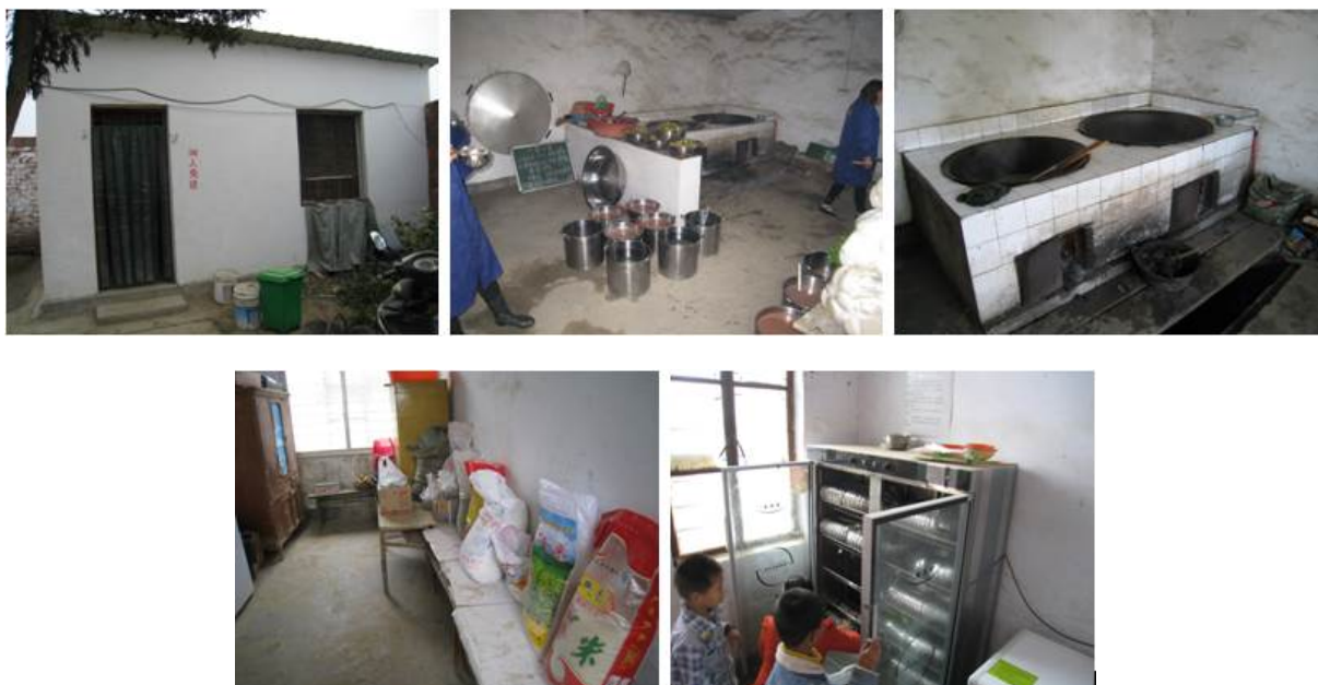
图 4 厨房及储藏室组图

调查人员到校后, 查看了该校厨房和储藏室, 两者的硬件环境较好。工作台和地面较干净, 墙面有灰尘, 该厨房的生、熟砧板都很干净。