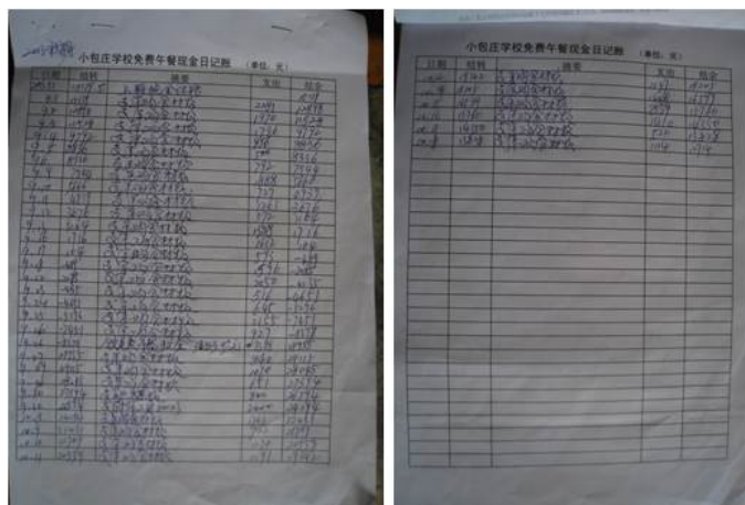
图 10 该校账目组图

在该校张本现校长的协助下，调查人查看了该校用于资金管理的《现金日记账》，该账目就是将每日《食材出库单》的每日消耗金额、厨师工资开支和结余金额进行了登记，简洁明了。