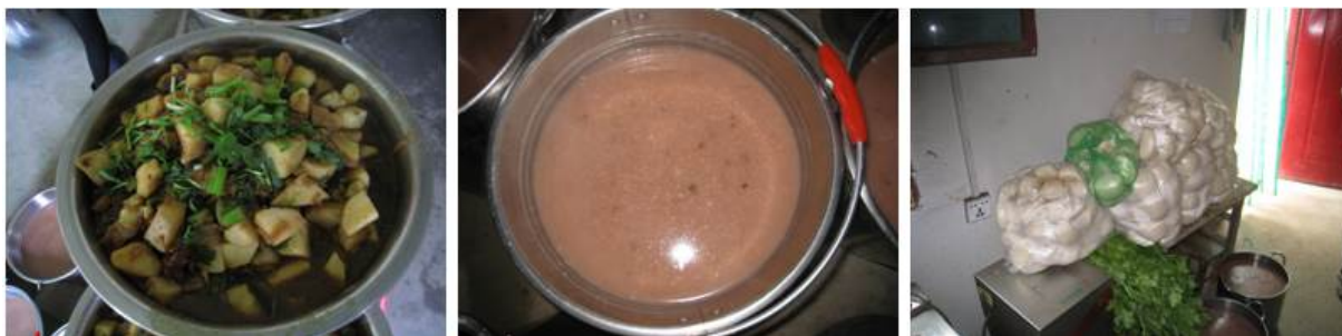
图 6 当日菜品