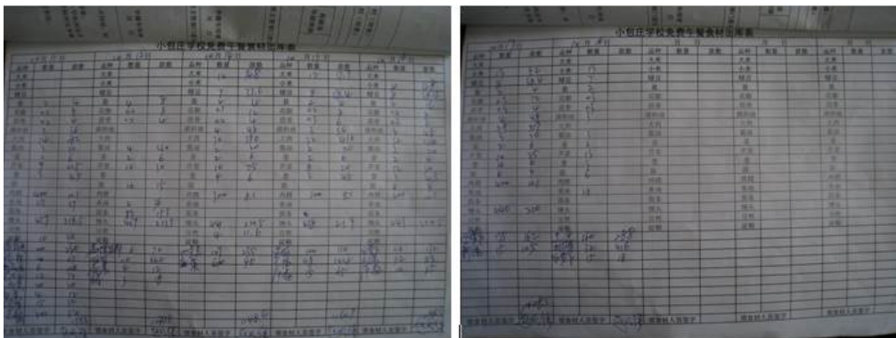
图 9 出库清单组图