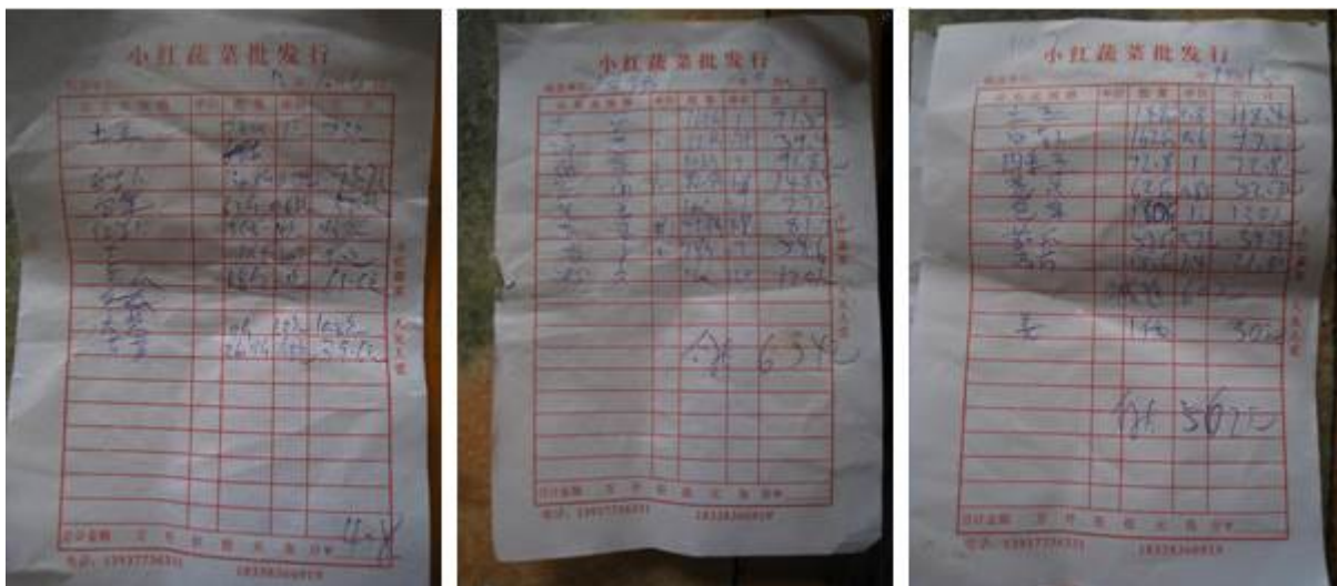
图 7 收据组图

从该校张本现校长介绍，该校的采购现实行校长加总务主任的双人采购制度，该校的大部分食材定点采购于柳河乡集市的固定几家，一部分食材采购于方城县城的蔬菜批发市场，肉类的采购通常是固定供货商送货上门。蔬菜类基本为每天采购，土豆、大米等为每周采购，肉和馒头为当天订购送货。该校的食材新鲜度较好。该校涉及采购环节主要有如下三种凭证或登记。一是原始采购凭证。由采购人员在采购时向供货商索取，该凭证食材种类、单价、采购量和合计金额等主要信息齐全，但是缺乏采购经手人签字信息，且保存较为凌乱。二是《采购入库表》。该表是日记账形式，该表中，纵列列明了全部食材名称，横列是采购日期。该表中采购食材的单价及库存信息完整。三是《食材出库单》。该表中横列为日期，纵列为出库食材名称，该表中列明了每次出库的种类和出库量，而且每次出库，领用人都进行签字确认。