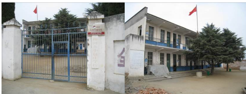
图 1 学校外景

小包庄小学位于河南省南阳市方城县柳河乡小包庄村, 方城县位于河南省西南部, 位于南阳市东北约 60 公里。柳河乡位于方城县城西北部约 32 公里。方城县城到柳河乡路段为连接方城和南召县、南召火车站(该站位于南召县云阳镇)的 331 省道, 班车较方便。小包庄村位于柳河乡西北部约 3 公里, 该路段为县乡公路, 路况较差。该校现有小学教学班 7 个, 共 244 人; 学前班 3 个, 143 人。该校现有教师 14 人, 其中 7 名代课教师。该校现在正在新建新的厨房和餐厅。