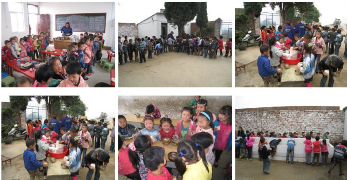
图5 学生餐前排队、盛饭、用餐和洗碗组图

后在厨房门口的分餐桌前排队领餐,领餐后,在教室用餐,用餐完毕后,自行在校园内的洗漱池中清洗,清洗完后,再以班级为单位统一放置在消毒柜中保存。调查人员在储藏室的冰箱中查看到了该校的往期食品留样。餐前,学生基本都会在校园洗漱池中洗手。