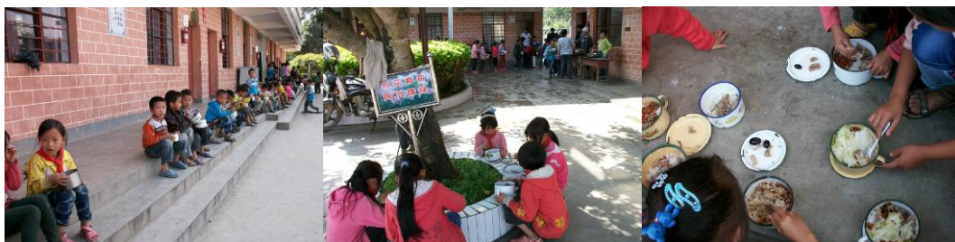
图 7 操场上用餐的孩子

(4) 由于学校没有餐厅, 也不允许在课室吃饭, 所以, 现在没有固定的用餐地点。