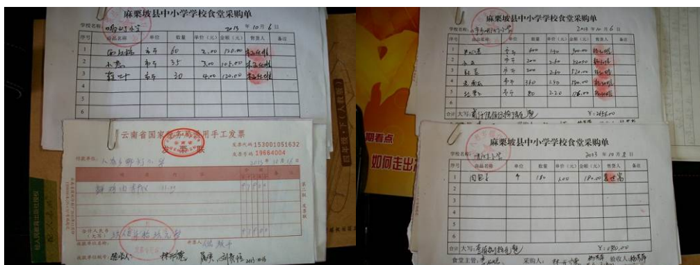
图 18 采购单