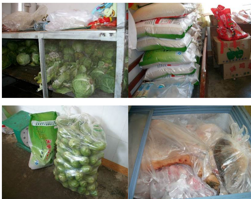
图 16 库存

本次调查的时间为 2013 年 11 月 6 日, 校长向调查人员介绍了学校的采购情况, 一周采购 1 次, 平时如果需要会临时进行采购作及时补充, 售价已经包含了运费。关于采购监督, 该校总务负责采购及账务, 校长负责证明及审核, 建议在人力充足的情况下作适当调整, 增加第三人作为验货和证明。