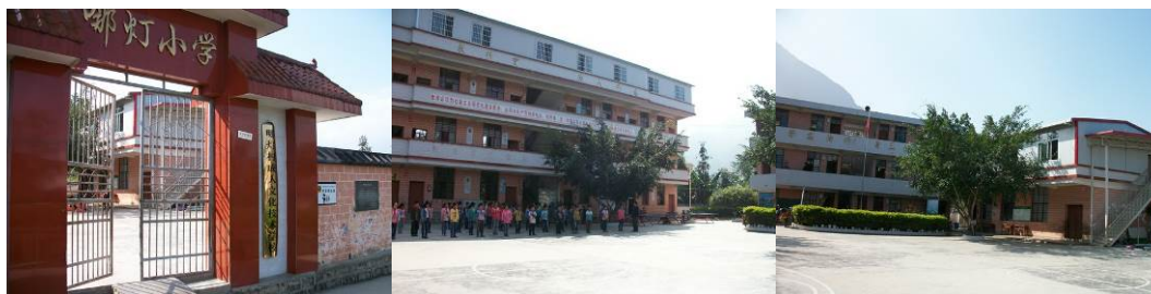
图 3 学校