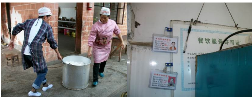
图 10 厨师