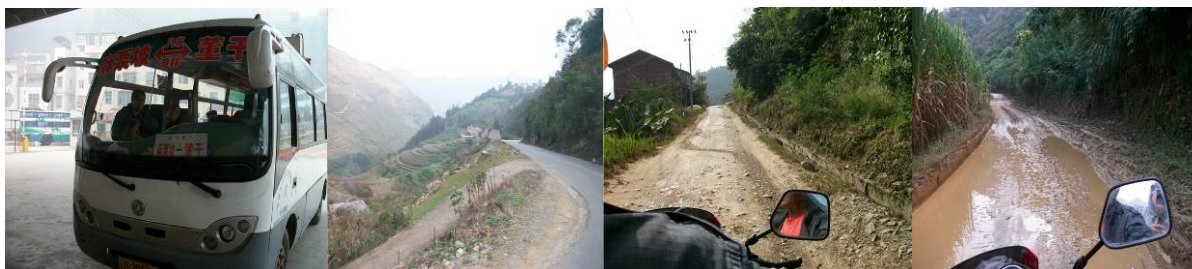
图 1 交通

哪灯小学位于云南省文山州麻栗坡县八布乡，离越南最近的一所学校，调查人员从麻栗坡县城出发，先搭乘中巴车到八布乡（此段路况较好，2 小时，15 元），再转乘摩托车抵校（此段路况较差，半小时，20 元）。该校虽地处深山，但硬件设施较好，并且得到当地边警的大力支持，设有学前班及小学 1-6 年级各 1 个班。