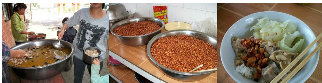
图 15 当日菜品