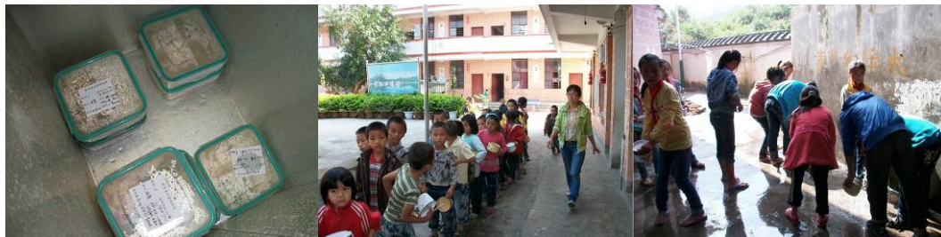
图 12 食品留样

该校有着本区域共存的问题,有消毒柜,但只针对教工餐具进行消毒,而孩子们的碗因为有把手不能叠放不能批量置于消毒柜内,所以孩子们的餐具一直没有消毒,而且,由于孩子们的碗是私人财产,不宜统一进行清洗和消毒等工作,一直执行的方式为:自己使用、自己清洗、自己保管。关于餐前洗手,执行条件还需创造。