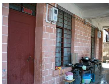
图 8 老师的厨具