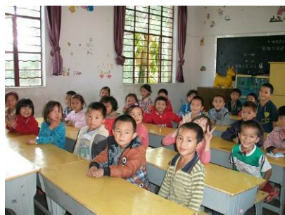
图 6 学前班