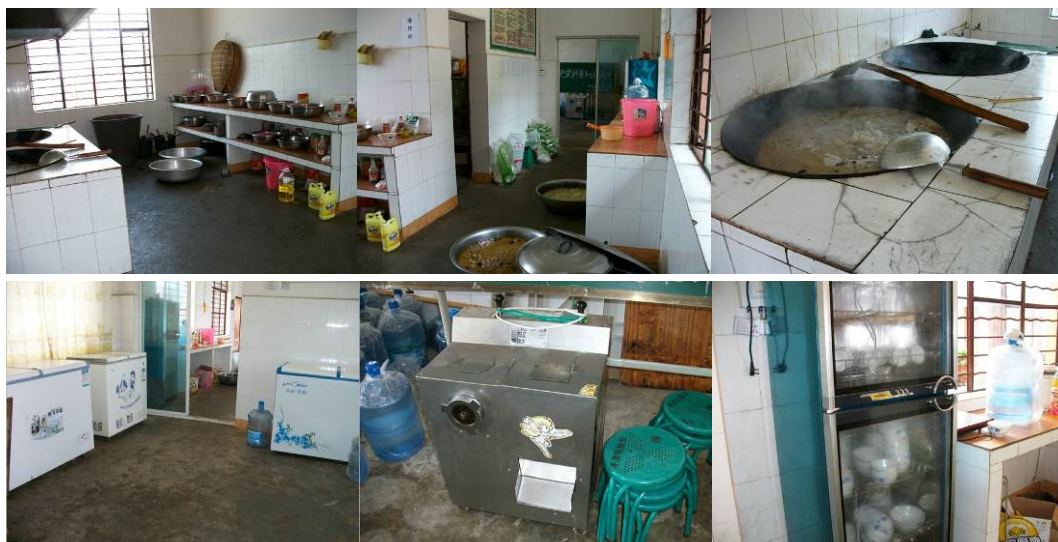
图 9 厨房及设施设备

该校厨房宽敞, 内设两个储藏室, 小的存放蔬菜, 大的存放冰柜及桶装水等物资, 综合情况, 卫生有待加强, 其他尚好。2 名厨师每天为 200 人供餐, 工作量可以想象, 过份要求显得不合情不合理, 期待免费午餐进入后, 人手增派能解决卫生的问题。