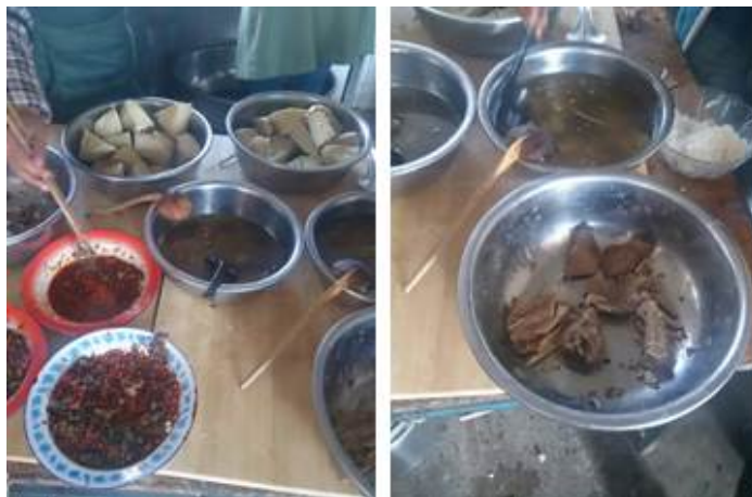
图 9 当天教师菜品图