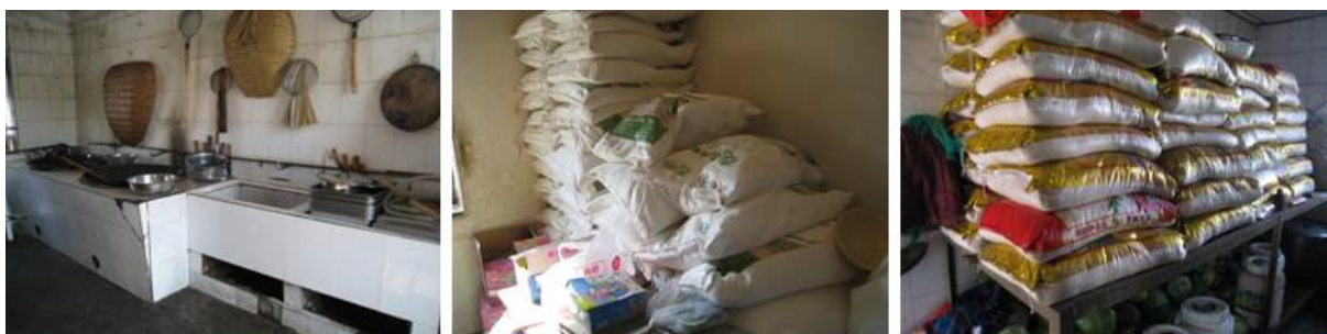
图5 厨房及储藏室组图