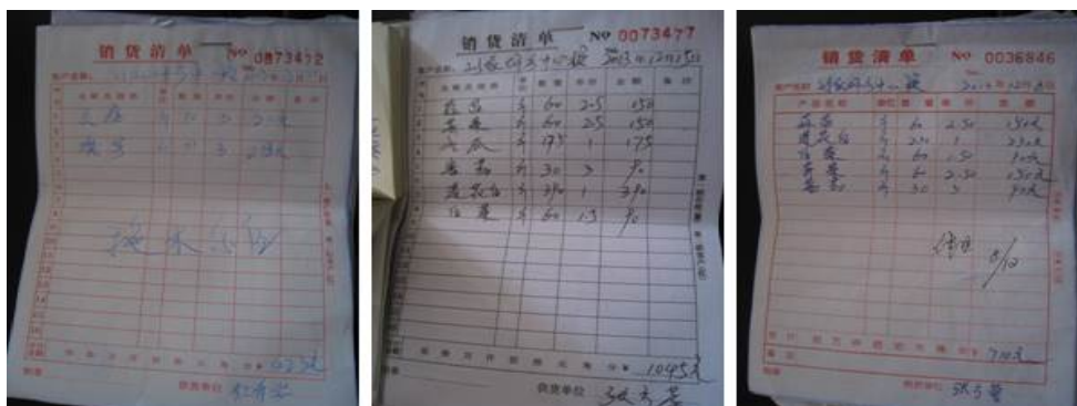
图 12 食材采购原始凭证组图