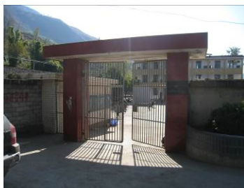
图 1 学校外景

普格县隶属于凉山彝族自治州, 位于州府西昌南约 75 公里, 该路段为省道路段, 路况很差, 车程约 3 小时。凉山州下辖西昌、会理、普格和美姑等 17 个县市。普格县下辖荞窝镇、螺髻山镇、花山乡和刘家坪乡等 3 镇 31 乡。刘家坪乡中心校所在的刘家坪村位于普格县城西北约 17 公里, 一般的路线选择为县城—大河坝—花山—刘家坪, 其中县城到大河坝的距离约为 7.3 公里, 国道, 路况较好; 大河坝到刘家坪的路为县乡公路, 约 9.7 公里, 路况很差。该中心校现有小学教学班 11 个, 共 641 人, 其中住宿生 279 人; 学前班一个, 65 人; 该校现有教师 26 人。