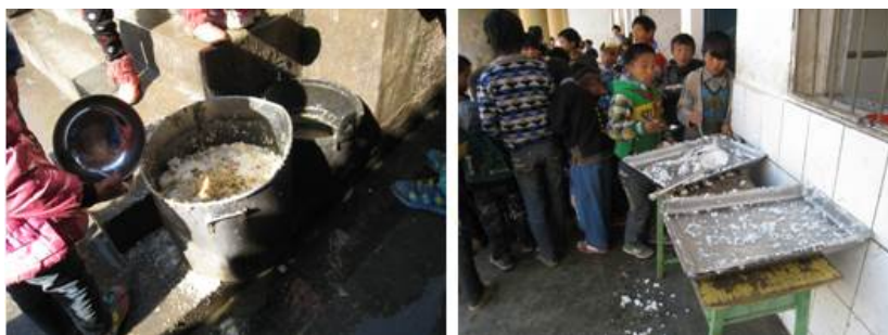
图 10 当天浪费情况组图