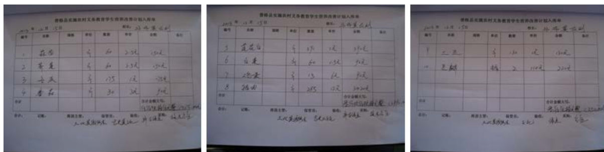
图 14 食材入库单组图