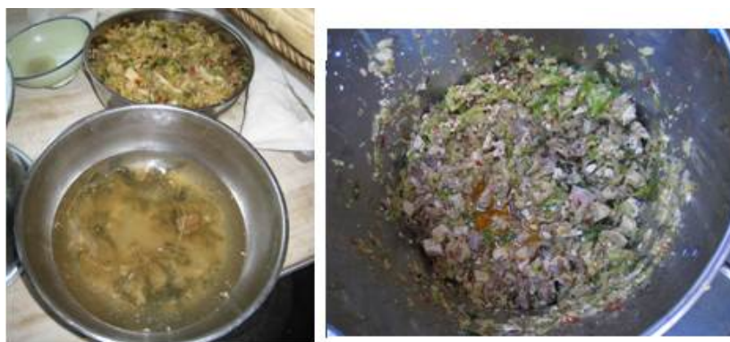
图 11 当日菜品