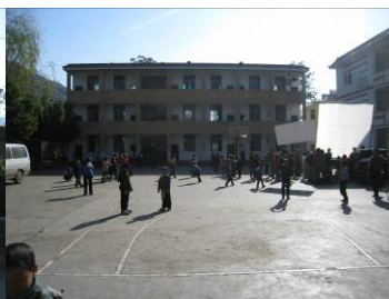
图 2 学校内景