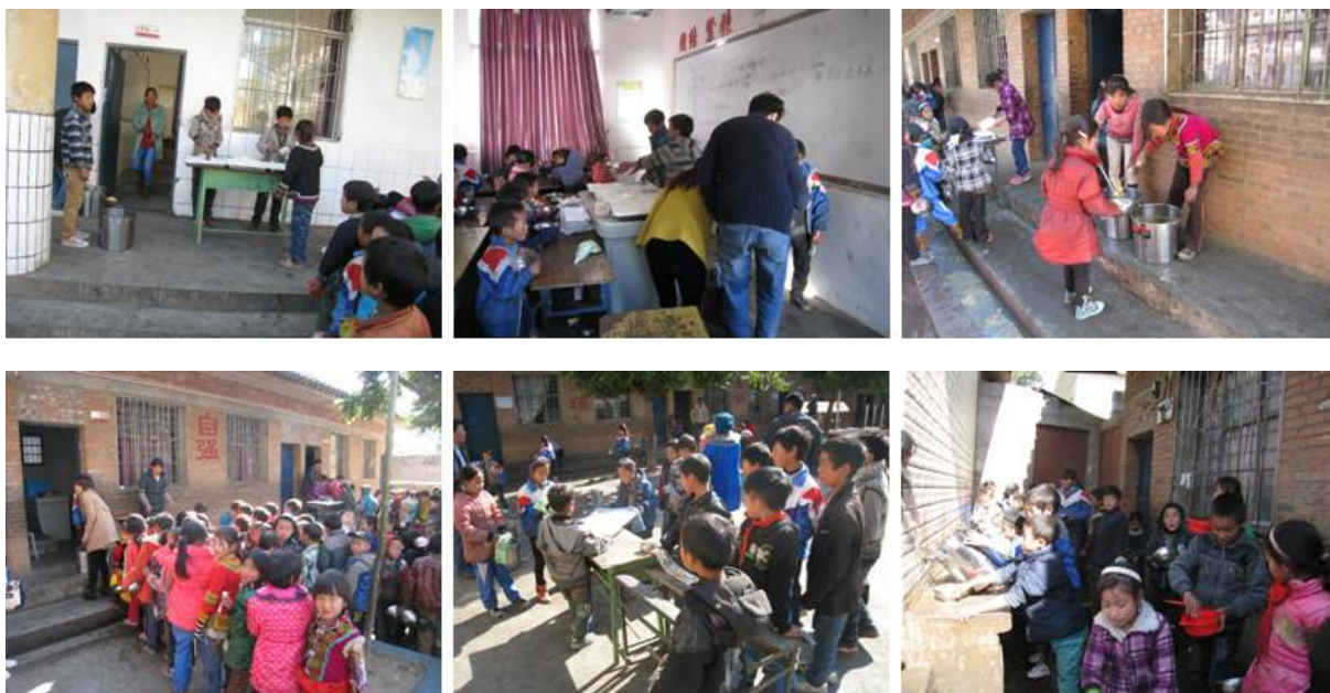
图 6 学生盛饭、用餐和洗碗组图