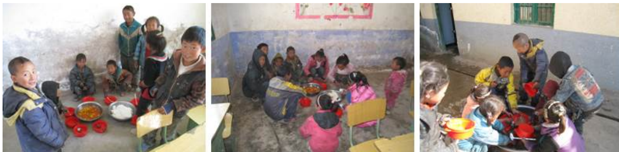
图 6 学生用餐和洗碗组图

关于餐前洗手环节,由于该校严重缺水,学生从家自带洗手水,餐前,几个同学一组一起洗手。此外厨师在每餐前,也需要到 500 米外的水源地挑水备用。关于食品留样,调查人员在存储室的冰箱中看到了往期食品留样,但未看到该校的《食品留样登记表》。关于餐具消毒,调查人员查看了该校的《餐具消毒登记表》,该记录表记载了消毒时间、消毒对象、方式和操作人及监督人信息。