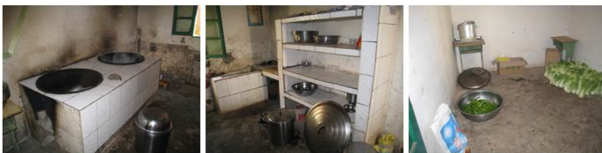
图 5 厨房及储藏室组图

该校的厨房分为操作间和储藏室两间。操作间的灶台和地面都较干净, 墙面有灰尘。操作间里面有一个套间, 用来存放部分食材。储藏室存放着冰箱、学生餐具碗柜和部分食材, 此房间兼具初加工功能, 工作台也在此间, 看到了砧板, 较干净。综合以上情况, 调查人认为, 厨房一共三个空间, 建议根据厨师的工作习惯和卫生要求, 进行优化规划。