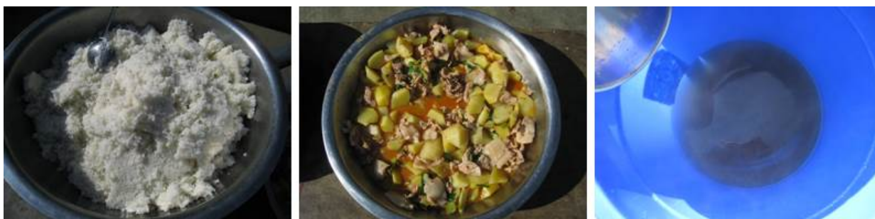
图 8 当日菜品

调查当天的菜谱为土豆炒肉和白菜蛋汤。调查人与老师共同就餐,感觉菜品口味良好,肉量很足,但略感肉质一般。调查人看到的打饭情况,结合咨询部分学生和调查问卷的情况,打饭公平度和饭菜的分量都有保证。