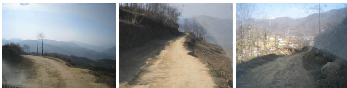
图3 到校部分路段路况图