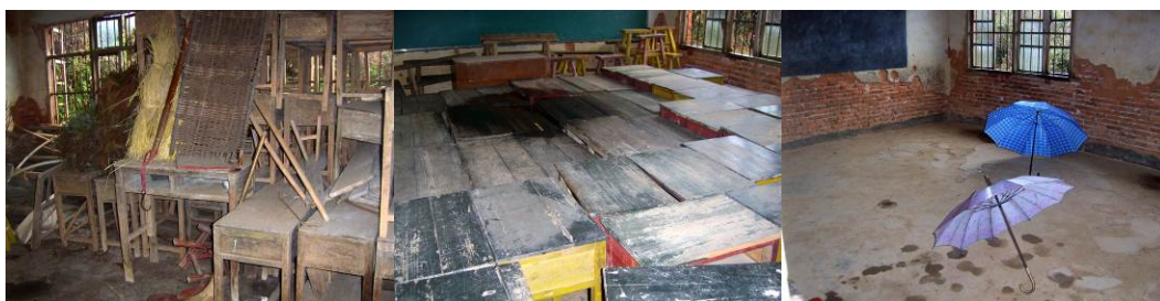
图 22 空置房可改为临时餐厅供学生就餐

(4) 该校现没有学生餐厅,调查人员在学校整体观察后,发现厨房旁边有三间空房,空间都比较大。现一间放杂物,一间放旧课桌,还有一间是空的,校长回应此排房子(含现厨房)明年要拆了重建。调查人员建议先解决眼前,免费午餐开餐后把空置房临时当餐厅,旧课桌当餐桌,遇到恶劣天气时孩子用餐就比较方便了。