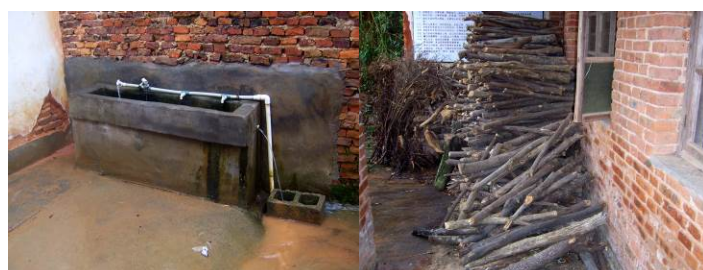
图 21 学生的洗涮池和柴火堆放处