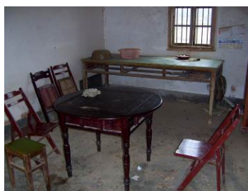
图 20 老师的小餐厅