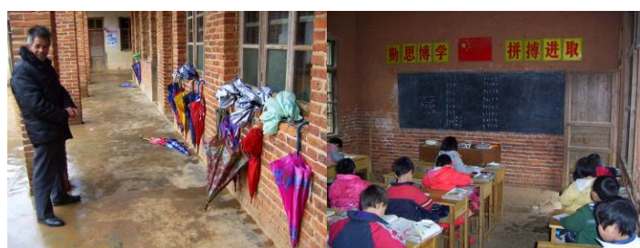
图 8 学生当日上课情况