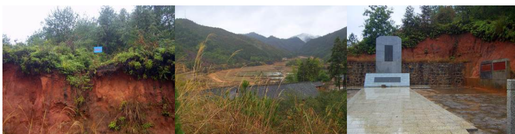
图4 红军长征突破第一道封锁线遗址

信丰县新田镇百石村是当年红军长征突破敌人第一道封锁线所在地，也是红军长征路上牺牲的第一位师长所在地，牺牲的洪超师长为彭德怀部的先遣部队，洪师长牺牲后就葬于百石村，“洪超烈士之墓”的碑名是由张震老将军题写的。在洪超墓不远处，有一条当时国民党军挖的战壕，长 500 米，深约 1.2 米，宽约 0.7 米。战壕如今虽长满了灌木、杂草，有的地方也已崩塌，但依然清晰可见，是当年国民党构筑封锁线，阻止红军长征最有力的历史见证。