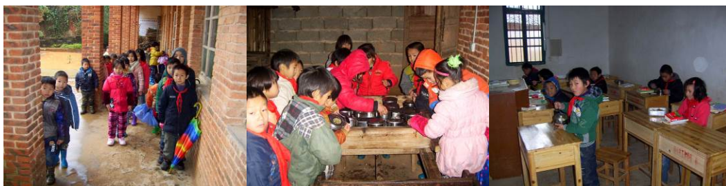
图 11 学生主动排队去厨房领饭尔后在教室就餐