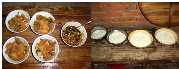
图 15 老师的午餐情况