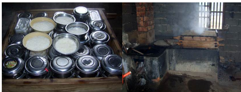
图 10 学生的午餐及加热情况