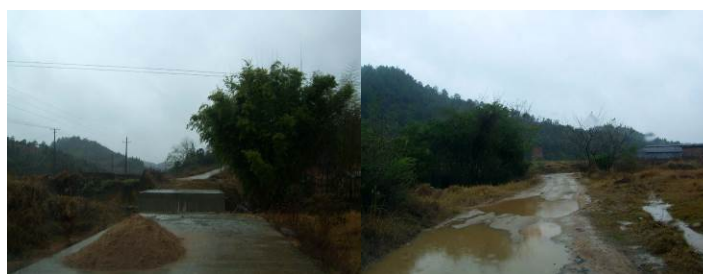
图 2 路遇断桥只能绕行走泥巴路