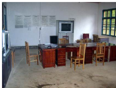
图 18 学校的会议室下一步改为厨房