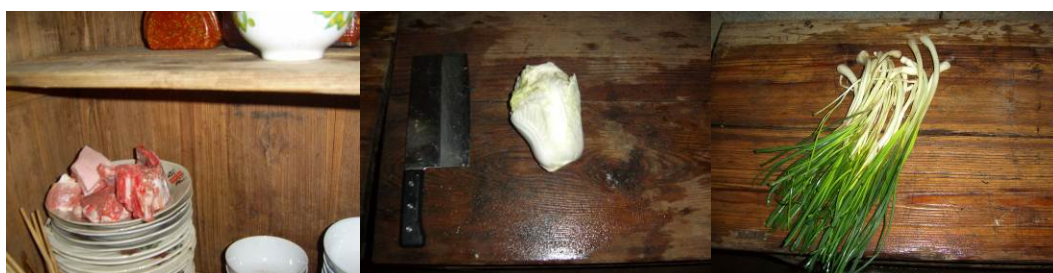
图 14 老师的用餐食材

本次调查的时间为 2013 年 12 月 16 日，在厨房内看到老师的部分午餐菜品，谢校长介绍 5 名老师全是本地人，午餐全部在学校用餐，早、晚两餐回家吃。老师的用餐标准为 5 元/天。