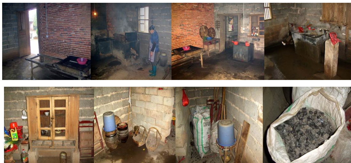
图 19 学校的厨房情况