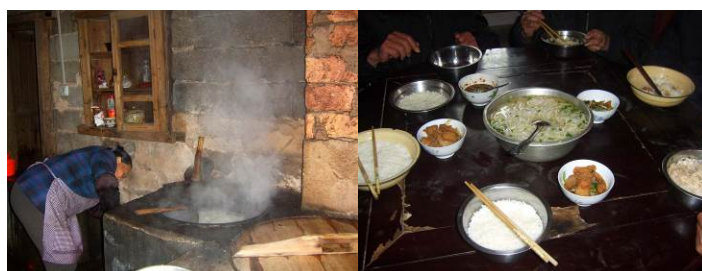
图 16 当日就餐多了两人厨师又添加了一盆米粉