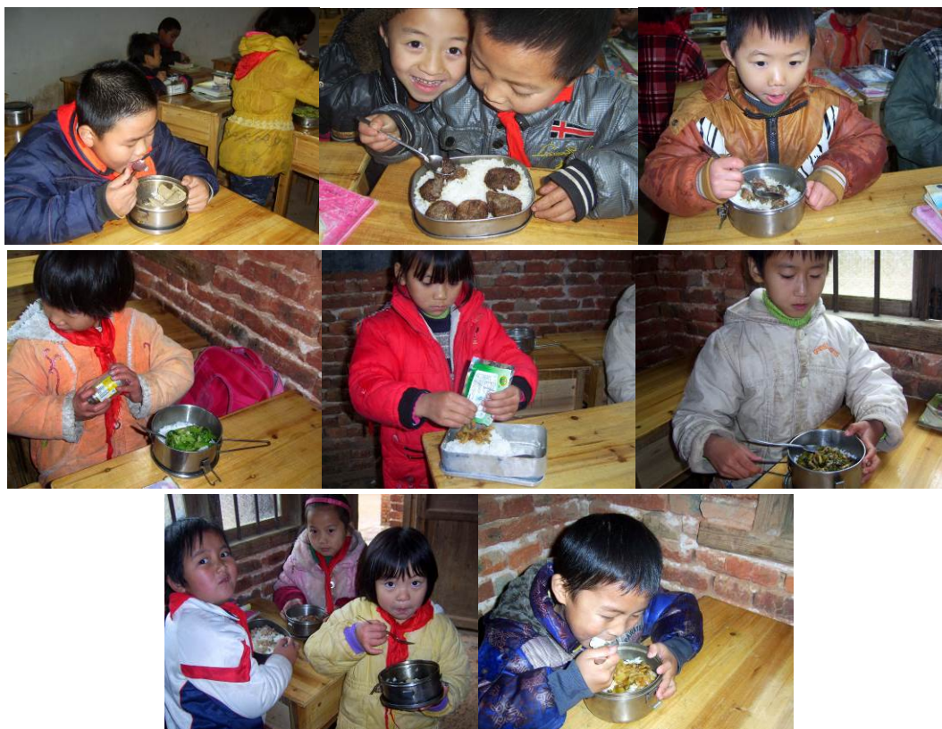
图 12 学生的午餐情况