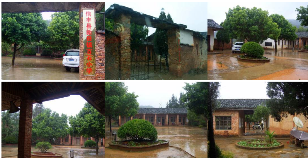
图 6 学校组图

该校现共有学生 95 名, 老师 5 名 (1 人为民办), 厨师 1 名, 学校校长: 谢远河, 教导主任: 黄木华, 财务主任: 陈宗连, 教师普遍为中老年, 平均年龄 56 岁左右, 全部不会使用电脑, 也不懂互联网。学校的相关信息与免费午餐工作由新田镇中心小学校长顾起峰全面负责, 网络由中心小学陈副校长负责。