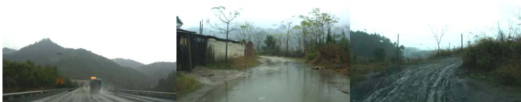
图 1 路况

调查人员 12 月 8 日上午 9: 00 从长沙市家出发, 乘 301 路、130 路公交车 (票价 4 元) 至长沙汽车东站 11: 00 乘发往江西省修水县的大巴 (票价 78 元+5 元代售费)。12 月 15 日宿南康市汇丰假日酒店 (住宿费 120 元/天)。12 月 16 日上午 8: 00 从南康市由老战友卢致裕 (听说我是中国社会福利基金会免费午餐的志愿者, 又为他家乡孩子们谋福利, 他也想献爱心, 就用私家车陪我一同下乡探访调查) 驾着越野车我们一同前往百石小学。当地已下了两天的中、大雨, 即日清晨还不停的下着, 大山里烟雨蒙蒙。10: 30 左右到达百石小学开始进行调查, 13: 30 调查结束, 我们驾车计划去新田中心小学向顾起峰校长了解相关信息, 但在半路遇上泥石流把道路阻隔, 无奈只能选择另一条道路返回南康市, 夜宿南康市汇丰假日酒店 (住宿费 120 元/天), 12 月 17 日早晨老战友送我至赣州汽车站 10: 10 乘大巴至抚州, 17: 50 到达抚州汽车总站, 步行 3 公里至发往荣山镇的汽车站, 宿华鑫商务宾馆 (住宿费 100 元/天)。