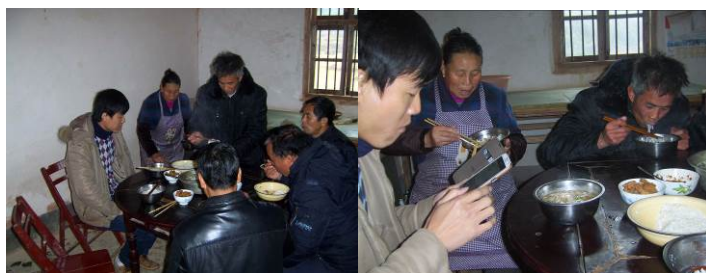
图 17 老师就餐情况，战友称这是他吃的最有意义的午餐