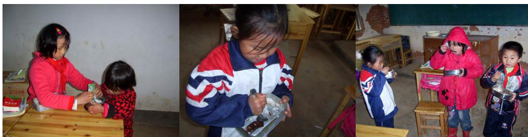
图 13 合吃一份榨菜、合吃一碗饭解决午餐