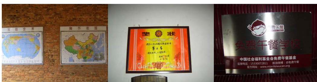
图 7 学校的荣耀