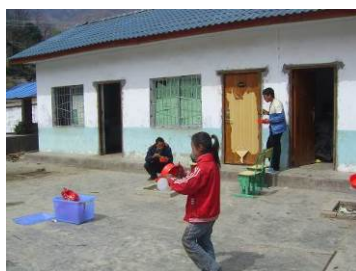
图 22 老师在学生用完餐后才开始用餐图