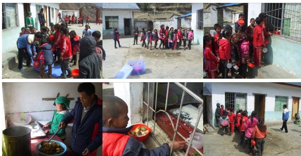
图 21 学生分餐组织严密, 次序井然有序组图