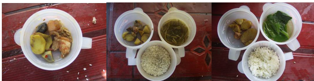
图 18 菜品留样及登记组图