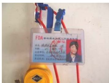
图 19 厨师健康证图