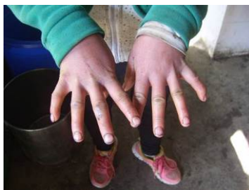
图 6 厨师手部图

(1) “厨工手部”扣除 2 分, 扣分原因是厨师指甲修剪的还可以, 就是指甲里泥垢较多 (附图片)。