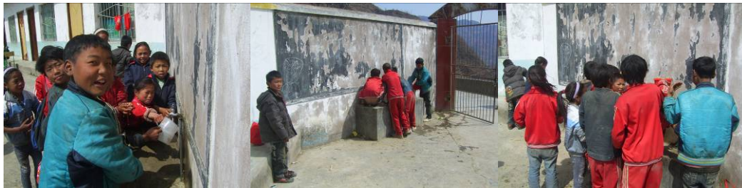
图 13 部分学生餐前洗手组图

(8) “学生饭前是否洗手”扣除 2 分, 扣分原因为学校具备洗手条件, 但没有要求所有学生餐前洗手 (附图片)。