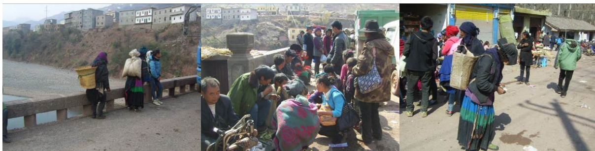
图3 尔合乡达洛村村民前往牛牛坝赶集组图