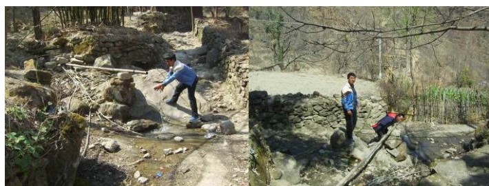
图 17 学校山后的温泉是师生和村民生活用水的保障