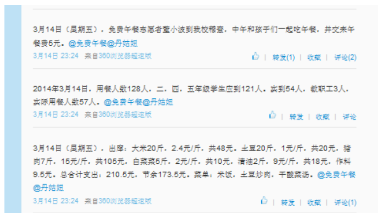
图5 就餐人数的微博截图

当日就餐人数:学生53人(请假68人)+厨师1人(1人请病假)+老师2人(1人请假)+志愿者1人=57人(志愿者缴餐费5元)。实际用餐人数与该校微博公示内容基本一致,当日用餐学生应为53人,厨师1人(1人请病假),老师2人(1人请假)和志愿者1人共57人。