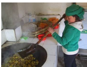
图 7 厨师的着装图

(2) “厨工工作服着装”扣除 2 分, 扣分原因是有工作服但没穿, 着装比较干净整洁 (附图片)。