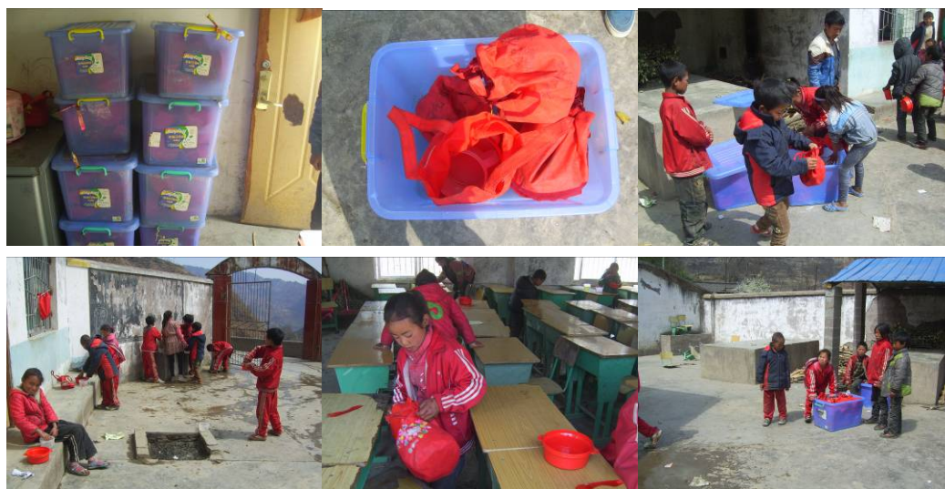
图11 学生餐具保存组图

(6)“是否消毒”扣除 2 分,扣分原因为学校没有消毒机,学生的餐具不是每天消毒,而是厨师每两天用热水为餐具消毒一次,餐具每天由厨师统一保存在厨房(附图片)。