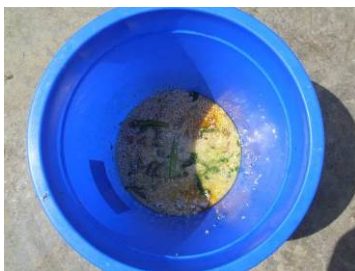
图 23 近 60 人用餐剩下的饭菜图