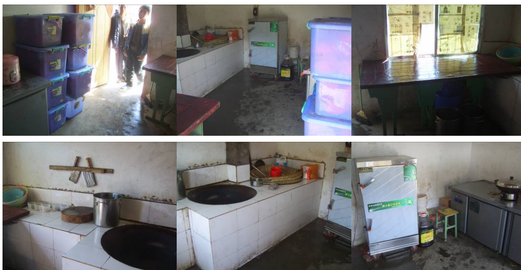
图 16 餐后厨师按要求搞好了厨房卫生组图（从而体现了学校对指出的问题坚决改正的决心）