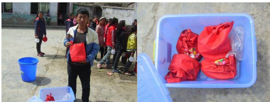
图 15 学生的餐具每人一个袋子且写上学生名字, 统一装在塑料箱子组图