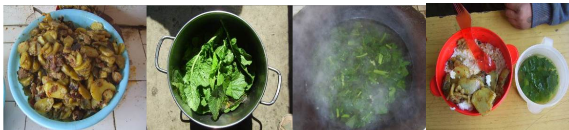
图 20 学生菜品单调, 学校为调解伙食口味把后院菜地种的青菜熬成青菜汤供学生食用组图