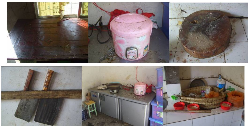
图 8 厨房工作环境图

(3) “厨房工作台”扣除 5 分, 扣分原因因为工作台上不太干净, 平时老师煮饭的小电饭煲外表太脏, 且放在冰柜上有杂物太多, 切肉的案板没有及时清理残渣, 用过的刀不清洗就放上刀架, 灶台上的碗里残留剩饭 (附图片)。