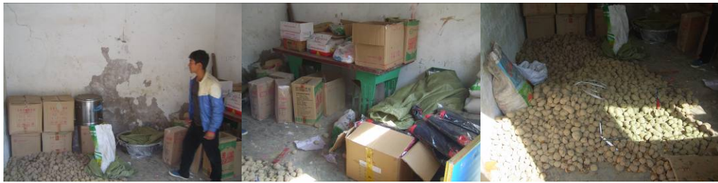
图 12 学生餐具保存组图

(8) “学生饭前是否洗手”扣除 2 分, 扣分原因为学校具备洗手条件, 但没有要求所有学生餐前洗手 (附图片)。