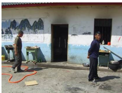
图 6 刚见厨师时的着装图

(1)“厨工头部”和“厨工工作服着装”各扣除 2 分,扣分原因为调查人员调查当日厨师刚开始没有按规定着工作服,而是着自己的衣服,但比较干净整洁,没有戴帽子,头发也比较干净(附图片)。