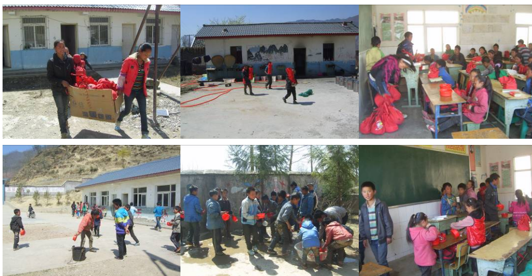
图 13 学生餐具在餐前和餐后妥善保管与清洗消毒组图