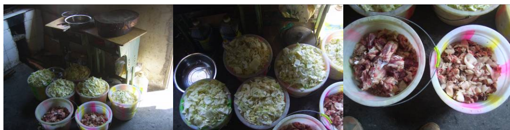
图9 蔬菜与肉类分开存放组图