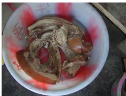
图 8 易变质食物妥善处理保存图

(3)“易变质食物保存”扣除 2 分,扣分原因为学校不通电,没有电器设备,不能用冰箱储存肉类等易变质食物,但厨师提前把肉煮熟,妥善短暂保存,没有安全隐患(附图片)。