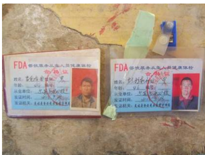
图 21 厨师的健康证