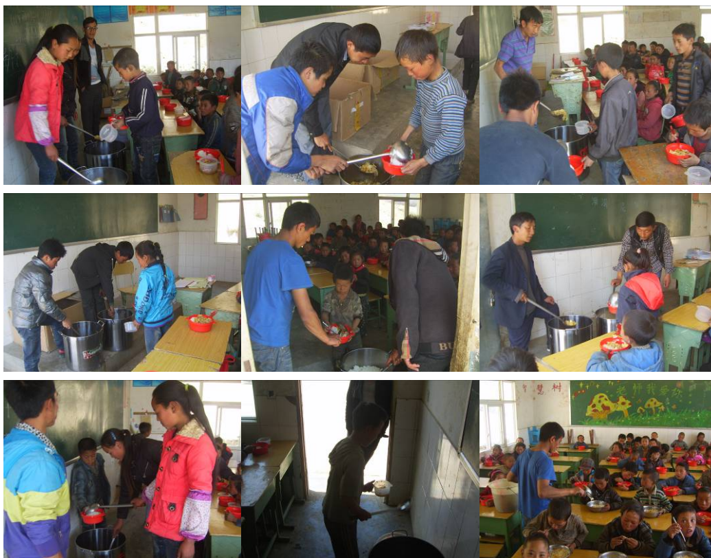
图 24 各班老师和班干部为学生有序分餐，并为不够吃的学生加餐