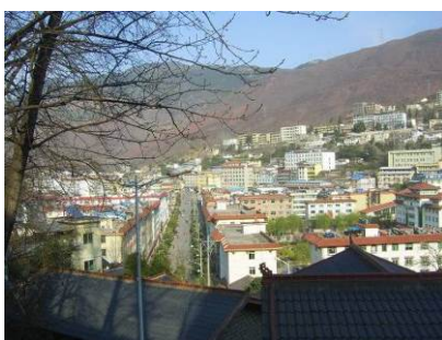
图 2 美姑 县城

美姑县是最早被国家认定的 141 个贫困县之一。2004 年, 美姑县辖 1 个镇 (巴普)、35 个乡 (觉洛、巴古、农作、瓦古、尔其、拖木、炳途、瓦西、采红、苏洛、竹库、典补、龙门、洒库、九口、柳洪、龙窝、子威、尔合、哈洛、尼哈、乐约、树窝、合姑洛、候古莫、牛牛坝、依果觉、峨曲古、佐戈依达、拉木阿觉、洛莫依达、井叶特西、依洛拉达、候播乃拖、洛俄依甘)。