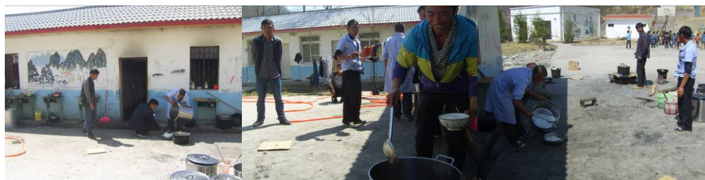
图 17 老师没饭吃组图

(1) “饭菜分量”扣除 2 分, 扣分原因为老师组织学生就餐, 学生吃饱了, 老师没饭吃, 厨师没有把握好就餐人数, 导致饭不够吃 (附图片)。