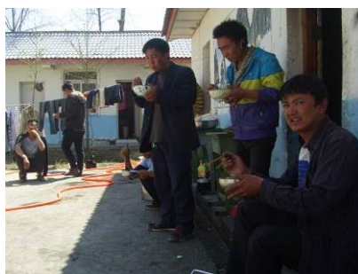
图 19 老师就餐图

(2) “师生同餐”扣除 2 分, 扣分原因为饭不够吃, 有部分老师没有吃饭, 教导主任回应, 学校老师一直是先组织学生就餐, 尔后才用餐, 经常遇到没饭吃的情况, 就凑合吃一顿, 一切为了孩子 (附图片)。