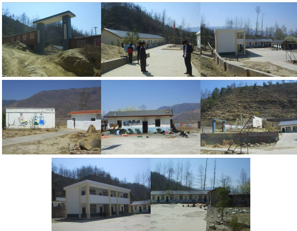
图 4 学校组图

该校现有教学班 6 个班级, 一至六年级, 共有学生 389 人, 教师 13 人, 厨师 3 人。