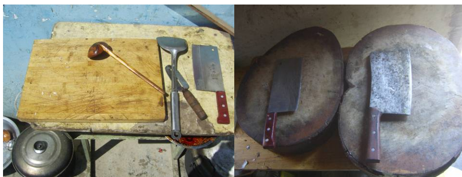
图10 工作台生食与熟食分离组图