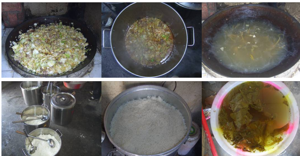
图 22 当日饭菜组图