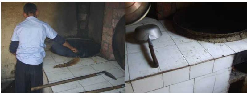
图 7 厨房工作台组图

(2)“厨房工作台”扣除 2 分,扣分原因为厨师在灶台上操作过程中不能保持干净整洁,(附图片)。