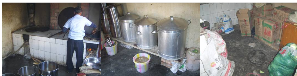
图11 厨房的地面清扫的比较干净且无存留的积水组图