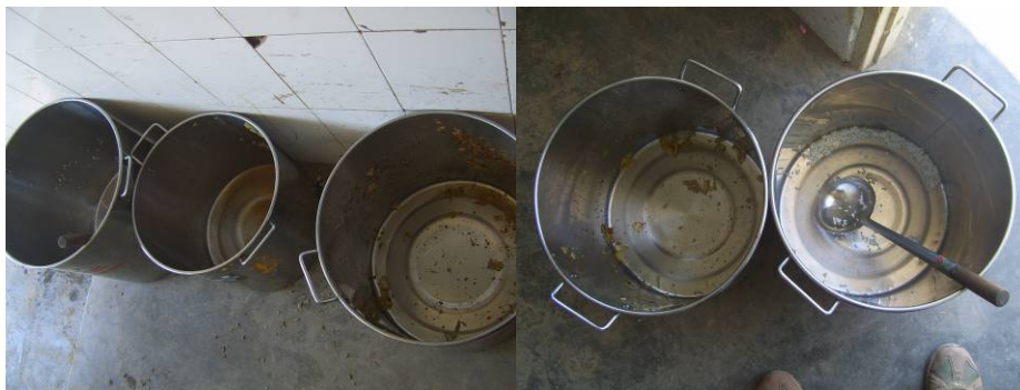
图 26 餐后各班学生的桶里都比较干净