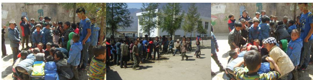
图 16 学生餐前洗手组图