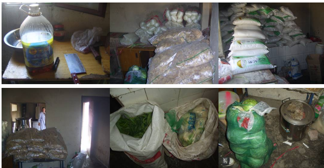
图 15 食材储藏有序安全隔离组图