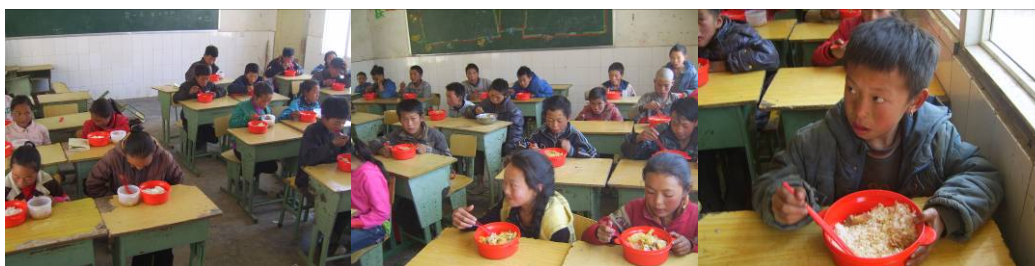
图 25 学生用餐组图