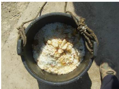
图 20 学生餐后剩下的饭菜图

(3) “浪费情况”扣除 2 分，扣分原因为垃圾桶的剩饭剩菜与吃饭人数比例来看显的有点多，调查人员认为学生倒掉这么多饭菜，而老师和厨师又无饭吃，这有些让人哭笑不得。教导主任回应孩子们有时吃的多，有时吃的少，厨师不太好控制，饭打的少了担心有失公平，必须让孩子吃饱饭为目的（附图片）。