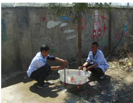
图12 厨师提前盛好清水放入清洗液供学生餐后清洗餐具图