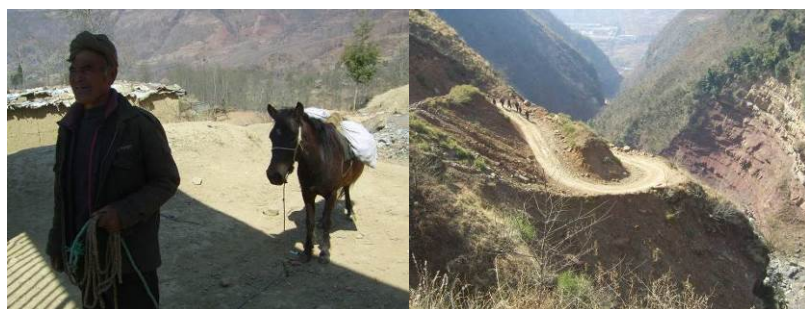
图 3 尔其乡的村民购货赶路组图

尔其乡位于县城南部。正东和东北面连接瓦古乡, 南临溜筒河与拉木阿觉乡相连, 西毗洛俄依甘乡, 西北与子威乡接壤, 地处海拔 1800 米。距县城约 58 公里, 不通公路, 乡村土路占 5 公里。山路崎岖起伏, 盘旋在峭壁深谷间, 山谷中河水奔流涛声不断, 县城没有直接通往尔其乡中心校所在的尔其村的乡村公交, 交通非常不便。老百姓大多是步行, 购货主要靠背或用牲口拖。乡域面积 37.4 平方公里。地势北高南低, 海拔 1400 ~ 3200 米之间。辖吉觉尔其、色口、瓦鲁、依惹、甲拉 5 个村, 27 个组, 共 559 户, 2499 人。