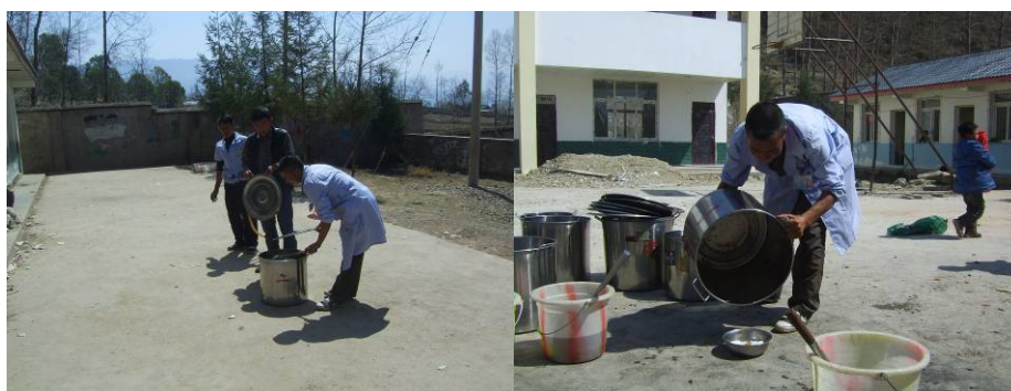
图 14 厨师从教室取走吃空的餐桶在厨房门口统一清洗消毒组图