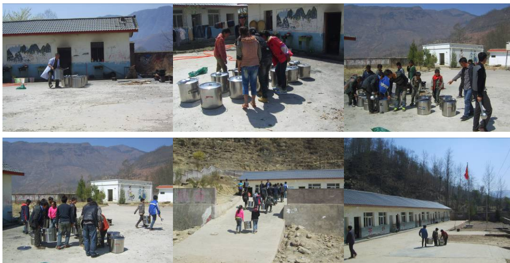
图 23 厨师把准备好的午餐按照各班级在餐桶上的标号整齐的摆放在厨房门口，学生在老师的组织下陆续把午餐抬回教室用餐