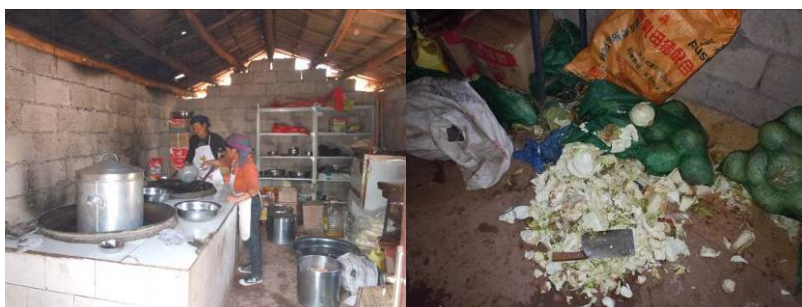
图6 厨房墙面及地面

关于“墙地面卫生”，调查当日，厨房墙地面卫生状况较差，故该项评分取1分（见图6）；