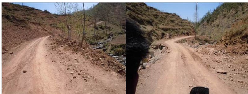
图 1 洒库乡至岗洛村小的路况

4 月 15 日, 调查人员自美姑县汽车站乘坐前往洪溪方向的客运班车, 约 1 小时 10 分钟左右抵达洒库乡 (10 元), 随后换乘摩托车前往岗洛村小学 (50 元)。自洒库乡至岗洛村小约 3.5 公里, 一半路面硬化, 其余为泥石土路, 路况差。结束对该校调查后, 调查人员在该校马卡大良老师的帮助下搭乘摩托车回到洒库乡 (20 元), 前往洒库乡中心校了解了相关情况后在中心校门口搭乘过路班车回到美姑县城 (15 元)。