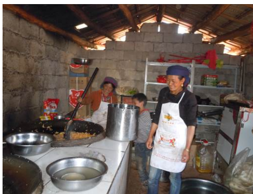
图 4 炊事员正在备餐

关于“厨师头部卫生”，调查当日 2 名炊事员均未戴工作帽上岗，自身头发卫生状况尚可，故该项评分取 3 分（见图 4）；