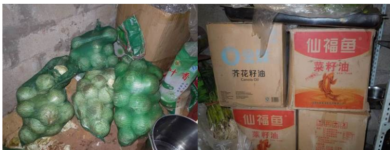
图 8 随意放置在地上的蔬菜及其他食材

关于“当前食材存储变质腐坏情况”，调查当日，调查人员在查看肉类食材存放时发现存放于冰柜中的猪肉已明显变质，并散发出浓烈的腐败臭味，同时，该冰柜卫生条件极差，故该项评分取 0 分（见图 9）；