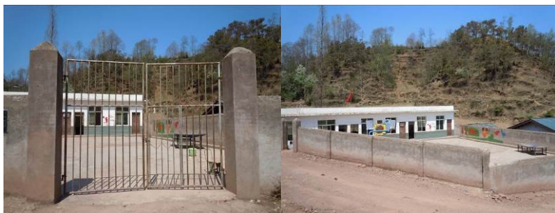
图 2 学校大门及校园环境

岗洛村小学位于四川省凉山州东部的美姑县洒库乡岗洛村, 距离洒库乡约 3.5 公里, 距离美姑县城约 43.5 公里。学校所在地属典型的僻远山区, 当地居民生活水平极低, 主要以农牧业及外出务工为主要经济来源。岗洛村小学原址在现址背后的小山坡上, 2011 年, 当地政府对该校进行了迁建, 现教学用房为一幢 3 间平房, 无办公用房等配套。该校现有一、二、四年级 3 个班共 129 名学生 (含 4 名旁听生), 教职工 8 人 (其中 5 名来自大凉山以外地区的大学生支教老师, 1 名在该校任教超过 40 年的老代课教师及 2 名炊事员), 全校纳入免费午餐计划共计 137 人, 自 2012 年 11 月起接受免费午餐基金资助并与国家营养改善计划配套开展午餐正餐。