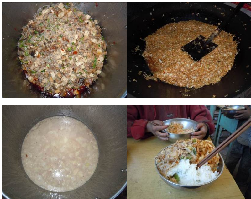
图 10 当日菜品组图

关于“荤菜率”，调查当日有一个荤菜（粉条豆腐炒肉），但肉的可见数量较低（详见图 10），同时，调查人员查阅了该校前两周的微博，从微博公示来看，仅周二、周四有肉，其余开餐时间均没有荤菜；