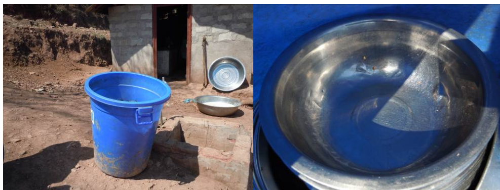
图7 存放餐具的大塑料桶及餐具局部

关于“餐具消毒”，调查当日，未见该校餐具消毒过程，也无相关记录，同时，餐具存放条件及卫生条件均较差，故该项评分取1分（见图7）；