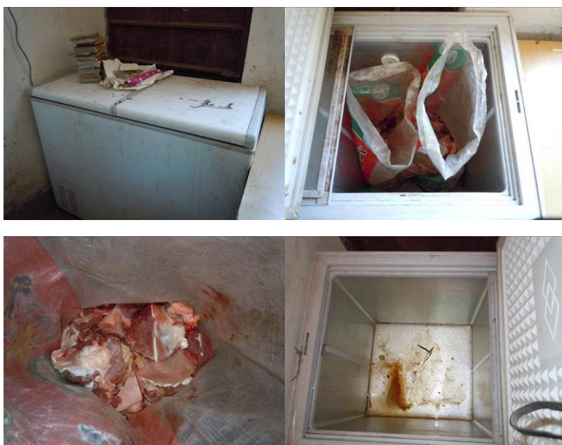
图 9 冰柜外观及储藏的猪肉

关于“当前食材存储变质腐坏情况”，调查当日，调查人员在查看肉类食材存放时发现存放于冰柜中的猪肉已明显变质，并散发出浓烈的腐败臭味，同时，该冰柜卫生条件极差，故该项评分取 0 分（见图 9）；