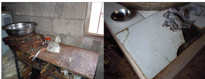
图5 工作台及灶台一角

关于“墙地面卫生”，调查当日，厨房墙地面卫生状况较差，故该项评分取1分（见图6）；