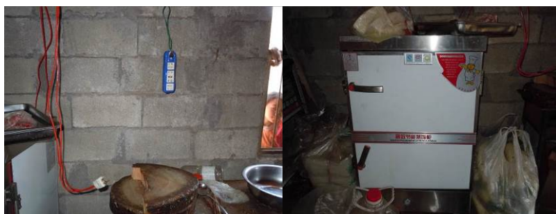
图11 插头已烧坏的蒸饭机

关于“设备维护”,调查当日,调查人员现场注意到该校的电力蒸饭机及冰柜均无法正常工作。据该校一名来自四川的支教老师介绍,蒸饭机和冰柜已有一段时间不能使用,向中心校报修后还未来人处理。故该项评分取0分(见图11);