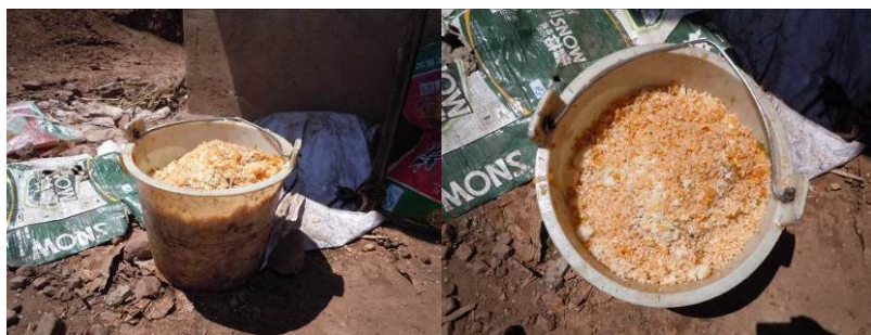
图 12 就餐结束后的泔水桶

关于“浪费情况”，调查当日，该校学生在就餐结束后浪费严重，就餐结束后在该校厨房门口可见一泔水桶，剩饭菜几乎装满一桶，浪费量约 10 余斤，从倾倒的剩饭菜来看，主要以米饭为主（当天米饭夹生）。故该项评分取 1 分（见图 12）；