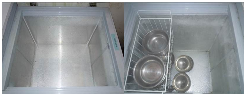
图 5 空空如也的冰柜

关于“当前存储食材变质腐坏情况”，调查当日，调查人员注意该校日常采购的蔬菜（莲花白）已出现明显的变质，从食材表面上看，虽然有及时将变质的菜叶剥去（损耗明显），但部分莲花白表面还是有菜叶变质。调查人员已现场提醒该校注意该食材的采购周期，避免使用不及时而变质、损耗。根据评分规则，该项评分取 0 分（见图 6）；