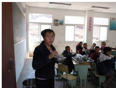
图 11 在教室与学生一同进餐的老师