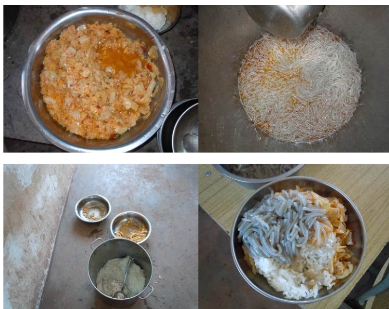
图 7 调查当日菜品

关于“荤菜率”，调查当日，该校午餐没有安排荤菜，查阅该校微博近一月的用餐出库公示，可发现该校日常每周仅为孩子们安排两次荤菜，故该项评分取 0 分（见图 7）；