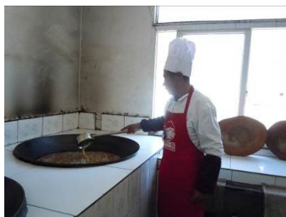
图 9 规范着装、持健康证上岗的厨师

该校在午餐执行管理上总体情况良好，无明显瑕疵。有关执行管理的情况见图 9、10、11。