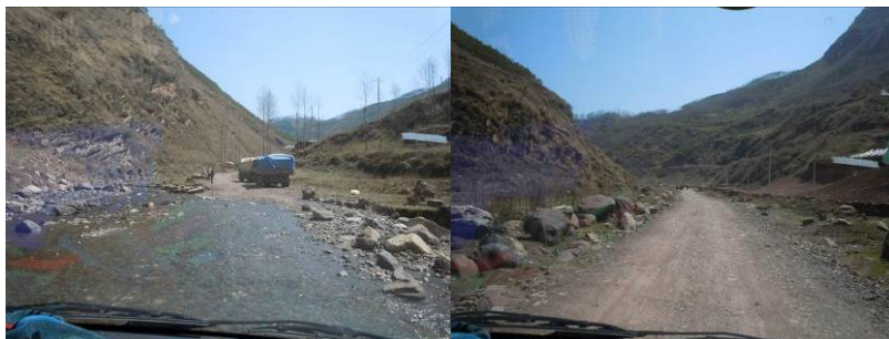
图 1 洪溪至依德阿门村小的路况

4 月 14 日, 调查人员自美姑县汽车站乘坐前往洪溪方向的客车, 约 1 小时 40 分钟后抵达洪溪 (依果觉乡), 随后在洪溪片区中心校 (依果觉乡中心校) 地日阿甲校长的带领下乘面包车前往依德阿门村小。自洪溪街上至依德阿门村小学约有 4 公里左右, 为泥石土路, 路况尚好。结束对该校的调查后, 调查人员乘坐面包车回到洪溪街上, 转乘客运班车回到美姑县城 (12 元)