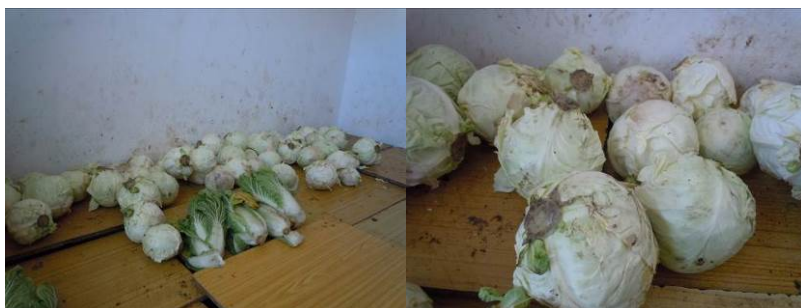
图 6 已出现变质迹象的莲花白

关于“当前存储食材变质腐坏情况”，调查当日，调查人员注意该校日常采购的蔬菜（莲花白）已出现明显的变质，从食材表面上看，虽然有及时将变质的菜叶剥去（损耗明显），但部分莲花白表面还是有菜叶变质。调查人员已现场提醒该校注意该食材的采购周期，避免使用不及时而变质、损耗。根据评分规则，该项评分取 0 分（见图 6）；