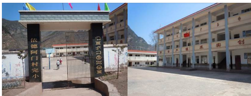
图 2 学校大门及校园环境

依德阿门村小学位于四川省凉山州东部的美姑县依果觉乡依德阿门村, 距离依果觉乡约 4 公里, 距离美姑县城约 53 公里。该校所处位置偏僻, 属典型的大凉山山区, 当地居民均系彝族, 生活水平极低, 主要以农牧业为主要经济来源。该校属国家营养改善计划覆盖学校, 现有在校学生 183 人 (均系义务教育阶段学生), 教职工 10 人 (其中炊事员 2 人, 门卫 1 人), 全校纳入免费午餐计划共计 193 人, 自 2012 年 11 月起接受免费午餐基金资助并与国家营养改善计划配套实施供应正餐。