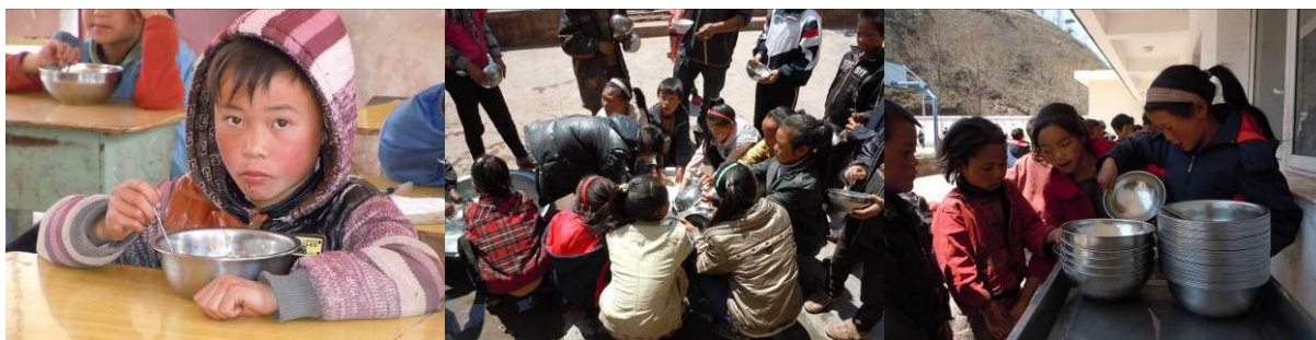
图 8 学生就餐组图