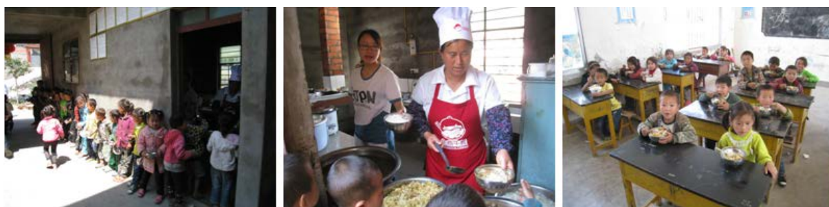
图 7 学生排队、领餐和用餐组图

调查人在校期间,查看了厨师的健康证,在有效期内。在厨房查看了该校的冰箱等设备,均使用正常。查看了该校的菜品留样,并在留样冰柜前看到其留样登记表。教师无专门的教师餐厅,有自己的餐具,学生用餐完毕后,老师们在厨房门口围桌就餐。餐后,调查人观察了学生的整个用餐过程,发现有学生倾倒饭菜的情况。该校的就餐情况是,中午下课后,学生从教室拿着餐具,到厨房门口排队,在厨房门口的分餐台排队领取饭菜,盛饭后,到教室或校园内零散就餐。就餐完毕后,学生在校园或厨房门口的洗漱池清洗餐具,自行保管。