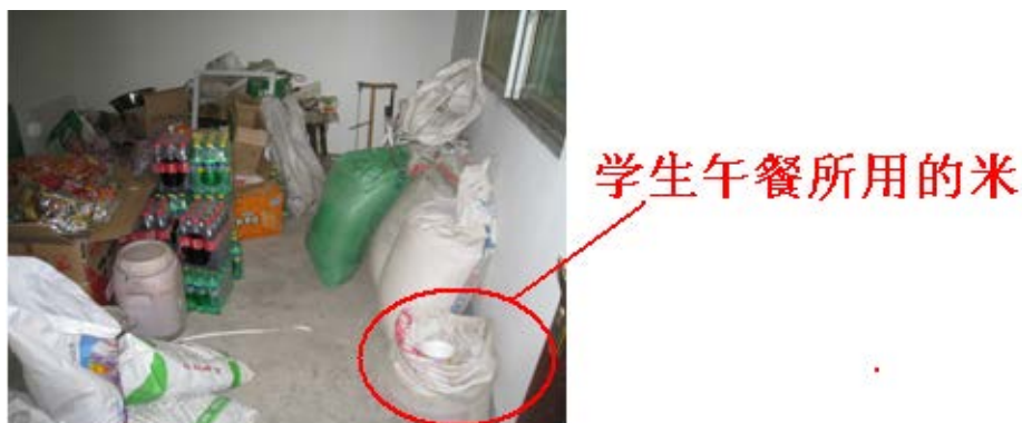
图5 存储食材情况图

(4) “餐具消毒”项得 1 分，理由是该校的学生都是自带餐具，自行保管，无消毒环节，也无相应记录。