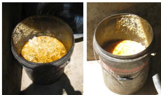
图 9 调查当天该校泔水桶情况图

(2) “浪费情况”项得 3 分, 理由是, 调查人观察学生用餐过程中, 发现有比较明显的学生倾倒饭菜的情况, 之后, 调查人查看了泔水桶, 也发现有明显浪费。