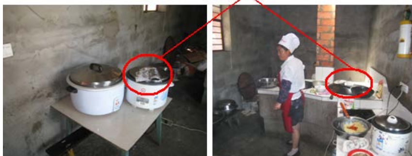
图 4 厨房卫生情况组图

(3) “食材储藏”项得 1 分, 理由是该校午餐所需的米和酸菜等食材在厨师家的小库房存放, 未做隔离和防潮等处理。