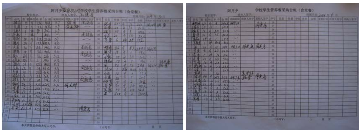
图 10 该校账目管理相关登记表组图

该校的食材采购主要由厨师负责,采购地主要是县城集贸市场。该校市场采购的大致情况是:肉类,每两天采购一次;米为半月采购一次;易存储类食材约一周采购一次;其他蔬菜每天采购。该校在本账目管理环节,现有的登记表仅有《采购台账》一个,而且该账目中涉及校方项目负责人和校领导签字的地方,全部空缺,而且该表在厨师处保管。