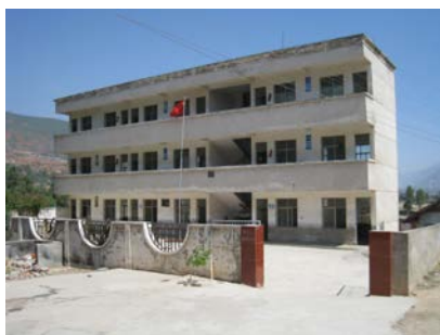
图 1 学校外景图

该校午餐工作相关责任人：余光贵，校长，负责学校全面工作；凌培超，教师，具体负责学校免费午餐项目工作；周莲香：厨师，负责蔬菜类食材的采购、样品留样和台账登记工作。