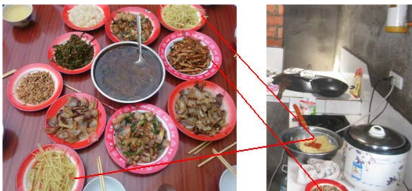
图 8 教师餐厅及当天菜品组图

(1) “是否同餐”项得 1 分, 理由是, 当天中午的菜品比学生菜品多两素一荤, 两素是炒土豆丝和凉拌豆腐干, 一荤是煎腊肉。吃饭间, 厨师和多位教师介绍说, 肉菜是用来招待调查人, 厨师自家的菜。但调查人在刚到校查看厨房时, 就发现了两个素菜的半成品。另外, 据调查人观察, 厨师一家人是先后和老师一起用餐的。