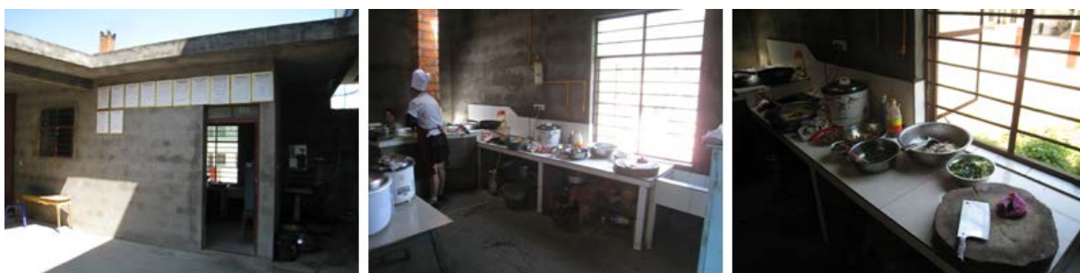
图 3 厨房情况组图

该校的厨房及食材储藏间是租用的校园临近的居民用房。厨师是该出租屋的出租方。本项目涉及的调查主要包括厨师卫生、厨房卫生、食材储藏卫生和学生餐前洗手等方面。 厨师卫生方面 ，调查人约 11 点半到达该校，现场见到一位厨师，其中还有厨师的一位家人在帮厨，未着工作服。调查人查看了两人的个人卫生情况，头部和手部等情况良好。 厨房卫生方面 ：厨房的整体整洁度尚可，但同样存在苍蝇较多的情况，详情见本节待改进和完善部分。 食材存储方面 ：据了解，该校的食材基本都是当天采购、当天使用，也有如大米和酸菜等备用食材，学校的此类食材分散存放于厨师家的小库房（注：厨师家本身经营着一个小便利店），摆放的整洁度一般，未做隔离和防潮处理。 学生餐前洗手环节 ，本环节详见本节“待改进和完善部分”。学生餐具都自行保管、自行清洗。