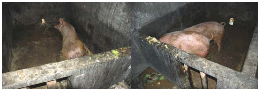
图 15 学校养了 3 头猪