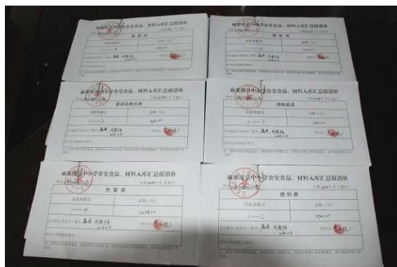
图 17 入库登记