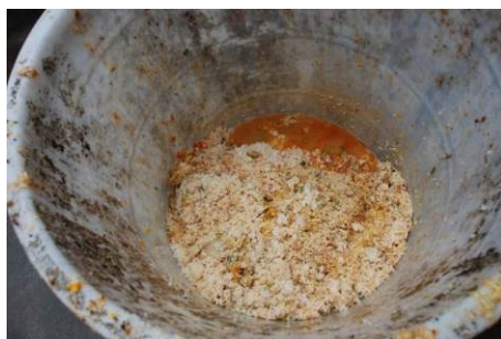
图 13 剩饭菜在正常范围