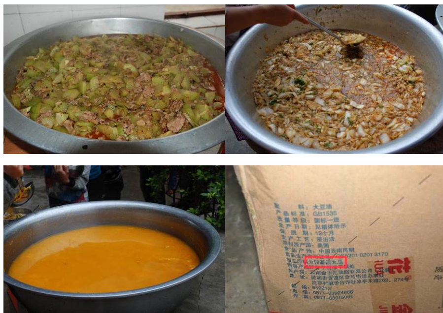
图 7 当天菜品 (学校采购的是转基因大豆油)