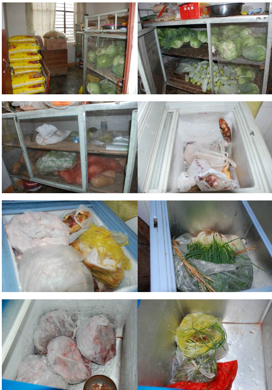
图5 就食材储存图组（未见腐烂变质食材）