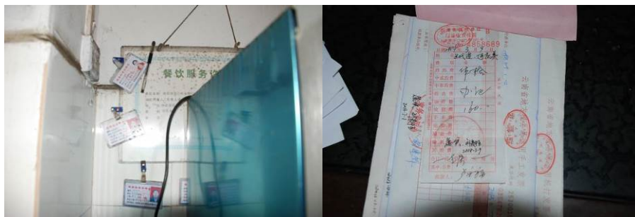
图 8 健康证 (新证还在防疫站没拿回来)

(2) “设备维护”项扣除 2 分, 扣分原因为消毒柜未接电正常使用。(见图 9)