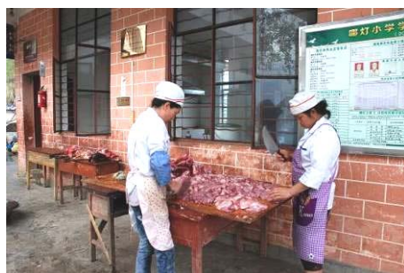
图6 学校新购了一头猪的猪肉，厨师正在处理