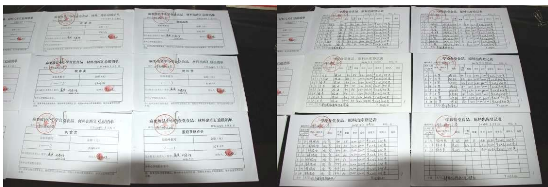
图 18 出库登记