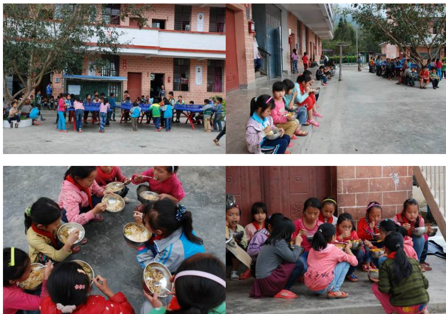
图 12 学生在外用餐图组