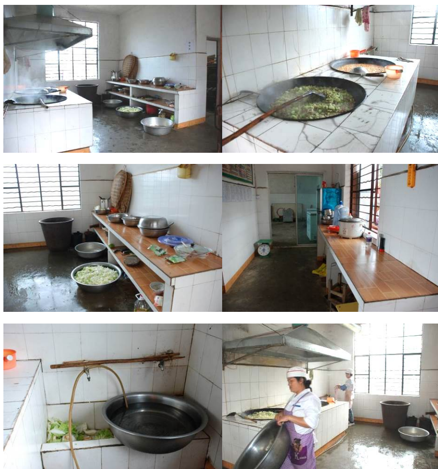
图 4 厨房及厨师图组

(2) “餐前洗手”项扣除 2 分，扣分原因为学校不具备洗手条件（学校只有一个小洗手池），学生餐前没洗手。（见图 14）