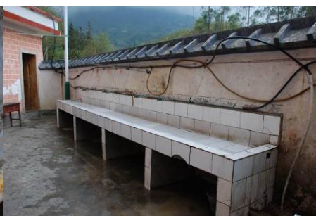
图 14 洗手池