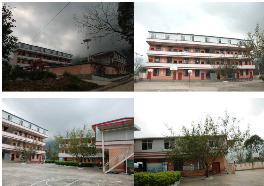
图 2 学校外观组图