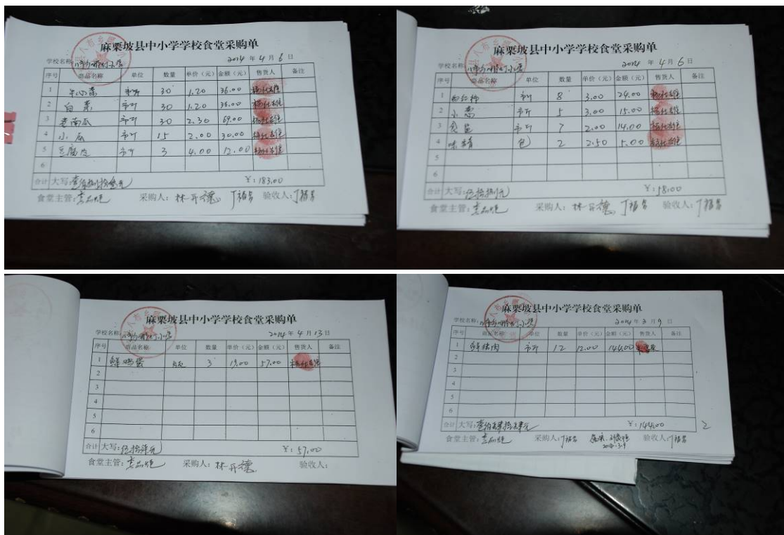
图 16 原始凭证