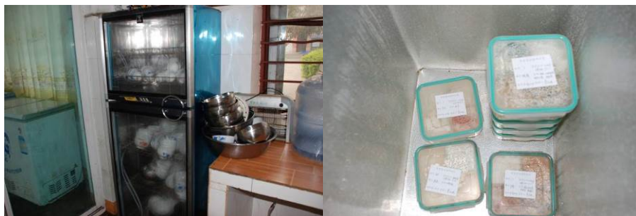
图 9 消毒柜未正常使用 (未插电)