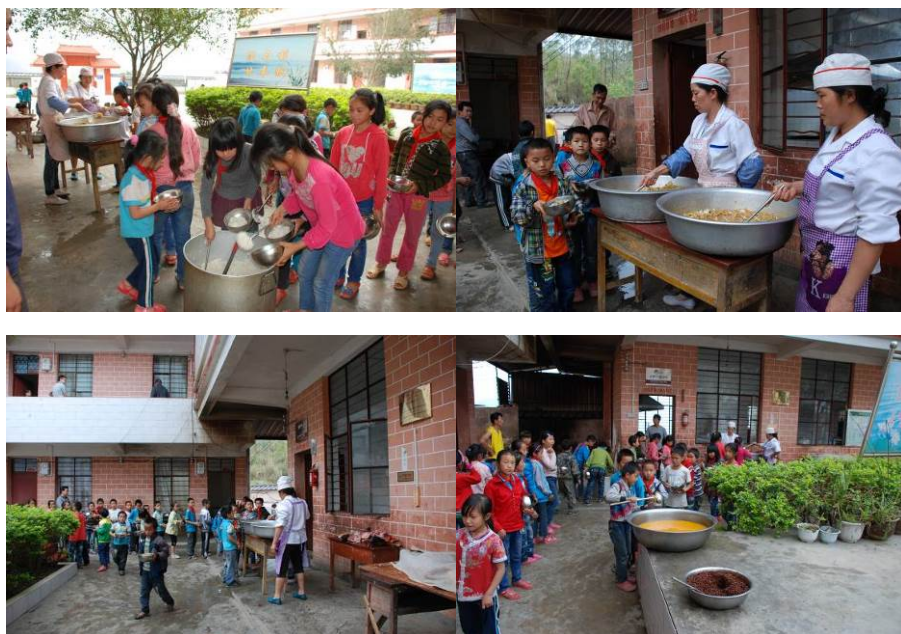
图 11 学生排队分餐图组