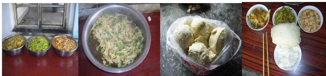
图 17 当日菜品组图