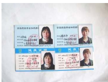
图 15 厨师健康证图