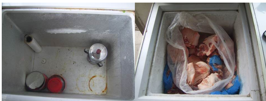
图 11 易变质食物保存