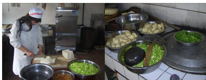
图 10 工作台生熟食分离