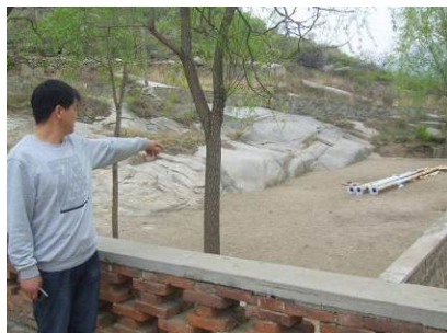
图 2 学校预重建新食堂图