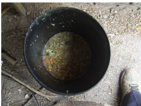
图 22 当日剩菜剩饭