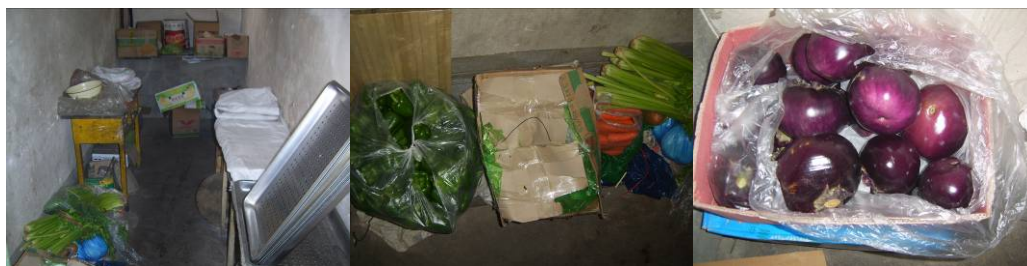
图 12 食材储藏