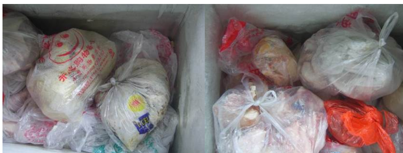
图 7 生熟食存放组图