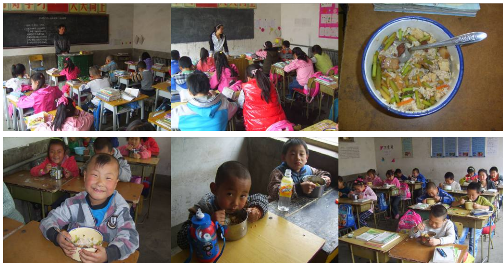
图 19 学生用餐组图