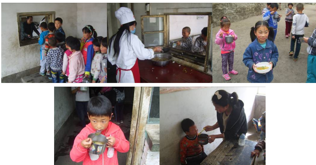
图 20 没吃饱的学生加餐加汤