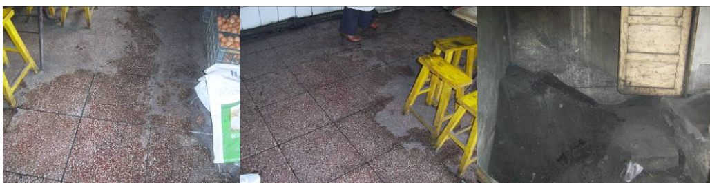
图 9 地面墙面卫生