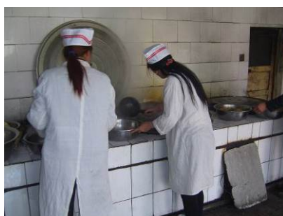
图 6 厨师形象良好图