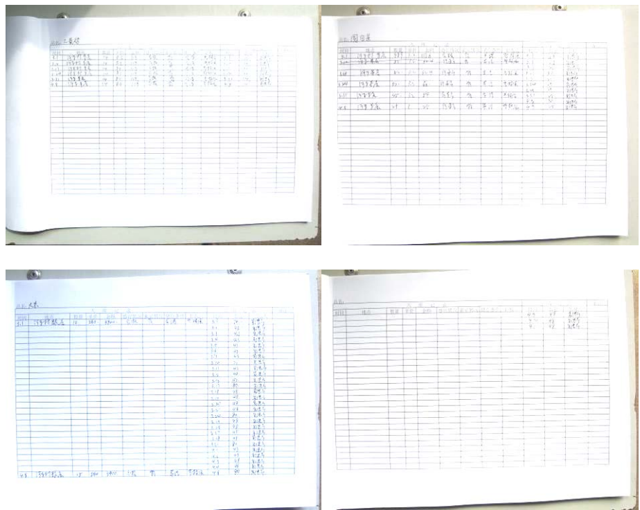
图 24 入出库登记组图

(4) “入出库登记”各扣除 2 分，扣分原因为相关信息不完整，许多货物没有登记，只有大米、圆白菜和三黄鸡的出入库登记（附图片）