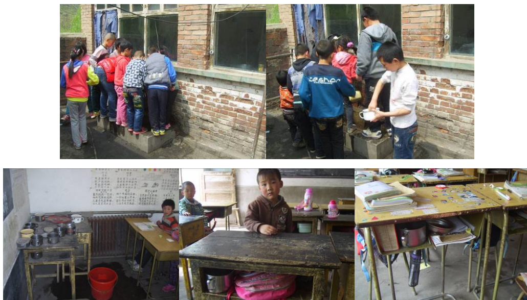
图 5 学生餐具清洗与存放组图

“餐具消毒”扣除 4 分，扣分原因为学生餐具均由自己清洗后存放在教室，没有防护隔离的安全措施，夏季来临，容易遭到苍蝇、蟑螂等带来的污染，存在一定安全隐患（附图片）