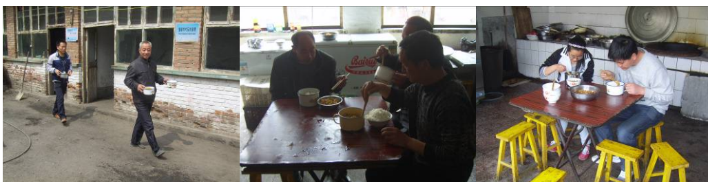
图 21 老师组织学生用餐结束后有的打饭回宿舍或在厨房用餐