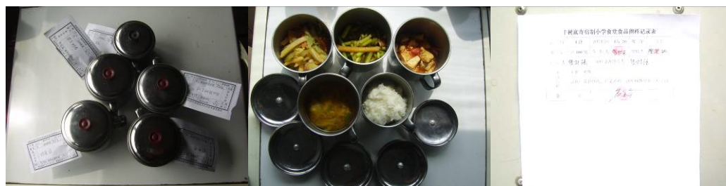
图 16 整改后的菜品留样及登记组图