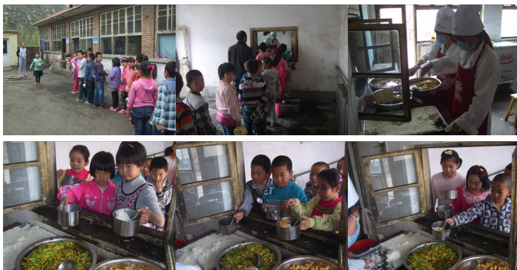
图 18 学生分餐组织有序自由选择菜品