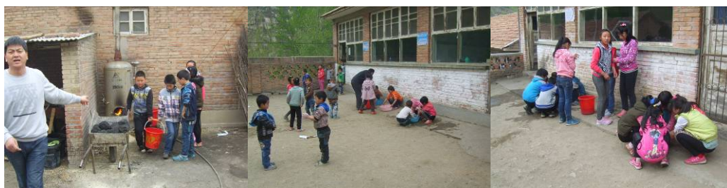
图 13 学生餐前打热水洗手