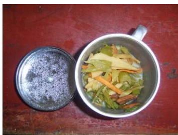
图 14 菜品留样图

“菜品留样”扣除 2 分, 扣分原因为菜品留样简单, 且没有及时登记 (附图片)