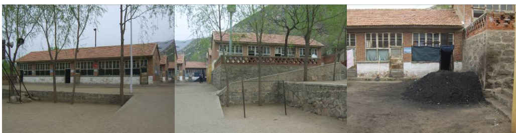
图 1 学校组图