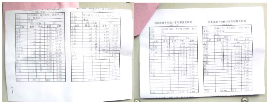
图 23 原始凭证组图

(4) “入出库登记”各扣除 2 分，扣分原因为相关信息不完整，许多货物没有登记，只有大米、圆白菜和三黄鸡的出入库登记（附图片）