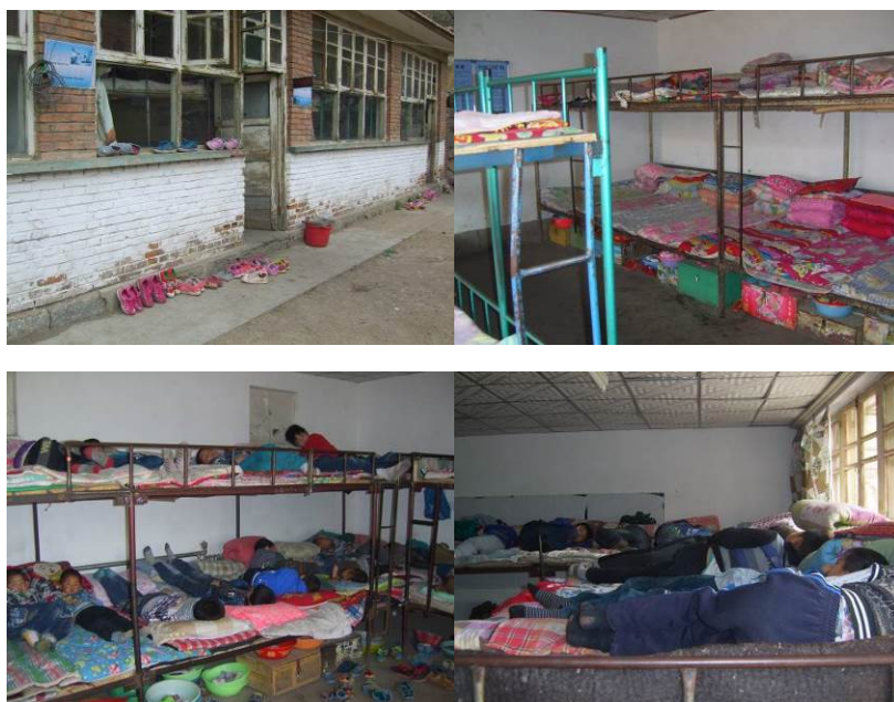
图 3 学生的宿舍和午休组图