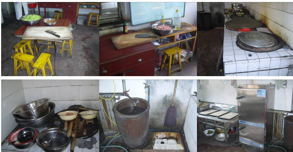
图 8 厨房工作台