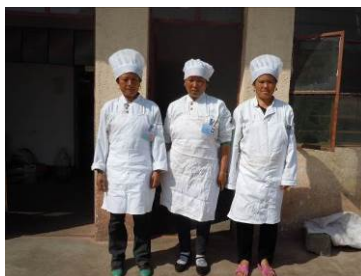
图5 统一着装并持有效健康证上岗的炊事员