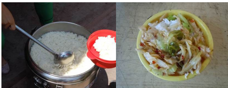
图 7 调查当日饭菜组图