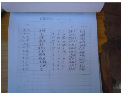
图 9 采购入库记录（数据与出库记录数据完全一致）

关于“入库记录”，调查当日，从该校出示的采购入库记录来看，未据实列支，而是将出库记录的数据当作采购数据登记，不具备参考意义，故该项评分取 1 分（见图 9）；