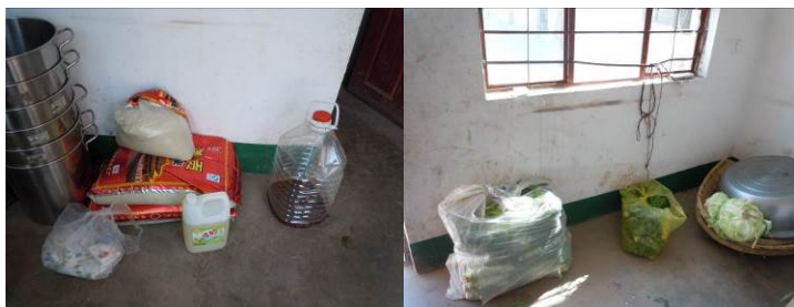
图4 随意放置在地上的各种食材

关于“食材储藏”，调查当日，调查人员在该校厨房及食材储藏室注意到该校库存食材均随意直接放置在地上，包括大米在内均无任何隔离措施，故该项评分取1分（见图4）；