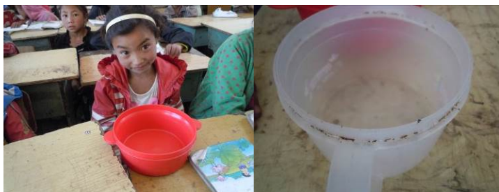
图3 学生从课桌里拿出餐具及餐具卫生状况特写

关于“餐具消毒”，调查当日，调查人员注意该校学生餐具均系学生自行保管，且餐具卫生状况较差。调查人员对部分学生进行了询问，均表示学校从未对自己的餐具进行任何消毒，故该项评分取1分（见图3）；