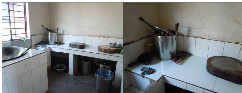
图 6 厨房全景及局部