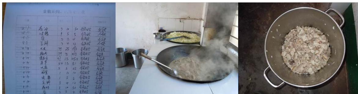
图10 与采购记录完全一致的“出库记录”

关于“出库记录”，调查当日，从该校出示的出库记录来看，该出库记录中的数据未根据实际使用情况登记，存在明显的虚报，不具备参考意义，故该项评分取1分（见图10）；