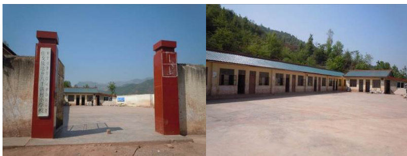
图 1 学校大门及校园环境

八千洛村小学位于四川省凉山州东部的美姑县佐戈依达乡（新桥）八千洛村，距离佐戈依达乡约 4 公里，距离美姑县城约 20 公里。学校所处位置系典型的大凉山山区，自然条件恶劣，当地居民生活水平极低，学生家庭主要以农牧业及外出务工为主要经济来源。八千洛村小学系国家营养改善计划覆盖学校，现有在校学生共计 306 人（含学前班 70 人及旁听生 1 人），教职工 10 人（其中炊事员 3 人），全校纳入免费午餐计划共计 316 人，自 2013 年 9 月起接受免费午餐基金资助并与国家营养改善计划配套供应正餐。该校现任校长吉以尔夫，午餐食材采购、学校微博维护由校长吉以尔夫负责，午餐账目由海来五果老师负责。